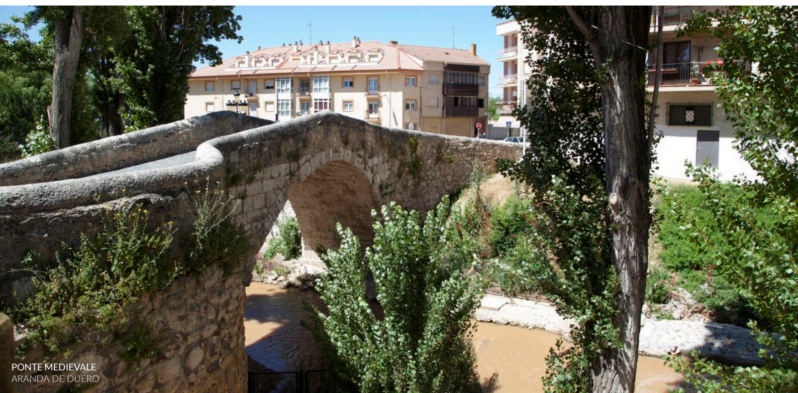
PONTE MEDIEVALE ARANDA DE DUERO

Nelle ultime edizioni si sono aggiunte nuove proposte dedicate alla musica iberoamericana nel parco della Isla e alla tematica e al sound degli anni '60 in piazza Arco Pajarito .