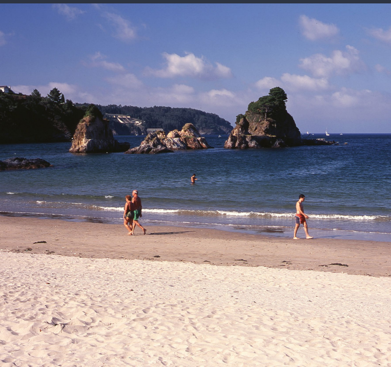
▲ SPIAGGIA DI COVAS - OS CASTELOS VIVEIRO, LUGO

Quattro giorni, quattro palchi e 100 band che si muovono tra hard rock, hardcore, punk, heavy metal e tutte le loro varianti. Si può sintetizzare così la contundente proposta del Resurrection Fest, che generalmente si svolge tra la fine di giugno e i primi di luglio nel fantastico scenario naturale del borgo peschereccio di Viveiro (Lugo).