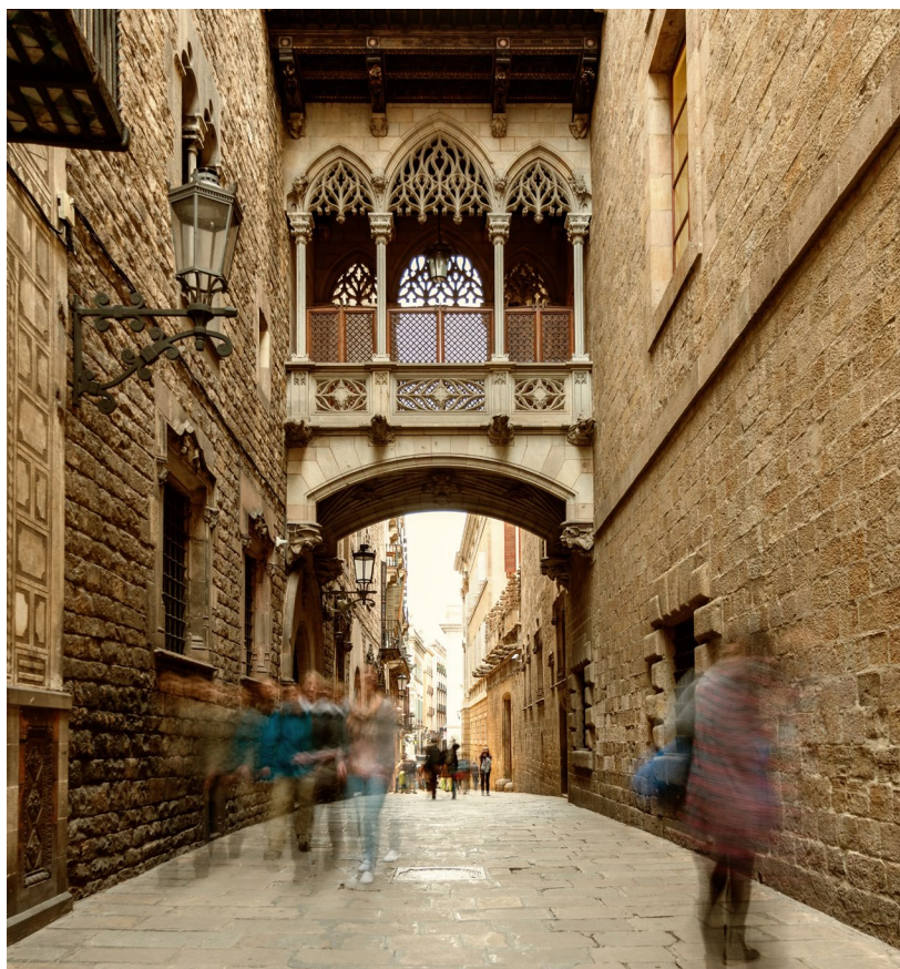
▲ QUARTIERE GOTICO BARCELLONA

Se vuoi approfittare di tutto quello che una città come Barcellona può offrire, è semplice. La vicinanza della sede di Sónar de Día al centro urbano ti permetterà di scoprirne tutte le bellezze. Il capoluogo della Catalogna è la città del Modernismo per eccellenza. Qui potrai ammirare i più grandi gioielli architettonici di Antoni Gaudí, come la Sagrada Família , iscritta nell'elenco del Patrimonio Mondiale dell'UNESCO, e il parco Güell . Cu-