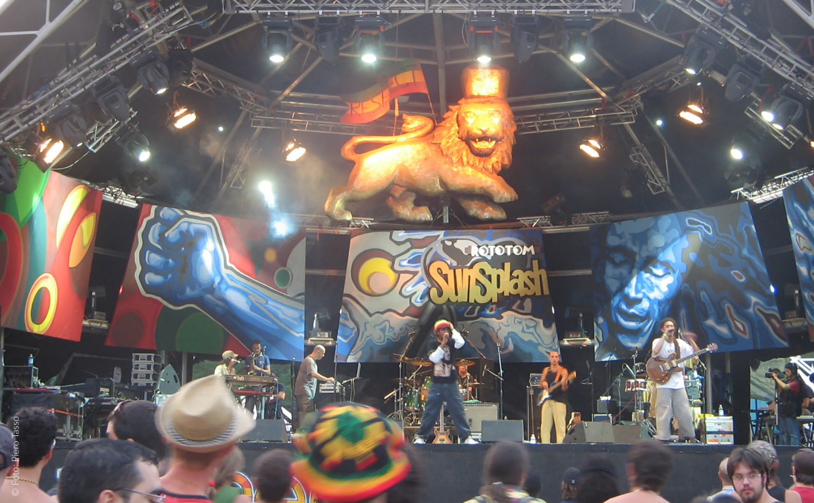
▲ ROTOTOM SUNSPASH BENICÀSSIM