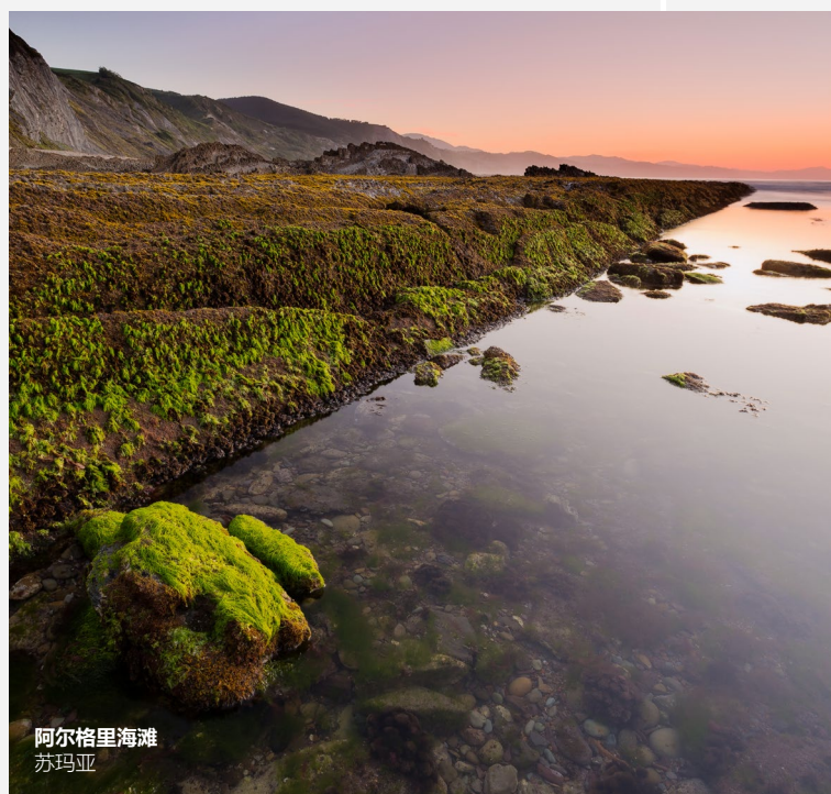
阿尔格里海滩 苏玛亚

游览蜿蜒60公里的吉普斯夸海岸，让面向坎塔布里亚海的悬崖带给你震撼的感觉吧。在小渔村停留一下，下海游个泳，再在海边品尝美食。或者探访巴斯克海岸地质公园，其横跨坎塔布里亚海、巴斯克群山以及穆德里库（Mutriku）、德巴（Deba）和祖马伊亚（Zumaia）地区。