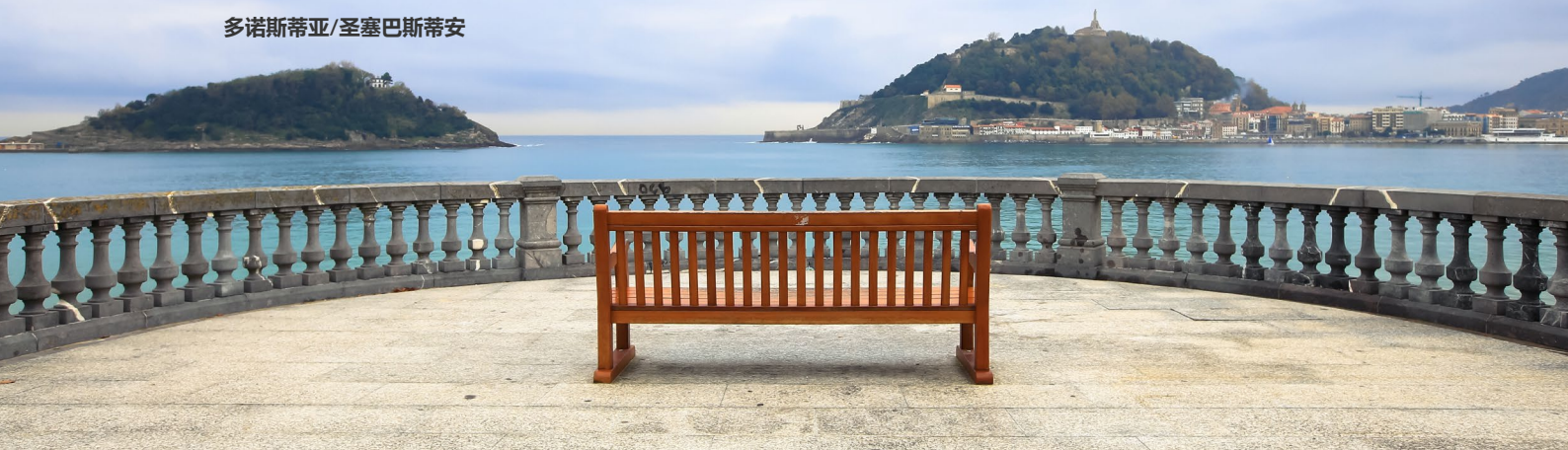
▲ 海滨路 贝壳海滩