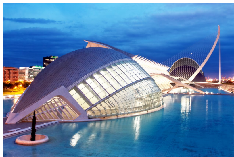
▲ CIUDAD DE LAS ARTES Y LAS CIENCIAS VALENCIA

① Consulta toda la información sobre trayectos y horarios del AVE aquí: www.renfe.com