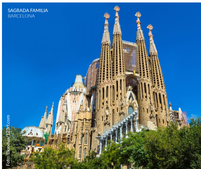
SAGRADA FAMILIA BARCELONA