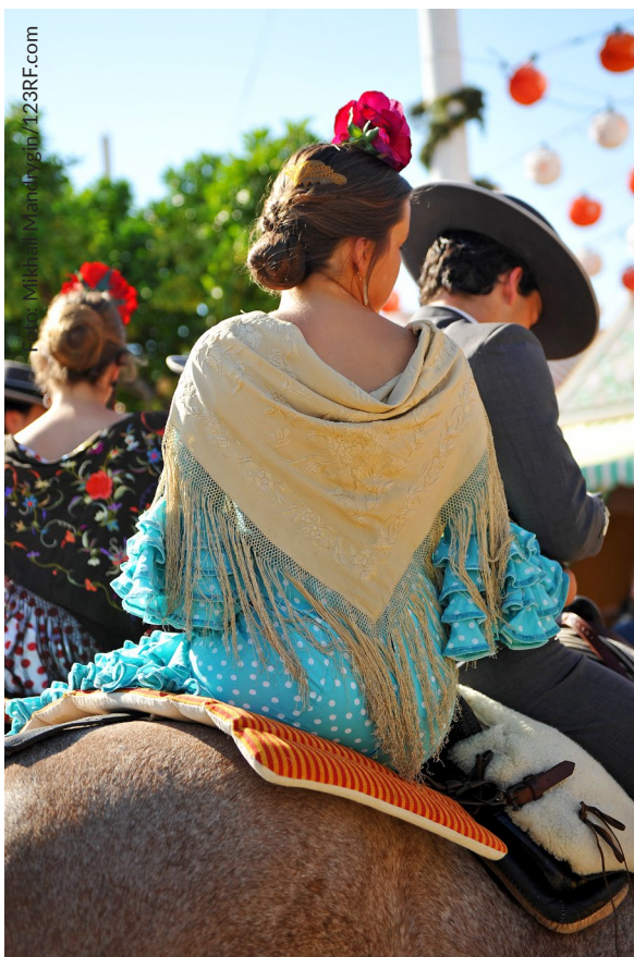
▲ FERIA DE ABRIL SEVILLA