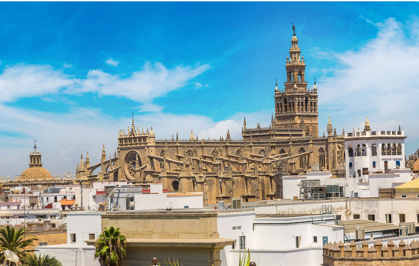
▼ CATEDRAL DE SANTA MARÍA DE LA SEDE SEVILLA

Si viajas durante la Semana Santa o la Feria de Abril , podrás sumarte a algunas de las fiestas populares más impactantes del país.