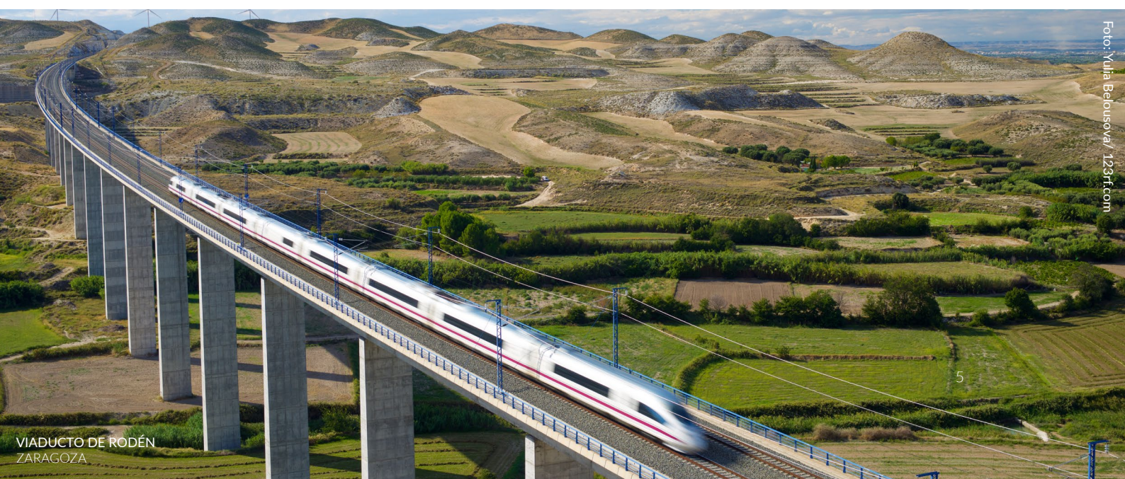
VIADUCTO DE RODÉN ZARAGOZA