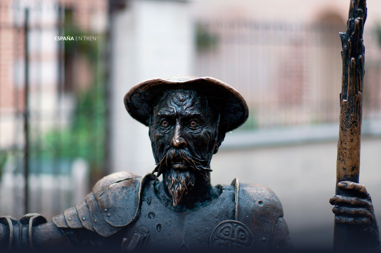
▲ ESCULTURA DE EL QUIJOTE ALCALÁ DE HENARES, MADRID