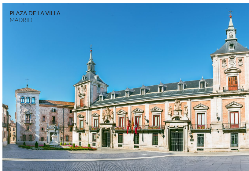
PLAZA DE LA VILLA MADRID

Enamórate de esta ciudad cosmopolita, vanguardista y mediterránea que te sorprenderá a cada instante. Recórrela a pie o en bicicleta y descubre sus barrios, La Rambla y su paseo marítimo. Siéntete en la Edad Media cuando estés inmerso en las callejuelas de su famoso barrio Gótico . Da un salto al Modernismo catalán con Antoni Gaudí: admira su impactante obra maestra a través de la Sagrada Familia o el Park Güell , declarados Patrimonio Mundial por la UNESCO. Mira la nutrida agenda cultural de la ciudad y apúntate a exposiciones, conciertos, funciones... Deléitate con la gastronomía barcelonesa que conjuga tradición y creatividad en los fogones. Permítete un capricho: prueba la repostería artesana y sus vinos espumosos. También puedes llegar a Barcelona en AVE desde muchas otras ciudades como, por ejemplo, Málaga.