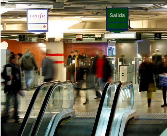
▲ ESTACIÓN PUERTA DE ATOCHA MADRID

Si estás en Madrid, apúntate al Tren Medieval y combina en una sola jornada historia, teatro y gastronomía. El trayecto hasta la villa monumental de Sigüenza , en Guadalajara, se te pasará volando: durante casi una hora y media estarás inmerso en la vida medieval rodeado de actores que interpretan los personajes característicos de la época: trovadores, zancudos, malabaristas... Incluso podrás degustar dulces típicos a bordo. Al llegar a destino, conoce la villa de la mano de guías locales. La majestuosa catedral, el castillo o la plaza Mayor te fascinarán. Para saciar el apetito, degusta alguno de los platos típicos, como las migas o la sopa castellana. De postre, prueba las tradicionales yemas del Doncel.