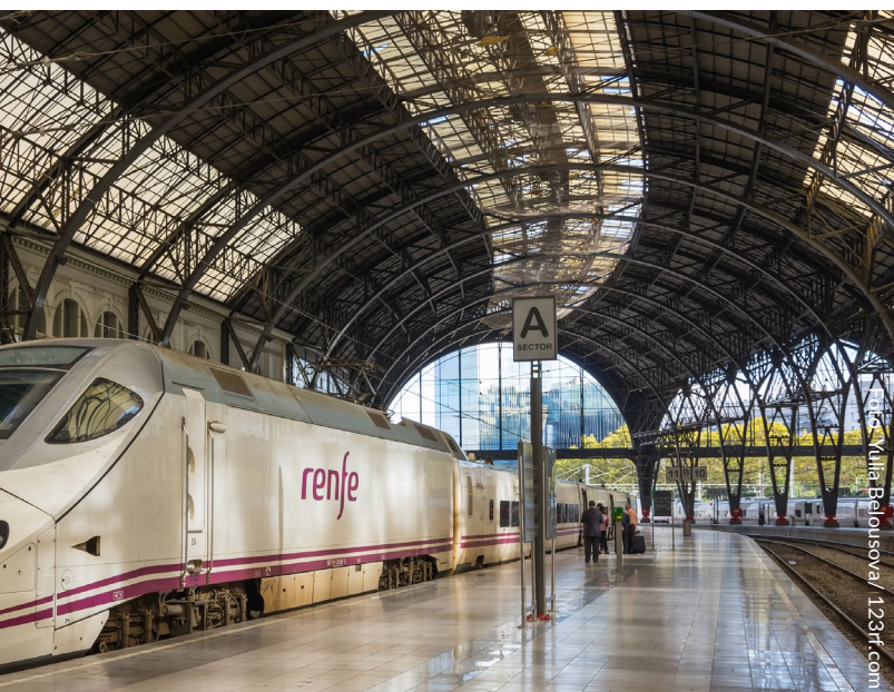
▲ ESTACIÓN DE FRANCIA BARCELONA

Ministerio de Industria y Turismo Publicado por: © Turespaña Creado por: Lionbridge NIPO: 086-18-005-8