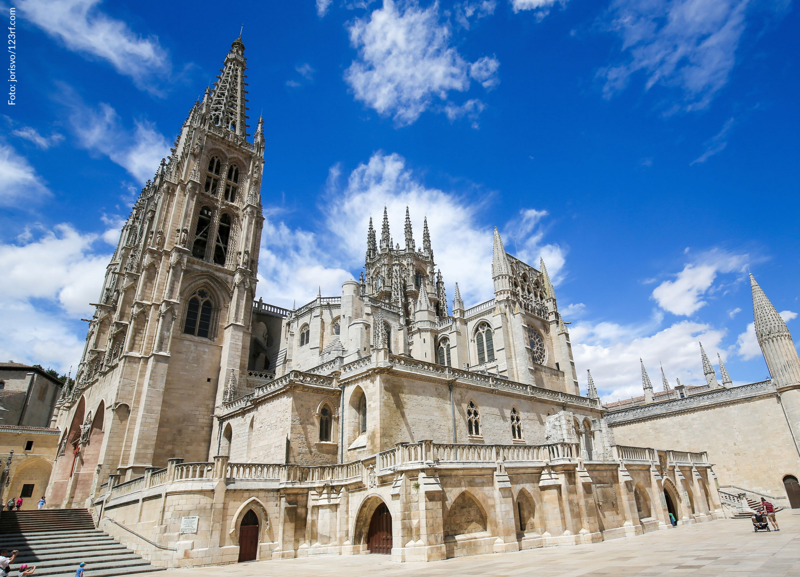
▲ CATEDRAL BURGOS