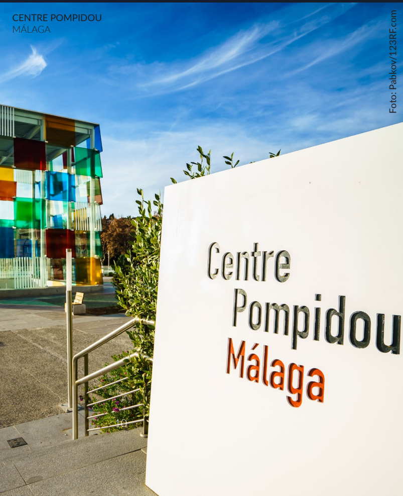
CENTRE POMPIDOU MÁLAGA

Tan solo unas dos horas y media separan Madrid de la ciudad mediterránea donde nació el genial pintor Pablo Picasso.