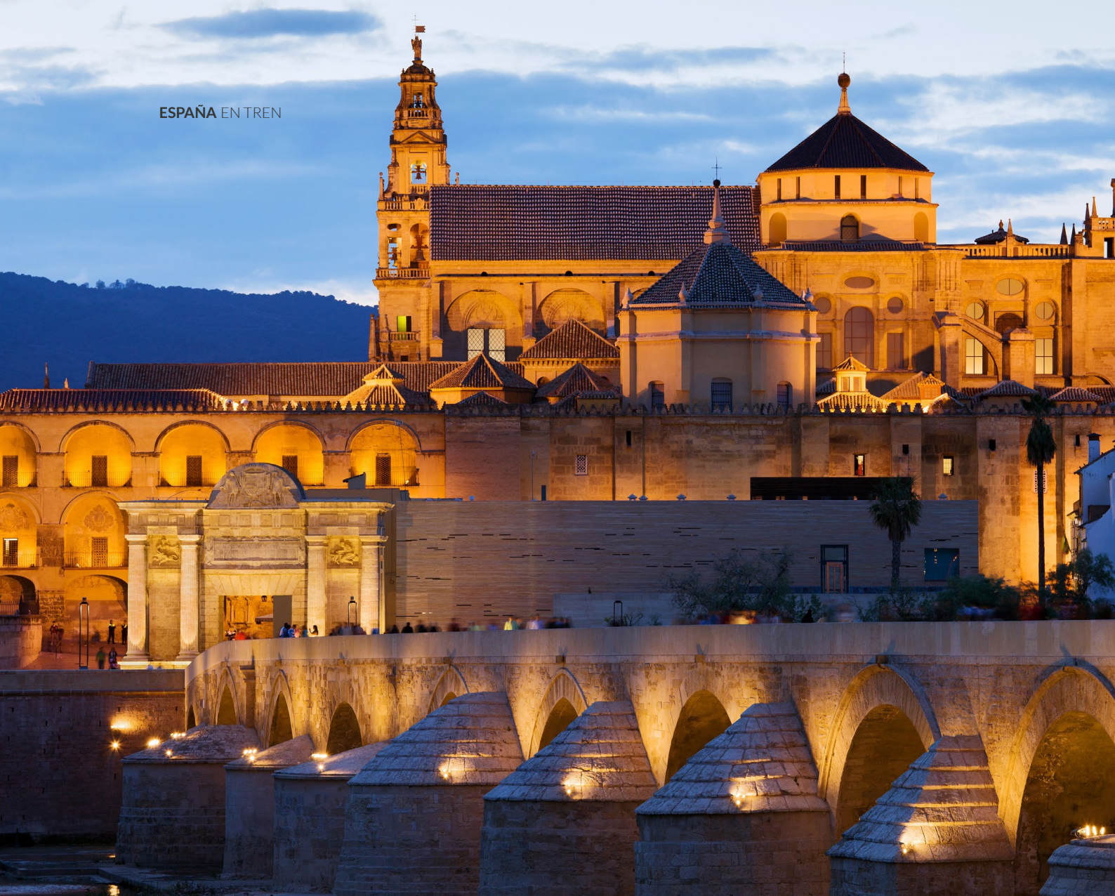
▲ MEZQUITA-CATEDRAL CÓRDOBA