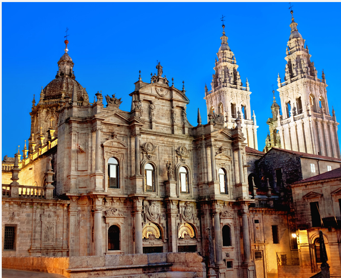
▲ CATEDRAL DE SANTIAGO SANTIAGO DE COMPOSTELA