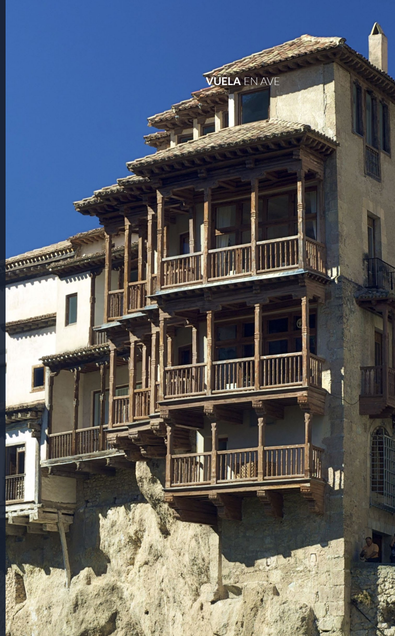
▶ CASA COLGADAS CUENCA

Castelló de la Plana y Murcia son otras ciudades a las que puedes llegar en unas tres horas desde Madrid, viajando en tren de alta velocidad.