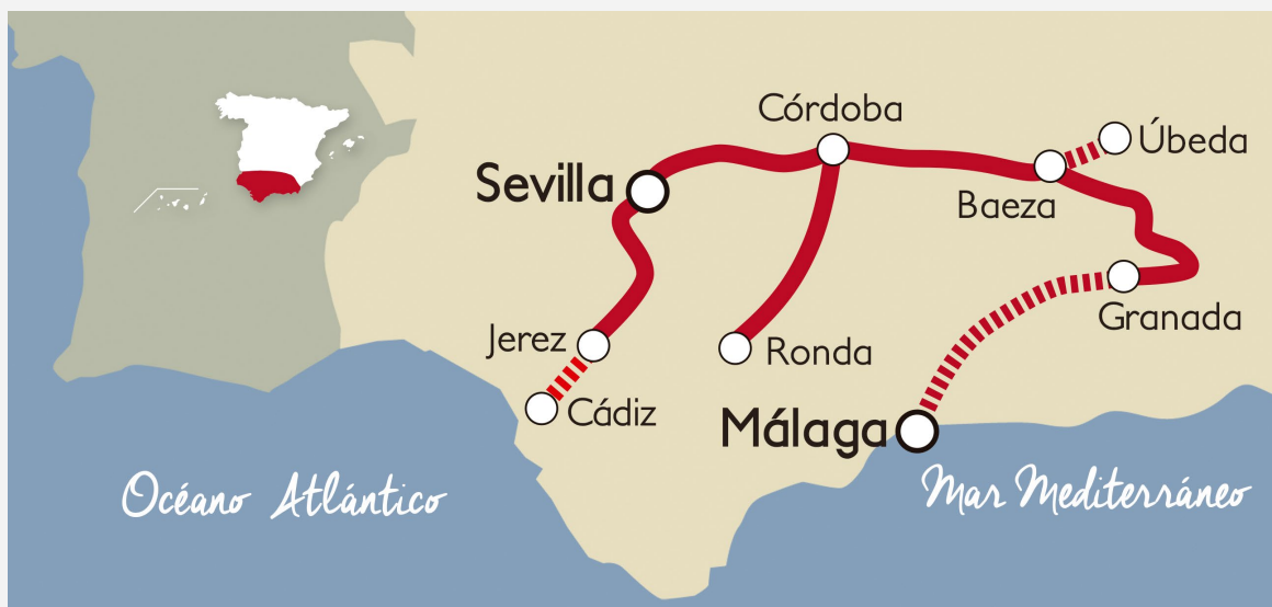
▲ ITINERARIO AL ANDALUS