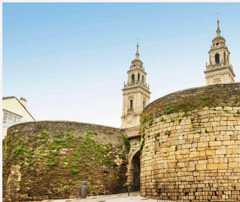
▲ CATEDRAL E MURALHA ROMANA LUGO