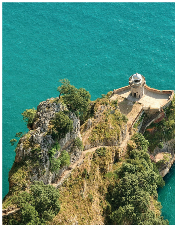
▲ FAROL DO CAVALO SANTOÑA, CANTÁBRIA

Durante estes meses, a natureza desperta depois do longo inverno. Prepara-te para uma autêntica aventura procurando o rasto dos ursos pardos e de outros animais selvagens pelos parques naturais das Astúrias . Encontra-o no meio das incríveis paisagens de Somiedo ou do parque natural de Fuentes de Narcea e vive uma experiência inesquecível.