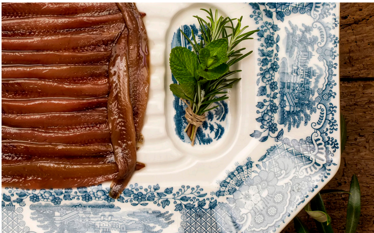
▲ ANCHOVAS DE SANTOÑA CANTÁBRIA