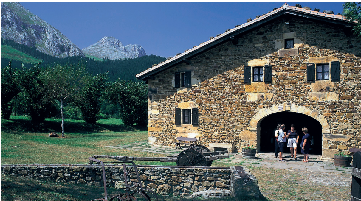
▲ RESTAURANTE EM AXPE, GUIPÚSCOA, PAÍS BASCO