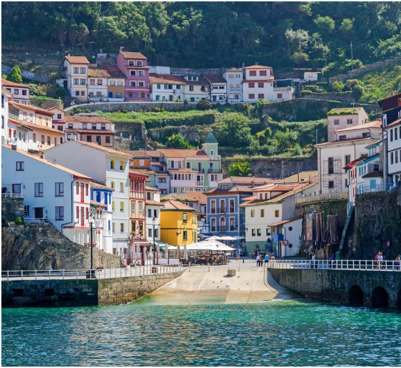
▲ CUDILLERO ASTÚRIAS