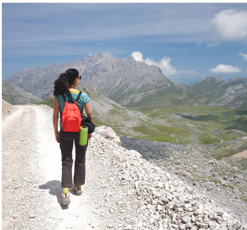
▲ PARQUE NACIONAL DOS PICOS DE EUROPA CANTÁBRIA

O parque nacional dos Picos da Europa é um paraíso de caminhos e trilhos de alta montanha para toda a família. Passeia entre os bosques dos portos de Áliva ou escala um dos picos mais conhecidos de Espanha, o Naranjo de Bulnes , nas Astúrias. Poderás percorrer a garganta da impressionante rota de Cares , ou admirar as vistas desde o miradouro de Ordiales (Astúrias). Dorme num dos seus refúgios de montanha e deixa-te surpreender por um céu cheio de estrelas.