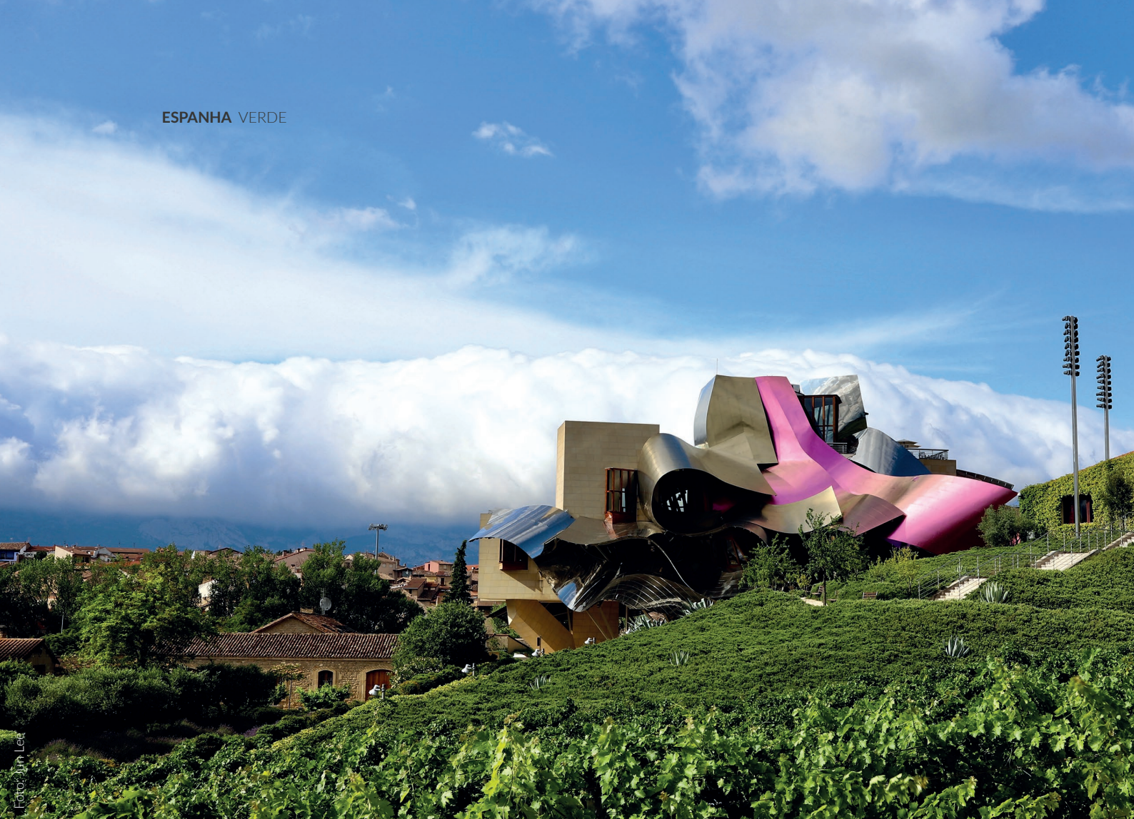
▲ ADEGAS MARQUÉS DE RISCAL ELCIEGO, ÁLAVA