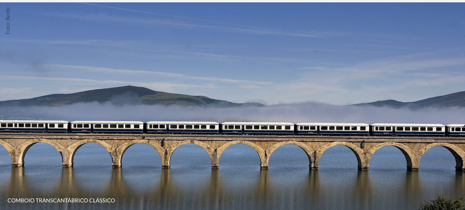
COMBOIO TRANSCANTÁBRICO CLÁSSICO