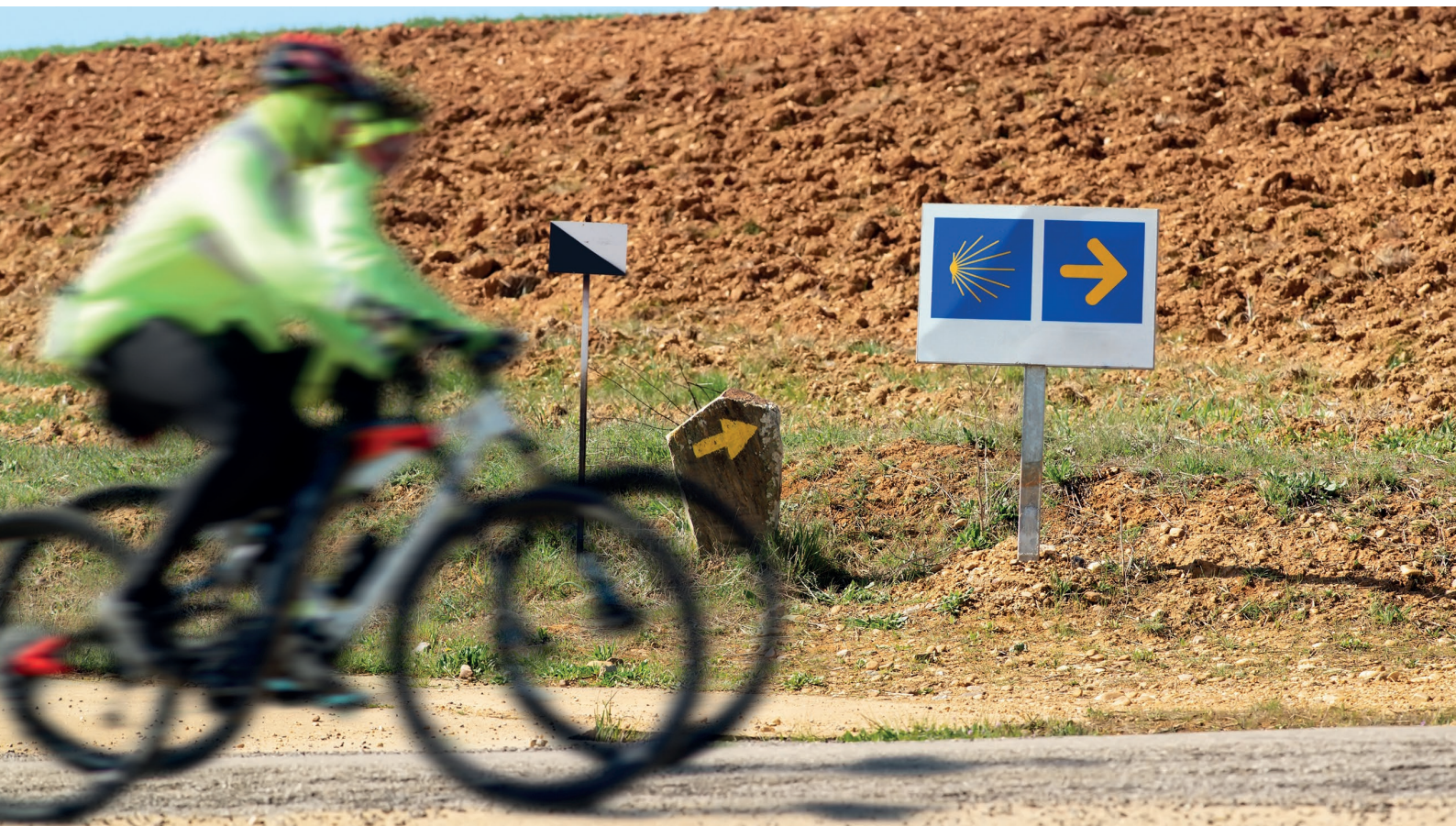
▲ CAMINHO DE SANTIAGO EM BICICLETA

Apé, de bicicleta ou de comboio, deixa atrás a tua vida quotidiana e percorre o norte de Espanha de uma ponta a outra pelos seus caminhos históricos. Uma viagem que mudou a vida de muitas pessoas e na qual vais viver muitas experiências que recordarás para sempre.