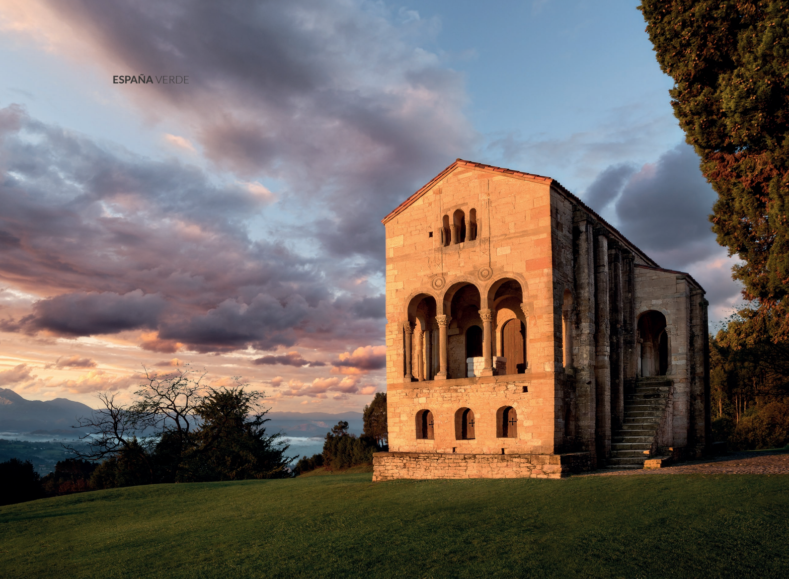
▲ SANTA MARÍA DEL NARANCO OVIEDO