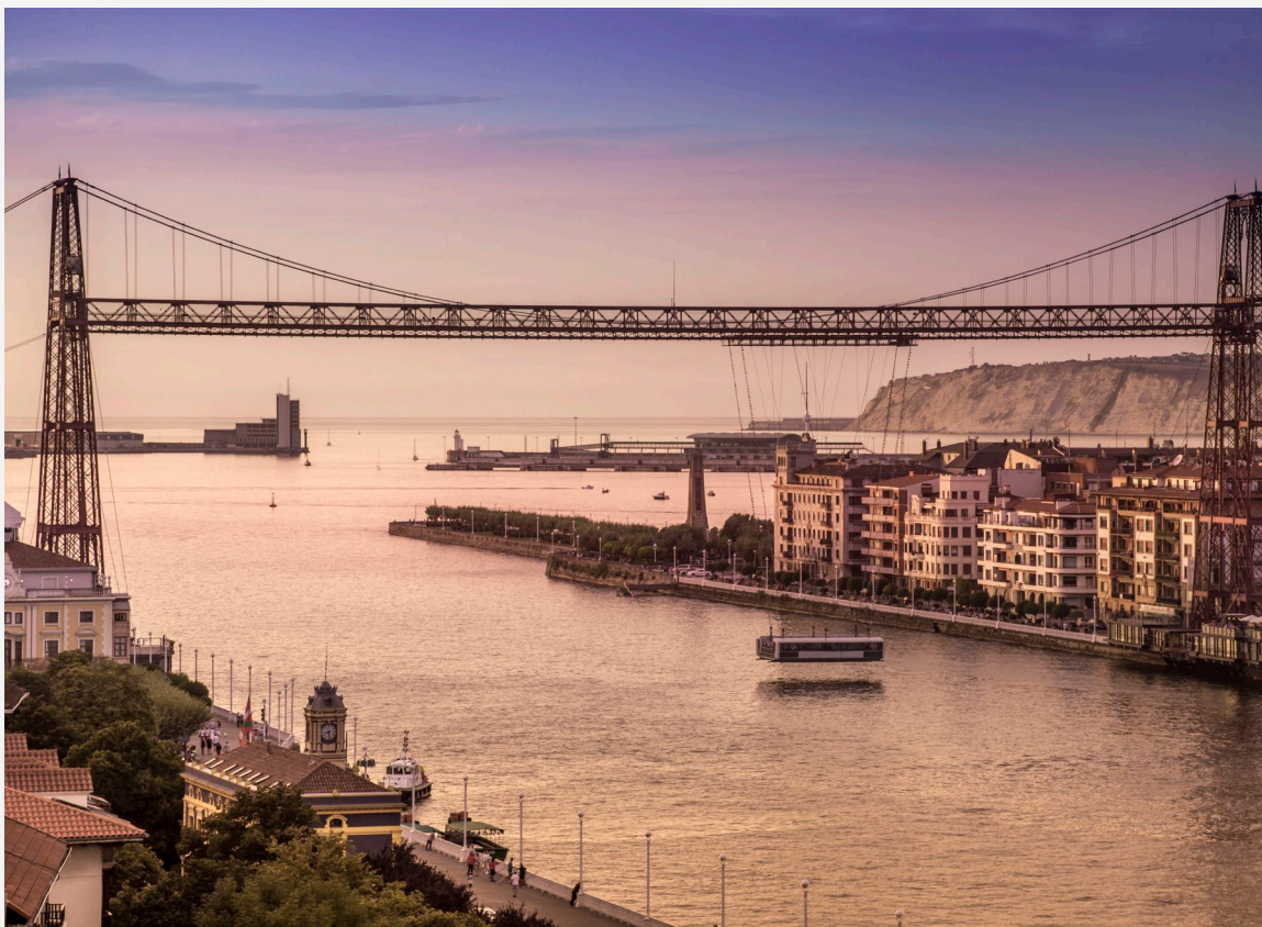
▲ PUENTE BIZKAIA GETXO, VIZCAYA

Después, pasea en bicicleta al lado de la ría hasta el caso viejo, donde puedes reponer fuerzas en alguno de los restaurantes y bares de sus animadas Siete Calles . Continúa tu camino y cruzarás por la ría del Nervión por el Puente Bizkaia , declarado Patrimonio Mundial; fue el primer puente transbordador de estructura metálica construido en el mundo.