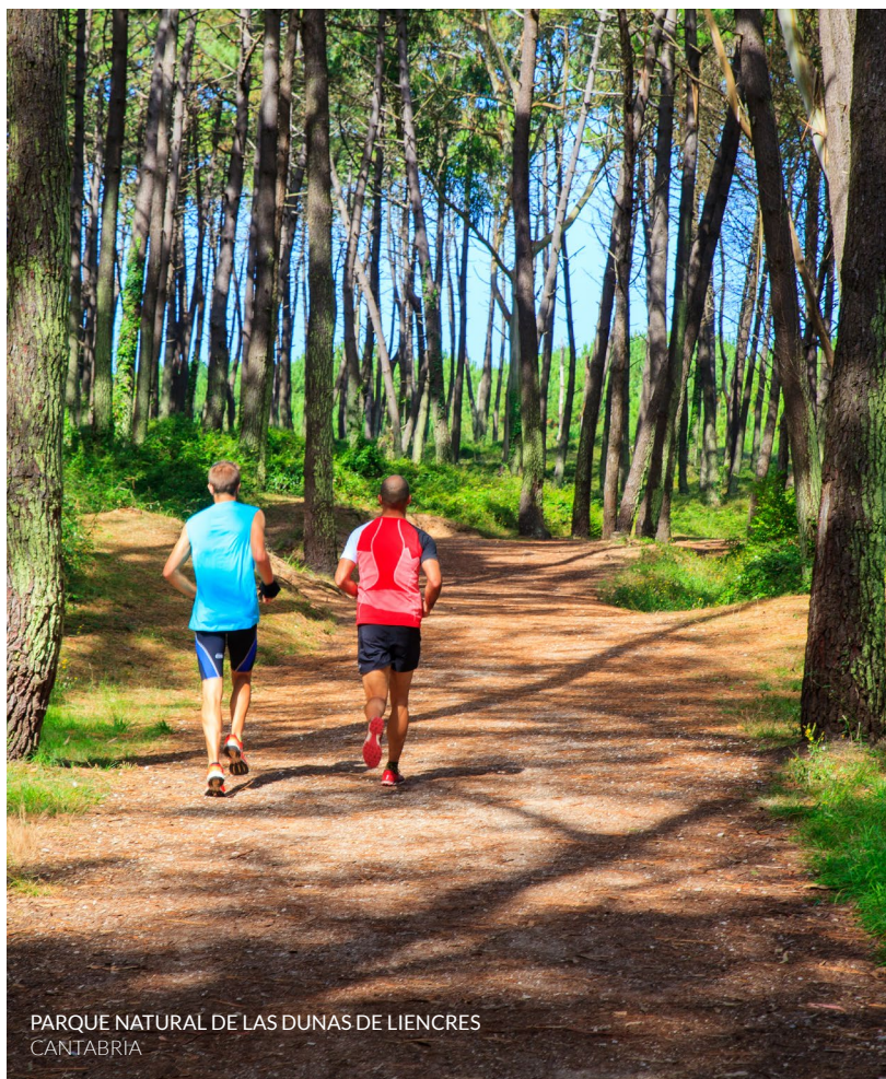
PARQUE NATURAL DE LAS DUNAS DE LIENCRES CANTABRIA

Pero aún hay más posibilidades. En Galicia , asómate a los acantilados más altos de Europa en la sierra de A Capelada . Recorre la ruta del Flysh , con sus acantilados imponentes, en el Geoparque de la Costa Vasca . Aquí se encuentra la ermita de San Juan de Gaztelugatxe , uno de los escenarios más reconocibles de la serie televisiva Juego de Tronos . También en el País Vasco conoce la Reserva de la Biosfera de Urdabai , con unas espectaculares marismas llenas de vida.