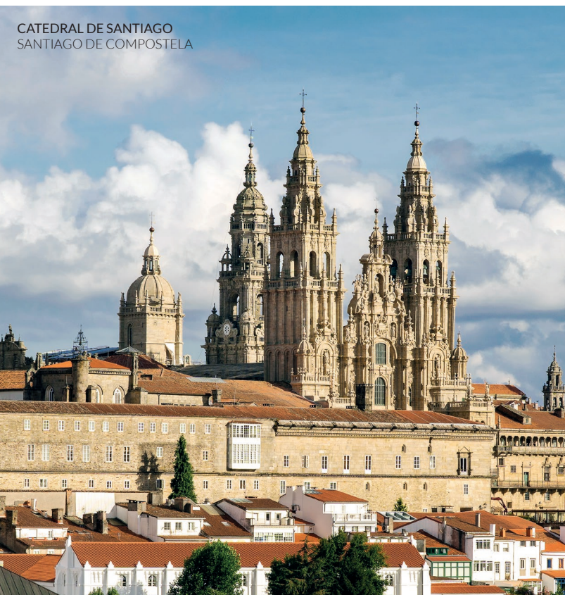
CATEDRAL DE SANTIAGO SANTIAGO DE COMPOSTELA

En esta ruta tampoco te pierdas la Catedral de Mondoñedo . Camina por senderos medievales y por las pequeñas aldeas de Sobrado dos Monxes y su famoso monasterio, o por tesoros de la naturaleza, como la laguna de Sobrado . Duerme en el mayor albergue de Galicia en el monte do Gozo . Ya puedes ver las torres de la Catedral de Santiago de Compostela . ¡Por fin has alcanzado tu meta!