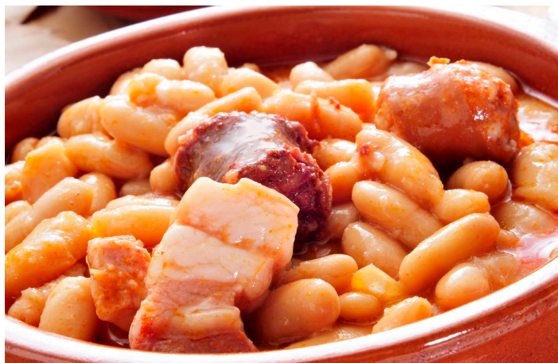
▲ FABADA ASTURIANA

Acompaña la carne con los intensos vinos tintos de Rioja Alavesa y el marisco con