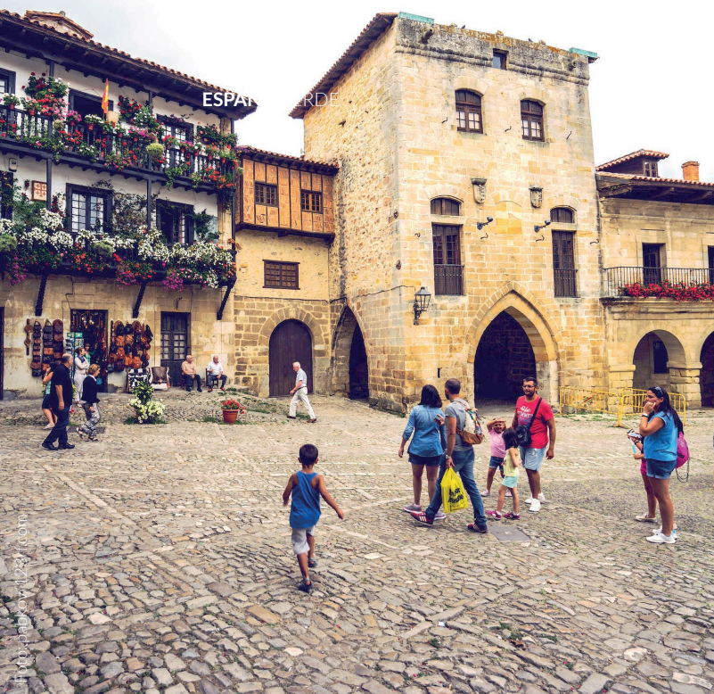
▲ SANTILLANA DEL MAR CANTABRIA