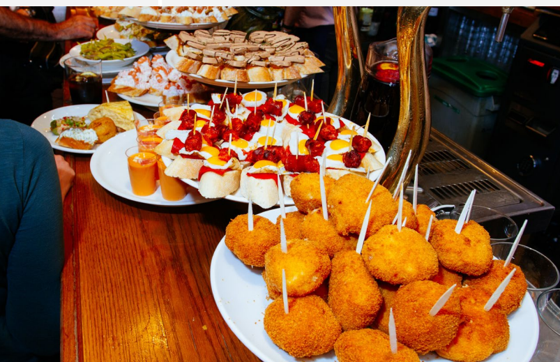
▲ PINTXOS SAN SEBASTIÁN

Prepárate para recorrer las ciudades de la España Verde: lugares rodeados de naturaleza, llenos de espectaculares monumentos y con una animada vida cultural.