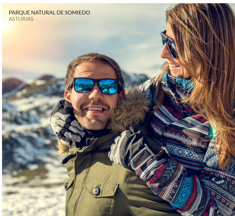
PARQUE NATURAL DE SOMIEDO ASTURIAS