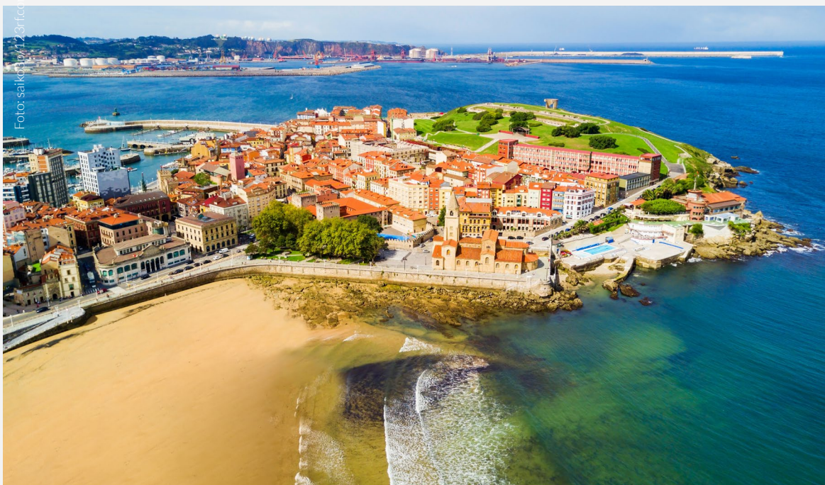
▲ PLAYA DE SAN LORENZO GIJÓN

Si te gusta la historia y la arquitectura, los palacios de Oviedo van a deslumbrarte. Desde el propio Palacio Velarde , donde se ubica el mencionado museo, hasta el Palacio de Camposagrado , una imponente mansión del siglo XVIII o el Palacio del Conde de Toreno , una joya del barroco.