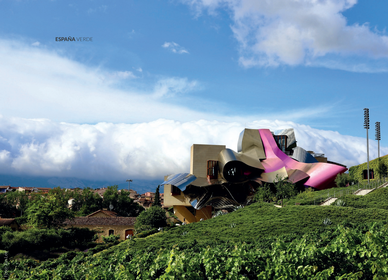
▲ BODEGAS MARQUÉS DE RISCAL ELCIEGO, ÁLAVA