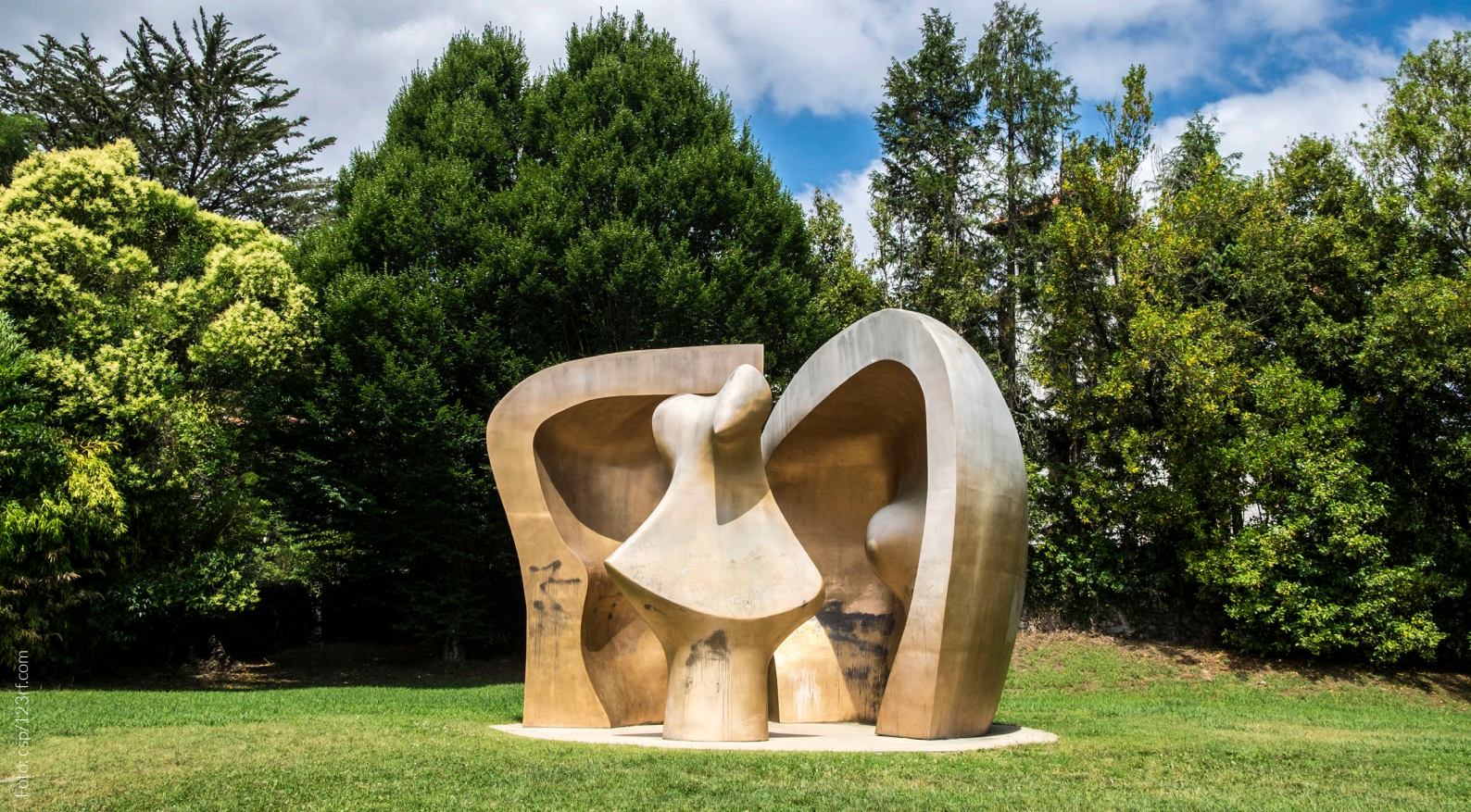
▲ PARQUE DE LOS PUEBLOS DE EUROPA GERNIKA, BIZKAIA

rincones del planeta. También pasa por Getaria , donde podrás visitar el Museo Balenciaga, localidad en la que nació el famoso diseñador de moda, y por Gernika , un símbolo para los vascos. Esta localidad fue bombardeada por la aviación alemana enviada por Hitler durante la Guerra Civil, hecho que inspiró el icónico cuadro de Pablo Picasso que lleva el nombre de la villa. La ruta también recorre zonas menos conocidas y valles solitarios, salpicados de caseríos, donde comprobarás in situ la amabilidad de la gente.