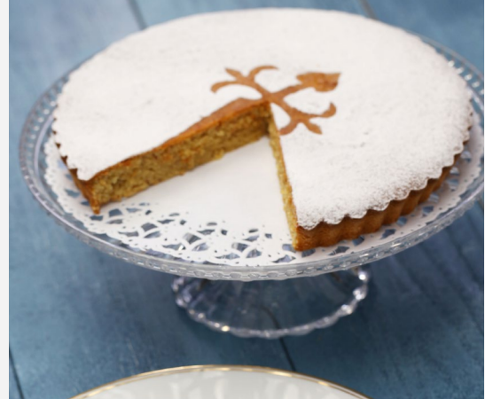
TARTA DE SANTIAGO DE COMPOSTELA

Vive Santiago como lo hacen sus vecinos, comprando en el mercado de Abastos . Encontrarás varios locales de cocina de mercado para probar las mejores verduras frescas, quesos y mariscos gallegos.