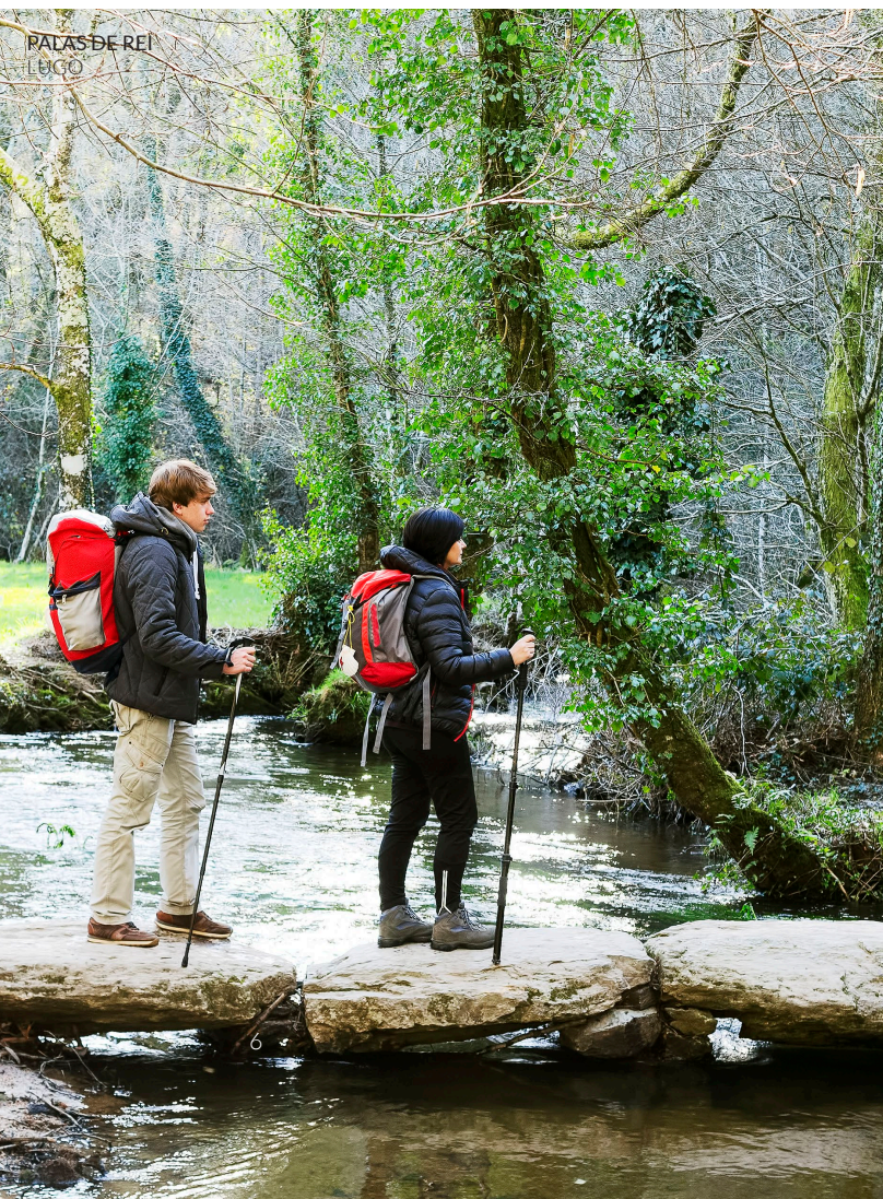
PALAS DE REI LUGO

Este es el más antiguo de todos los caminos a Santiago. Sigue una senda que dejaron los peregrinos desde el siglo IX a través del interior oeste de Asturias. Parte desde Oviedo , la capital del Principado de Asturias . Una animada ciudad que cuenta con un gran tesoro patrimonial. Cruzando el corazón de Asturias te sentirás parte de la naturaleza mientras te acompañan ríos caudalosos, escarpadas gargantas, cascadas y robledales milenarios. A tu paso hallarás localidades como Salas , declarada Conjunto Histórico. Después pasarás por los concejos de Allande y Grandas de Salime , donde te sobrecogerá el paisaje protegido de las sieras de Carondio y Valledor . Ya cerca de Galicia, tendrás unas bonitas vistas del embalse de Salime . Antes de unirse al Camino Francés, en Palas de Rei (Lugo), coronarás el bello Alto del Acebo , a más de 1100 metros sobre el nivel del mar y conocerás la imponente ciudad de Lugo y su Muralla romana declarada Patrimonio Mundial. A lo largo del recorrido podrás descubrir bellos pueblos gallegos como Melide o Arzúa .