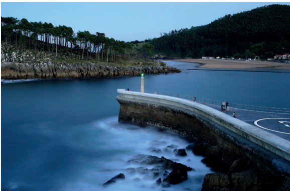
▲ LEKEITIO BIZKAIA