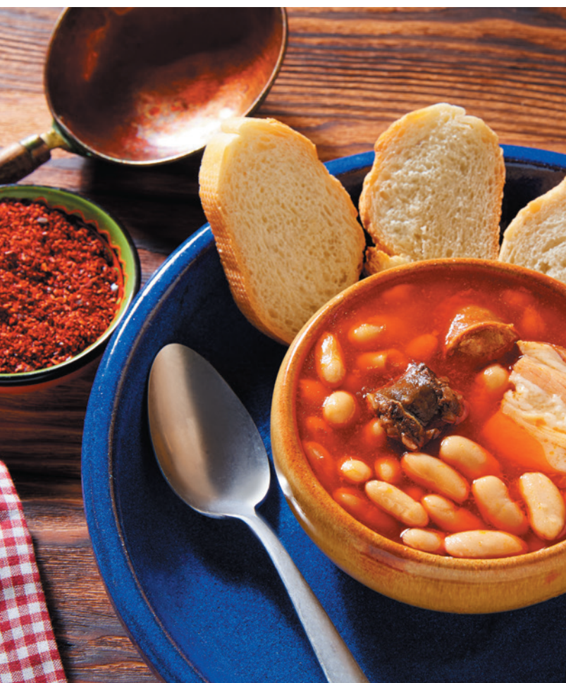
▲ FABADA ASTURIANA