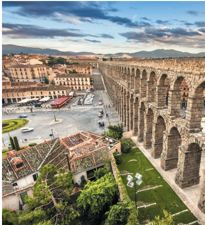
▲ AKWEDUKT W SEGOWII