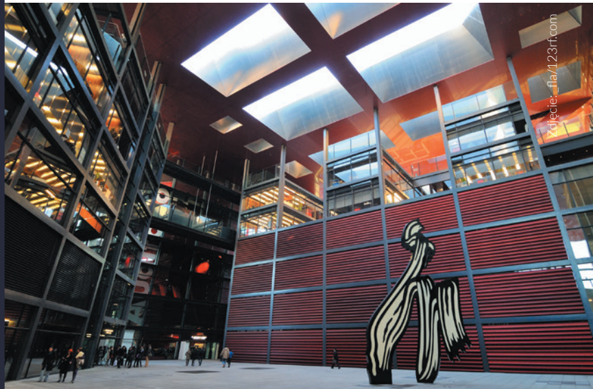
▲ CENTRUM SZTUKI MUZEUM NARODOWE KRÓLOWEJ ZOFII MADRYT

W Hiszpanii znajduje się ponad 1500 muzeów z jednymi z najlepszych kolekcji dzieł sztuki na świecie. Muzea wymienione poniżej to te najbardziej znane, ale jest ich oczywiście znacznie więcej. Prawie w każdym odwiedzanym mieście i miasteczku znajdziesz małe perełki muzealne, które warto odwiedzić.