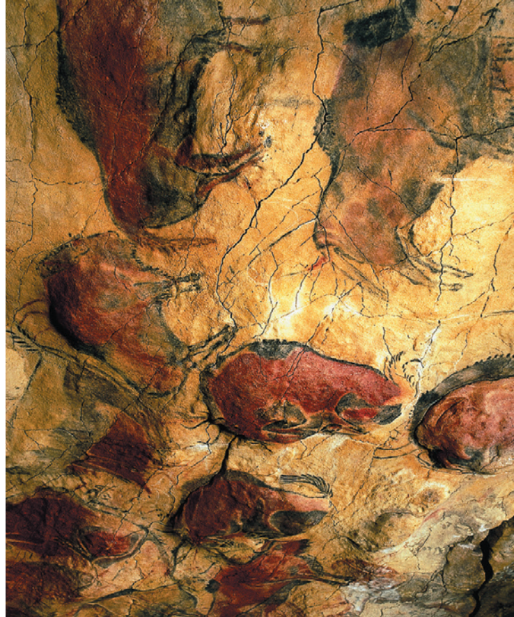
REPLIKA JASKINI – MUZEUM NARODOWE I CENTRUM BADAWCZE ALTAMIRA