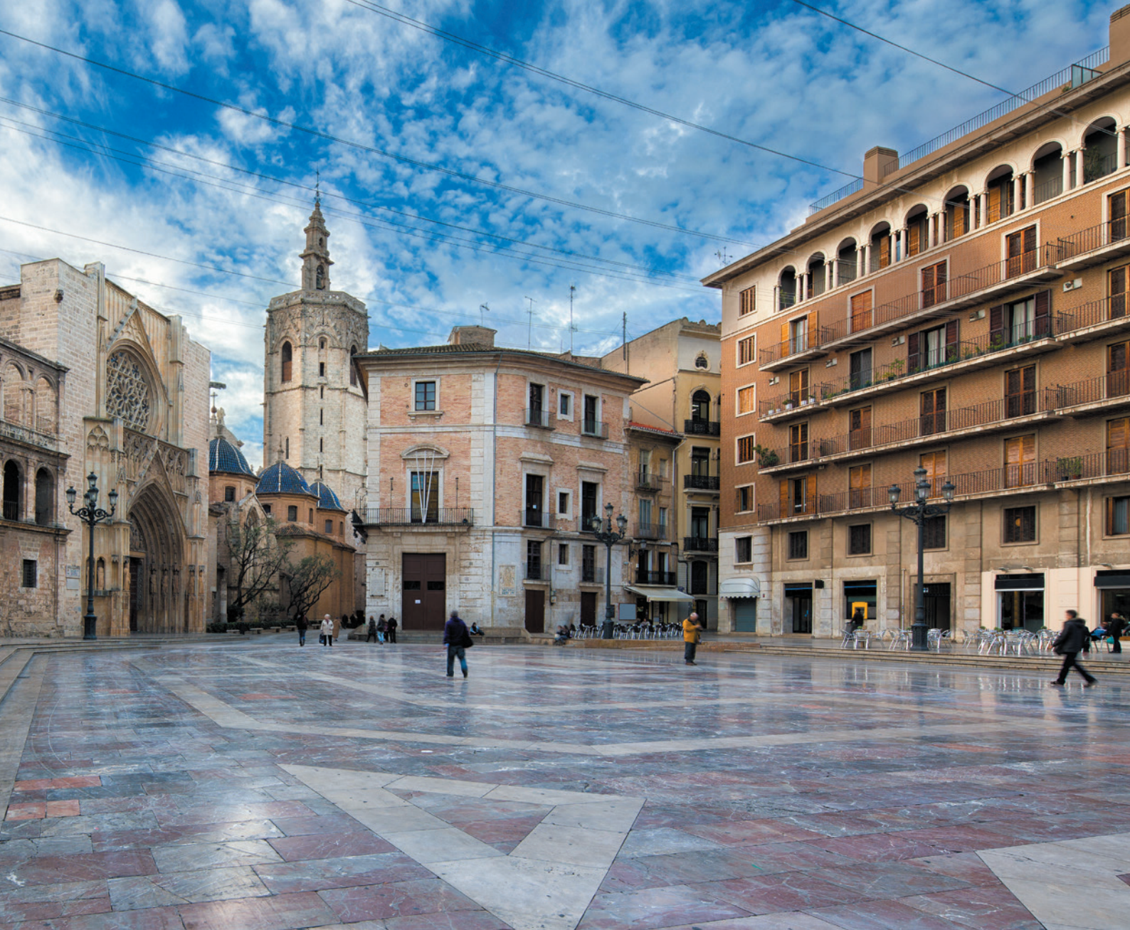
▲ STARE MIASTO WALENCJA

wszechniania nauki i kultury w Europie: Miasto Sztuki i Nauki . Tworzy go sześć imponujących budynków, w których prowadzona jest działalność związana z nauką, sztuką, przyrodą i technologią.