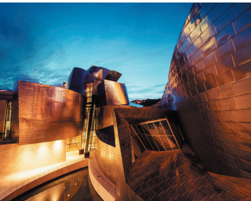
▲ MUZEUM GUGGENHEIMA W BILBAO