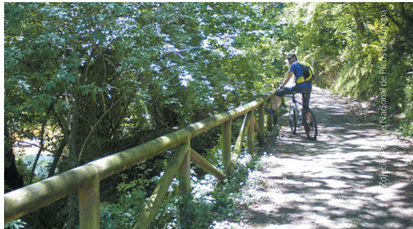
▲ ZIELONY SZLAK SENDA DEL OSO ASTURIA

Rozbudowana sieć szlaków pozwala odwiedzić spektakularne jeziora wysokogórskie i wejść do rozległych lasów świerkowych i sosnowych. To wyjątkowa enklawa pełna cudów takich jak najwyż-