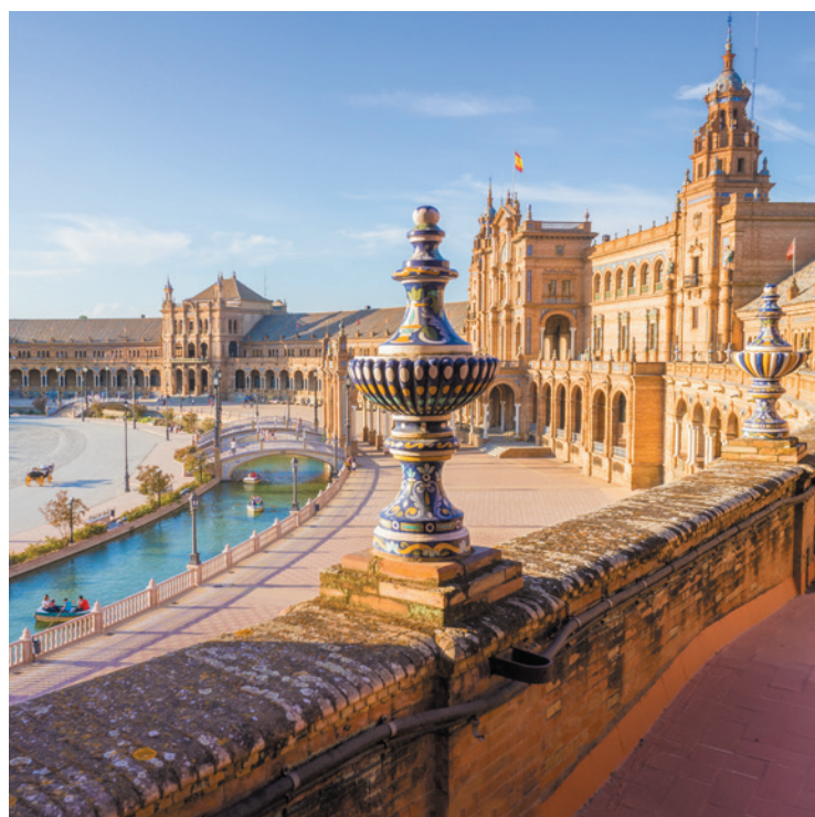
▼ PLAZA DE ESPAÑA SEWILLA