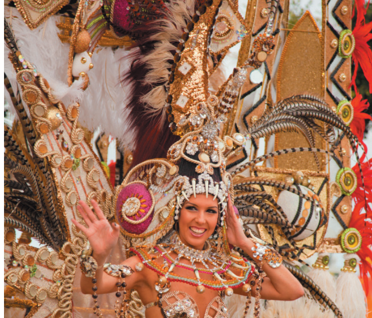
▲ KARNWAŁ NA TENERYFIE

Duch religijnej żarliwości Wielkiego Tygodnia kontrastuje z radosną atmosferą karnawału , który obchodzony jest przed Wielkim Postem. Dominuje wtedy kolor, fantazja, beztroska, humor i swoboda ekspresji, a parady poruszają się w rytm muzyki. Oprócz znanego na całym świecie karnawału w Santa Cruz de Tenerife (Wyspy Kanaryjskie), szczególnie radosne są andaluzyjskie karnawały w Kadyksie i Águilas (Murcia).