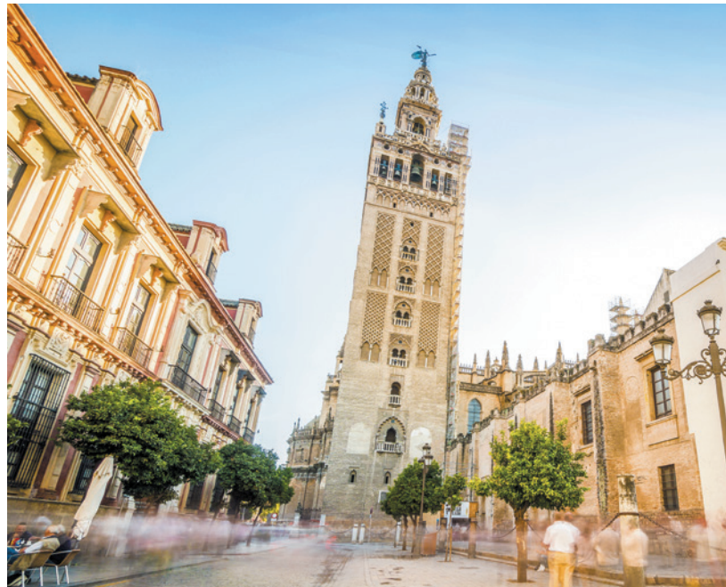
▲ LA GIRALDA SEWILLA