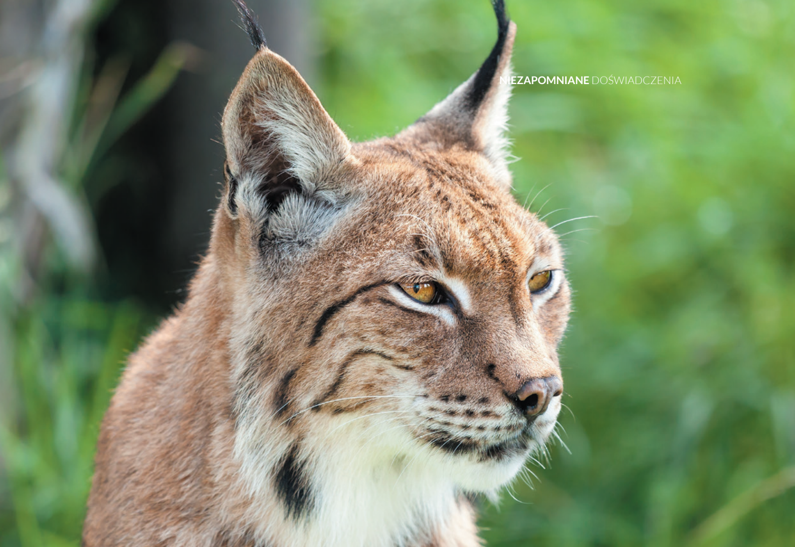
▲ RYŚ IBERYJSKI PARK DOÑANA