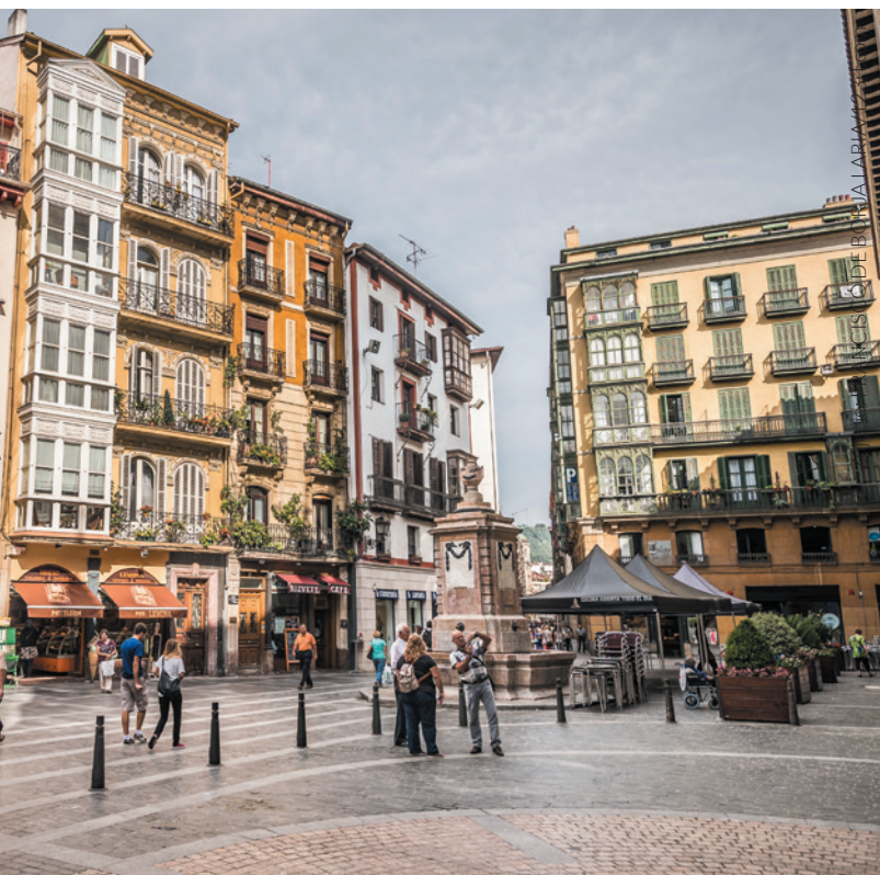
▲ STARE MIASTO BILBAO