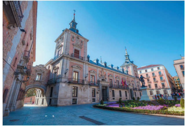
▲ PLAZA DE LA VILLA MADRYT

Przejdź się po Madrycie Burbonów , enklawie takich reprezentacyjnych miejsc jak Puerta del Sol, Plaza Mayor czy Palacio Real (Pałac Królewski). Aby się