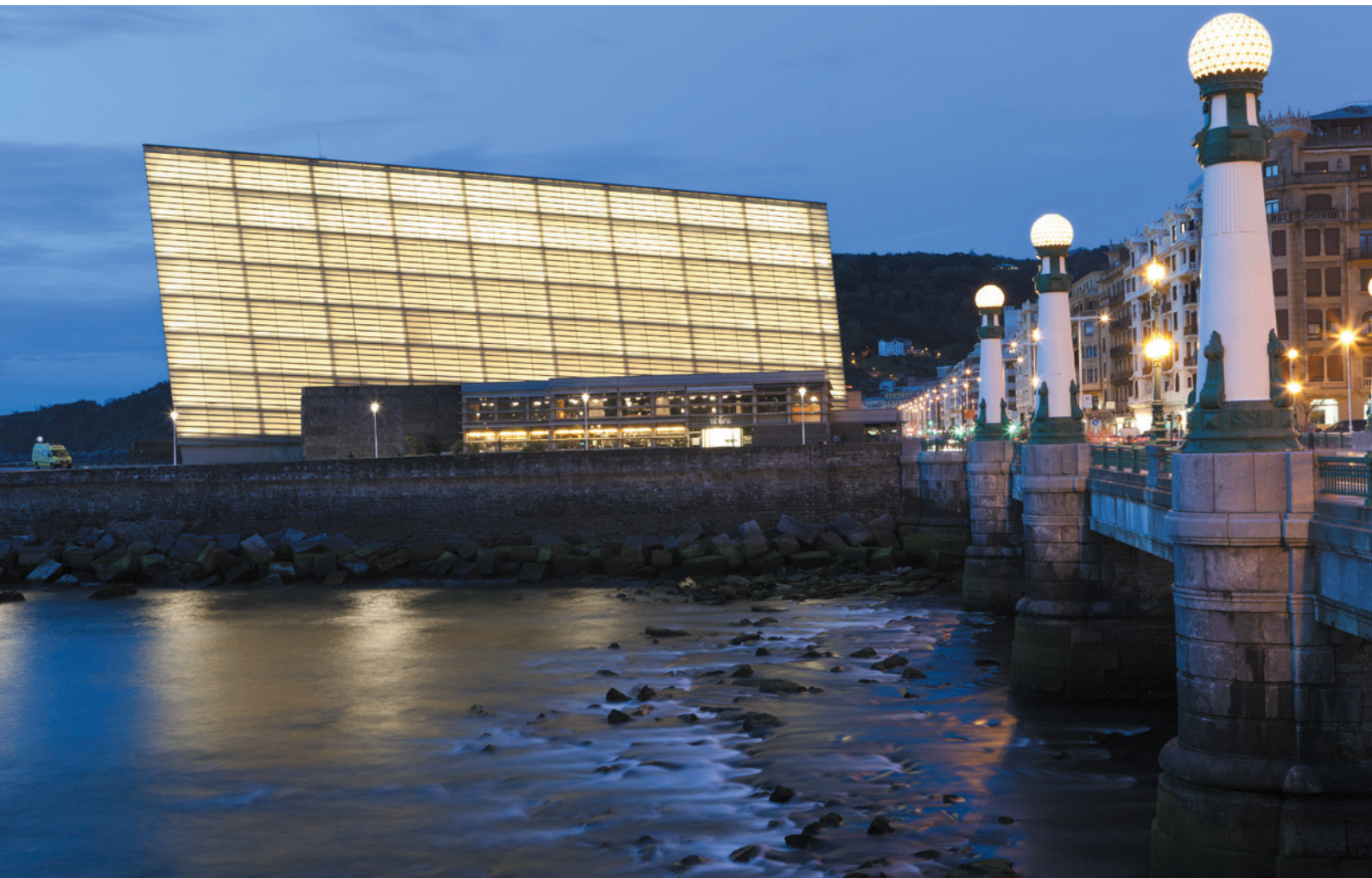
▲ PAŁAC KONGRESOWY I AUDYTORIUM KURSAAL SAN SEBASTIÁN

walu służą też inne historyczne miejsca w mieście, takie jak Antigua Universidad Renacentista czy Patio de Fúcares. Obchodzony jest w lipcu i co roku przyciąga ponad 60 000 osób.