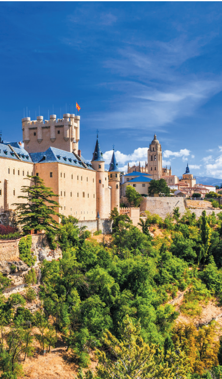
▲ ALKAZAR W SEGOWII