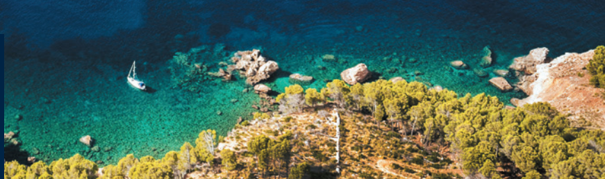
▲ WYSPY KANARYJSKIE

Plaże ze znakiem jakości Q , synonim doskonałej czystości wody i piasku, są coraz liczniejsze na hiszpańskich wybrzeżach.