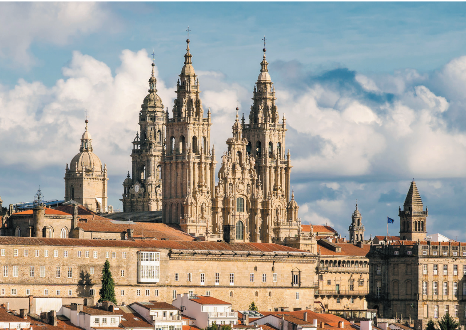
▲ KATEDRA W SANTIAGO SANTIAGO DE COMPOSTELA