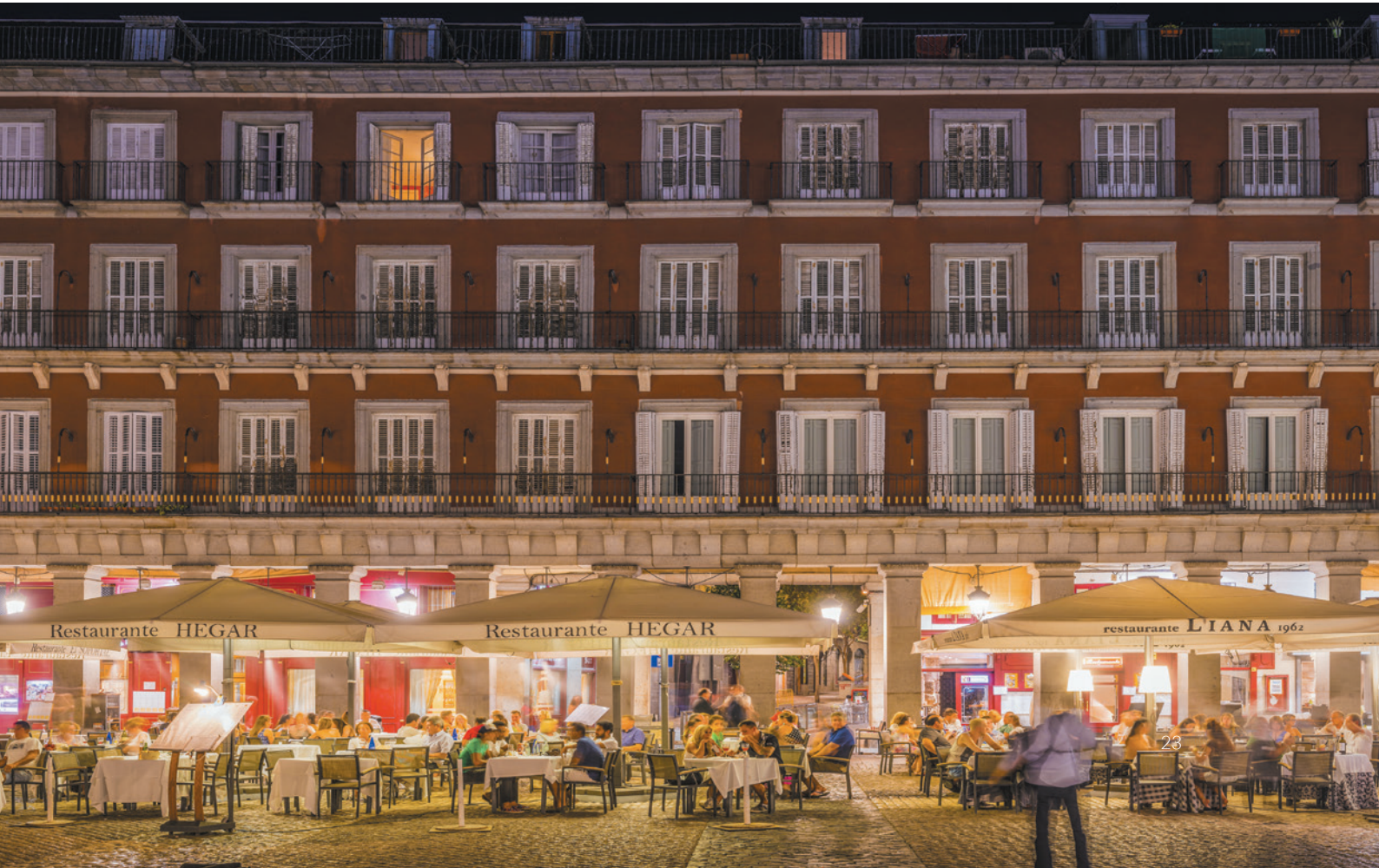
▼ PLAZA MAYOR MADRYT