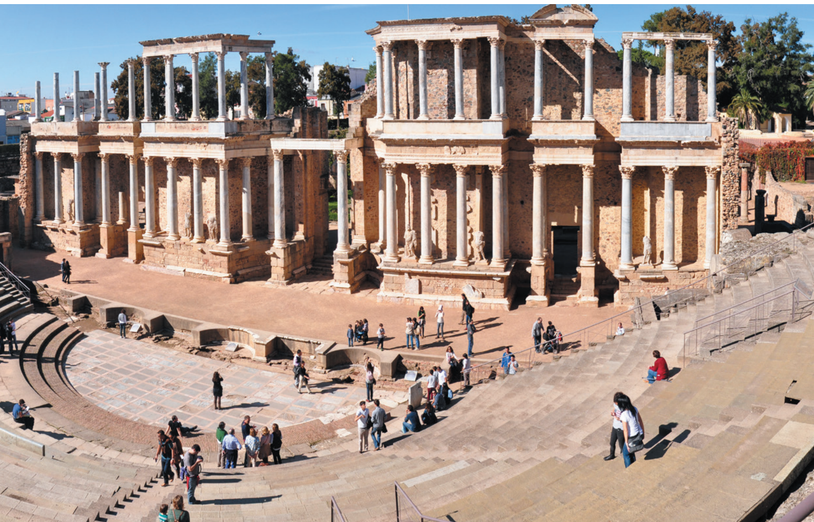
▲ RZYMSKI TEATR W MERIDZIE