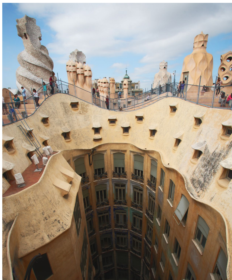
▼ LA PEDRERA-CASA MILÀ BARCELONE

Parmi les autres sites à découvrir en suivant les pas des protagonistes de ce film, direction le parc d'attractions du Tibidabo avec sa vue imprenable sur la ville, où ont également été tournées des scènes de The Machinist , avec Christian Bale ; l'effervescence et les traditionnels stands de fleurs de La Rambla, ou la charmante place San Felipe Neri . En plus de Barcelone, le long métrage de Woody Allen a également été tourné à Oviedo et Avilés (Asturies), deux villes dont le génie de New York se déclare un fidèle admirateur.