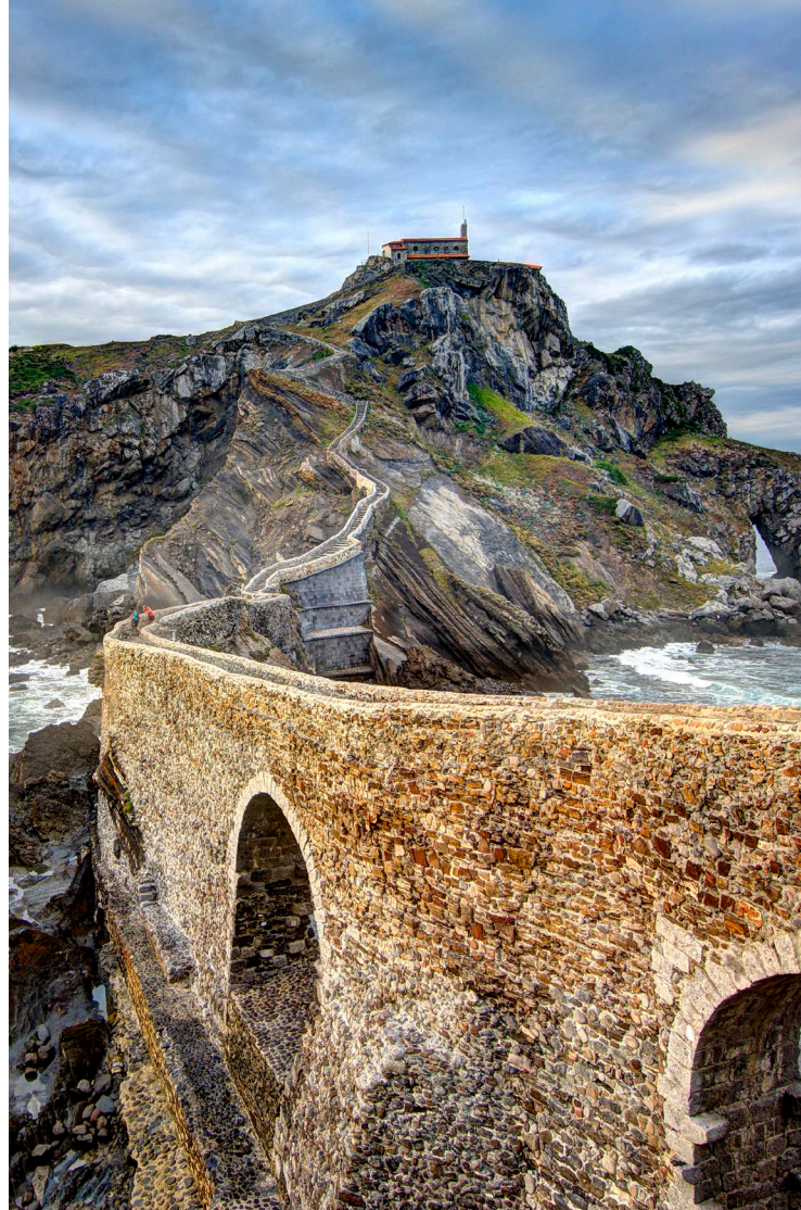
▲ ERMITAGE DE SAN JUAN GAZTELUGATXE BISCAYE

En plus de servir de cadre à Westeros, la variété des paysages et des environnements