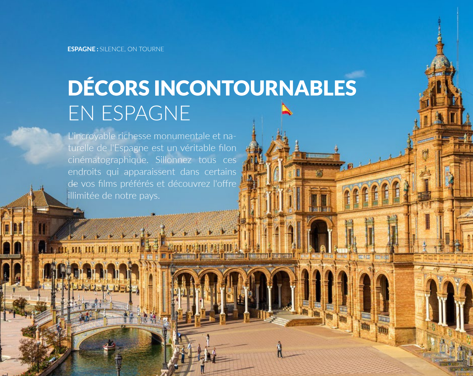
▲ PLAZA DE ESPAÑA SÉVILLE

L'incroyable richesse monumentale et naturelle de l'Espagne est un véritable filon cinématographique. Sillonnez tous ces endroits qui apparaissent dans certains de vos films préférés et découvrez l'offre illimitée de notre pays.