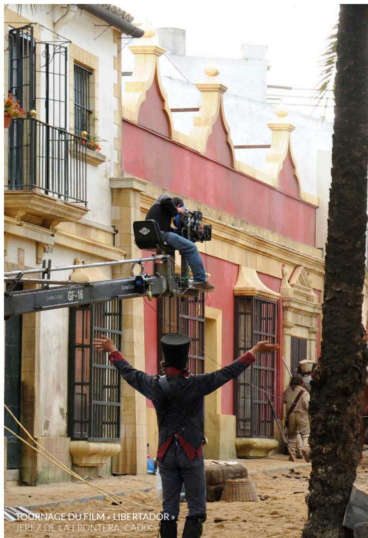
TOURNAGE DU FILM « LIBERTADOR » JEREZ DE LA FRONTERA, CADIX

Dans le film, on les voit se promener dans la rue Ancha , le centre névralgique de la ville. Elle est reconnaissable entre toutes grâce à ses palais seigneuriaux comme la Casa de los Cinco Gremios , à ses églises comme celle de la Conversión de San Pablo et aux balcons de ses édifices.