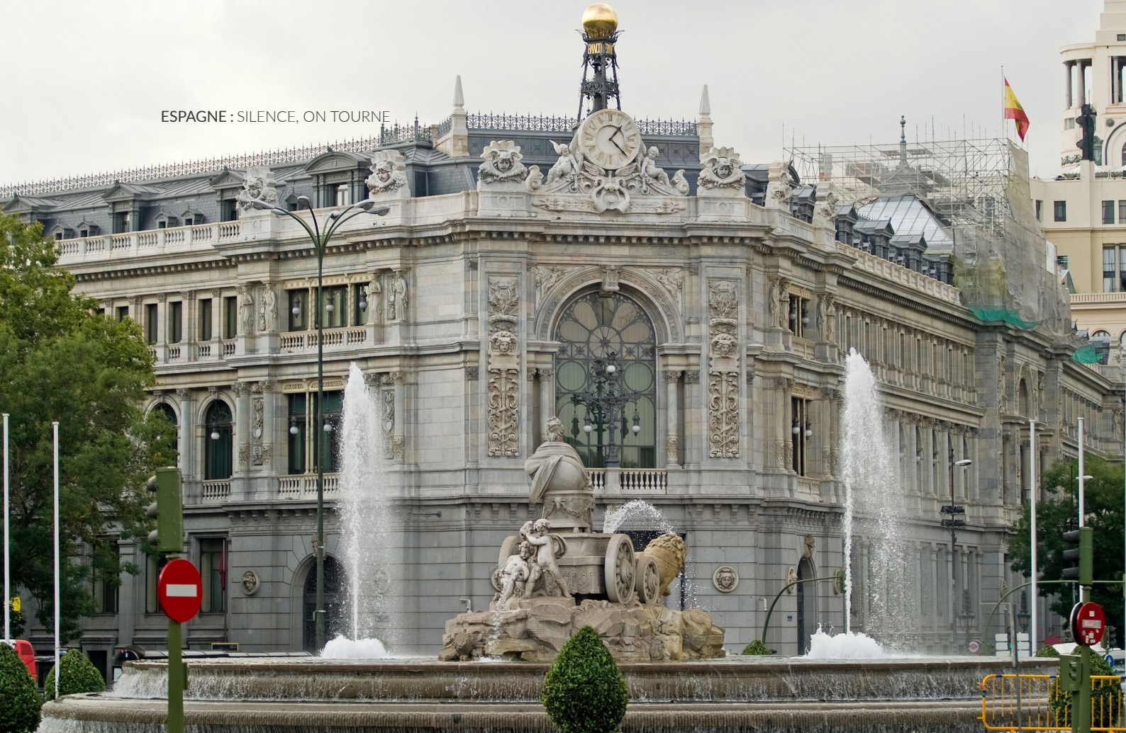
▲ BANCO DE ESPAÑA MADRID

Le Madrid des Habsbourg a également souvent servi de décor à ses personnages. Ce quartier rassemble le plus de monuments de la ville, notamment la Plaza Mayor , le point de départ idéal pour une visite sur les pas d'Almodóvar ou pour sortir danser comme les personnages de La Fleur de mon secret .