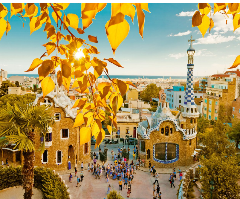
▲ PARC GÜELL BARCELONE