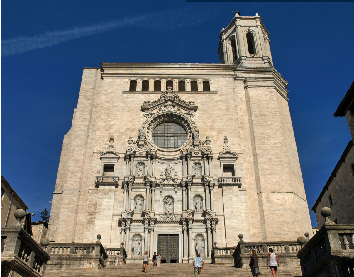
CATHÉDRALE SANTA MARÍA DE GÉRONE

Les rues pavées de la vieille ville de Gérone ont accueilli Arya perdue à Braavos, et les impressionnants escaliers de sa cathédrale ont servi à restituer le Grand Septuaire de Baelor à King's Landing. Vous ne pourrez pas les monter à cheval, comme Jaime Lannister, mais leurs dimensions imposantes ne manqueront pas de vous émerveiller.