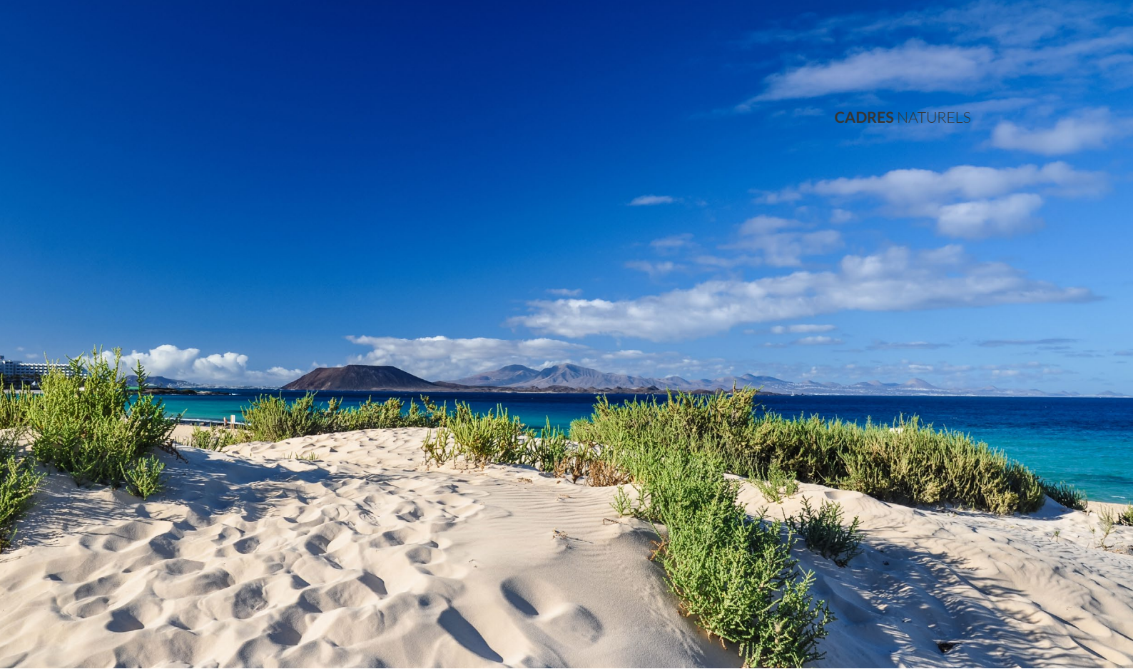
▲ FALAISE DE LOS GIGANTES TENERIFE

Pour sa part, Le Choc des Titans , de Louis Leterrier, permet de voir le Teide en action, ce volcan inactif qui se dresse, imposant, au centre de l'île de Tenerife, le sommet le plus haut de toute l'Espagne. Le parc national du Teide a servi de réplique à l'infra-monde mythologique où se déroule une partie importante du film.