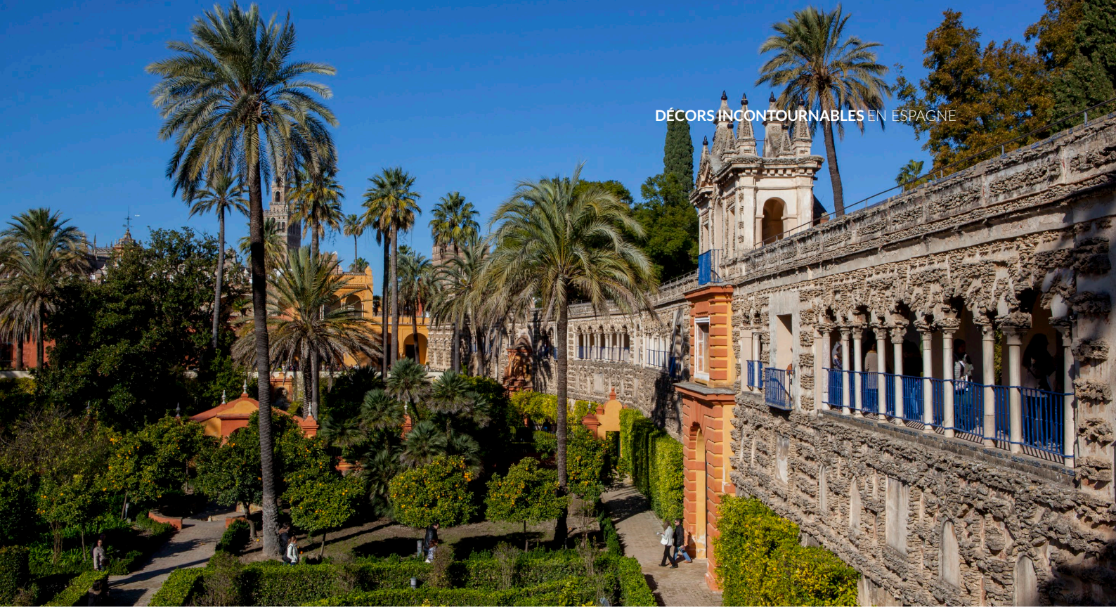
▲ JARDIN DE L'ÉTANG DE MERCURE ALCAZAR, SÉVILLE

La Casa de Pilatos est un autre des lieux qui ont captivé Ridley Scott, au point de choisir ce palais de style Renaissance italiano-mudéjar pour mettre en scène la résidence du préteur romain à Jérusalem. Visitez-le et explorez ses jardins d'une grande beauté, typiques des petits palais nobles du centre de la ville avec ses superbes azulejos et ses grilles plateresques. Mais ce n'était pas la première fois que le réalisateur succombait au charme de Séville. Dans 1492 : Christophe Colomb , un long métrage sur la découverte de l'Amérique, il avait déjà eu recours à ces deux localisations. Dans l'alcazar, le palais du Rey Don Pedro était la résidence de la reine Isabelle la Catholique (Sigourney Weaver) qui y recevait la visite de Christophe Colomb (Gérard Depardieu). Il s'agissait là d'un moment clé de l'histoire, à savoir l'origine des négociations au cours desquelles Christophe Colomb demandait à la reine