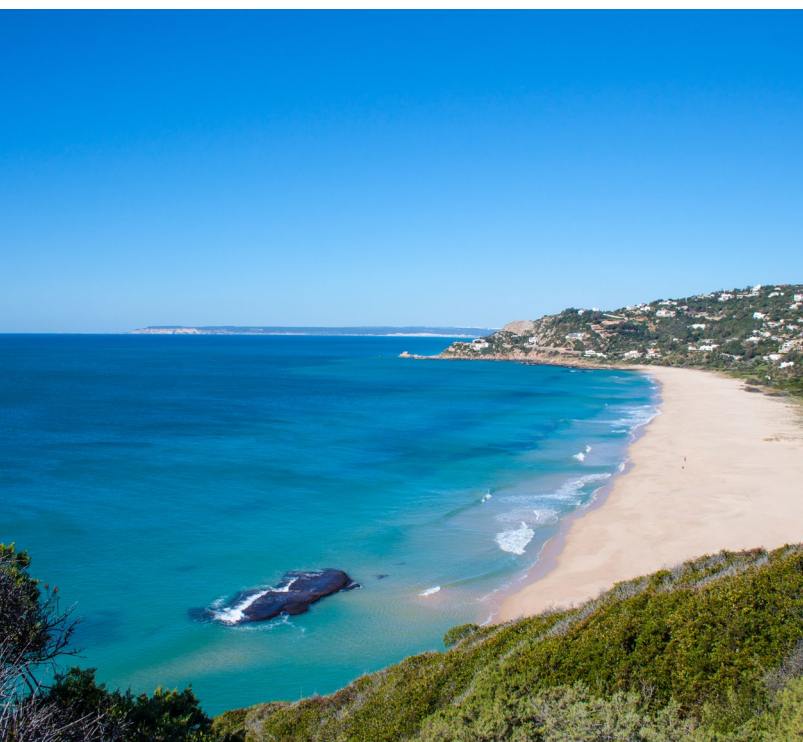
▲ PLAYA DE LOS ALEMANES, ZAHARA DE LOS ATUNES CADIX