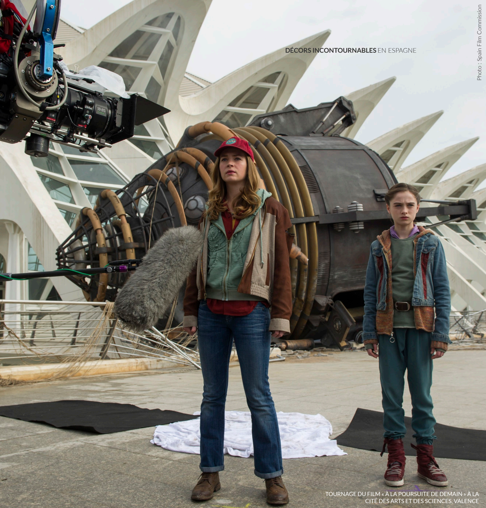
TOURNAGE DU FILM « À LA POURSUITE DE DEMAIN » À LA CITÉ DES ARTS ET DES SCIENCES, VALENCE

emblématiques du complexe se trouvent l'Océanogràfic, le plus grand aquarium d'Europe, et l'Hemisfèric, tel un œil blanc surdimensionné. Complétez votre visite par le Palau de les Arts, un bâtiment imaginé comme une immense sculpture.