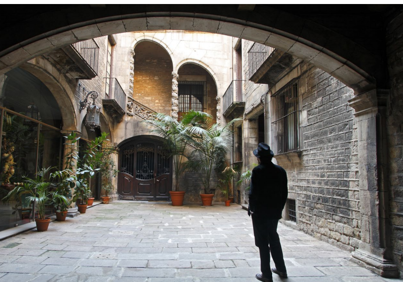
▲ QUARTIER GOTHIQUE BARCELONE

Le Parfum , basé sur le best-seller de Patrick Süskind et réalisé par Tom Tykwer, est un autre long métrage parfait pour explorer les charmes de Barcelone, qui prend ici la forme de Paris au XVIII e siècle. Les ruelles du quartier gothique servent de décor aux aventures de Grenouille, le personnage principal du film. Sur ses pas, vous pourrez flâner entre les vestiges du passé romain de la ville, les ruines des anciens remparts et les rues étroites du quartier juif, et découvrir la cathédrale gothique et les palais les plus significatifs.