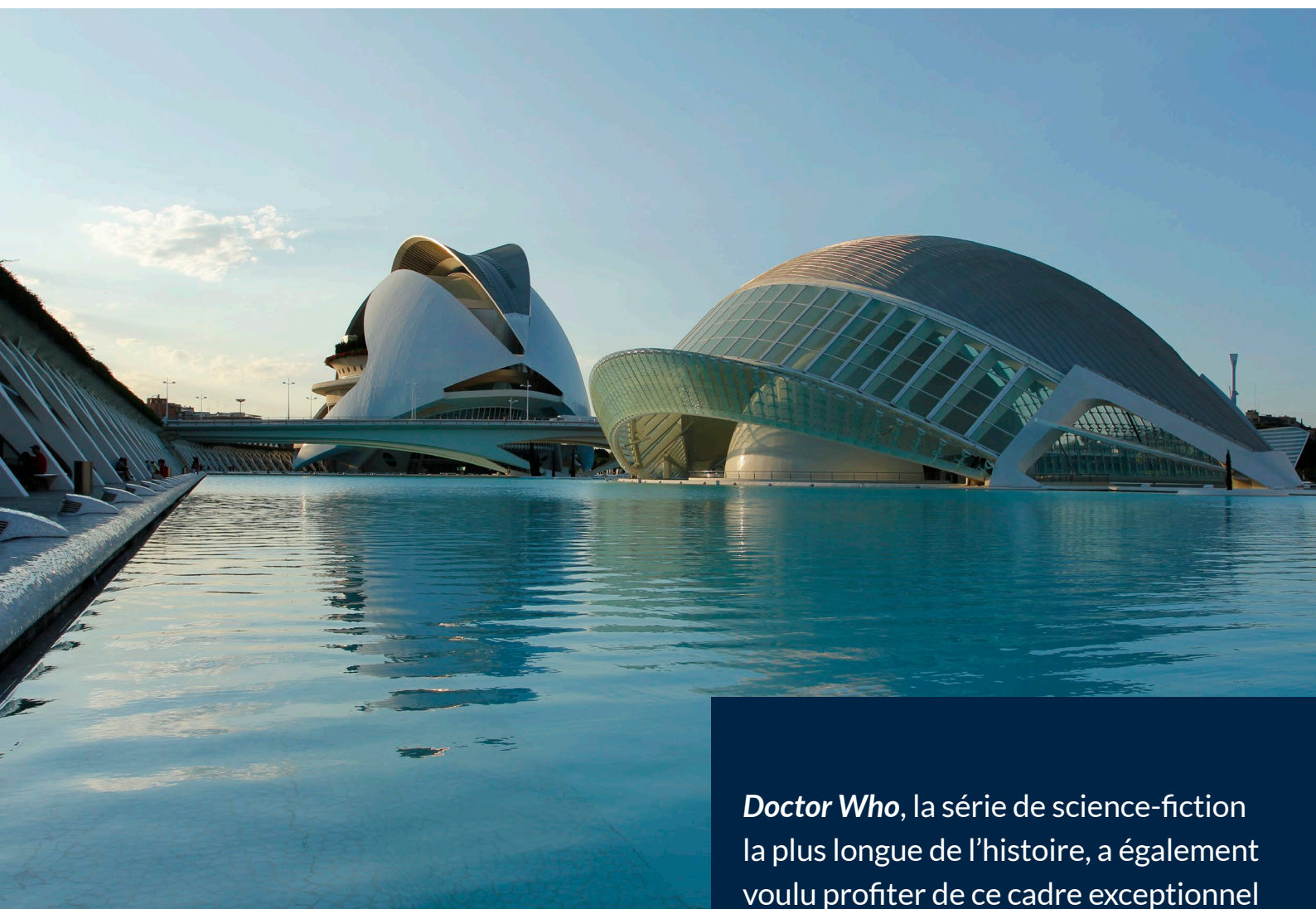
▲ CITÉ DES ARTS ET DES SCIENCES VALENCE