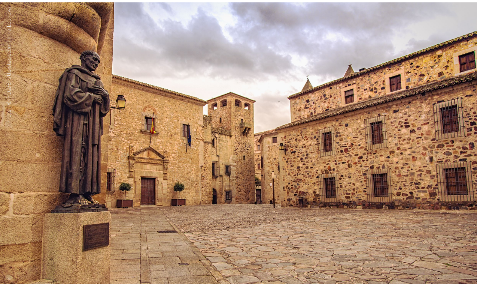
▲ PLACE DE SANTA MARIA ET STATUE DE SAN PEDRO DE ALCANTARA CÁCERES

Séville et son architecture mauresque ont donné vie au royaume du sud de Dorne, qui abrite la Maison Martell. Au cœur de cette belle ville se dresse l' alcazar , classé au patrimoine mondial. Les Jardins de l'Eau, la résidence privée du seigneur de Lancehélion, ont été aménagés dans cet ensemble architectural. Se promener entre ses fontaines, ses orangers et ses palmiers offre un véritable spectacle à tous les sens.