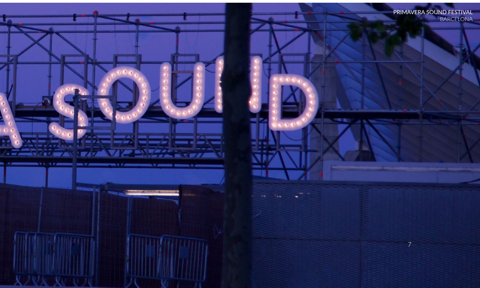
PRIMAVERA SOUND FESTIVAL BARCELONA

Mais informação e venda de bilhetes: www.primaverasound.es