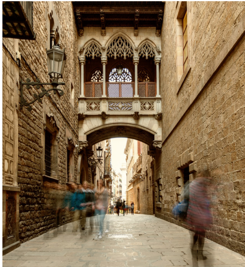
▲ BAIRRO GÓTICO BARCELONA

É bastante fácil aproveitar tudo o que uma cidade como Barcelona te pode oferecer. A localização do Sónar de Dia, perto centro urbano, vai-te permitir conhecer todos os seus encantos. A capital da Catalunha é a cidade modernista por excelência. Aqui poderás contemplar as principais joias arquitetónicas de Antoni Gaudí, como a Sagrada Família ou o parque Güell . Conserva, igualmente, vestígios romanos e bairros medievais (como o famoso bairro Gótico ),