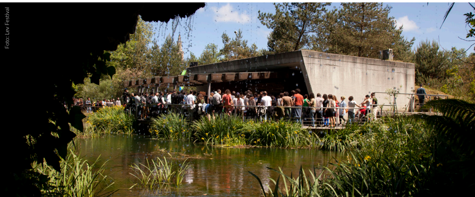
▲ L.E.V. FESTIVAL GIJÓN

Além disso, outros lugares da cidade também se convertem em cenários inusuais, como o Jardim Botânico ou vários museus, capazes de gerar um circuito de experiências únicas que juntam as propostas mais interessantes e vanguardistas da arte audiovisual internacional.