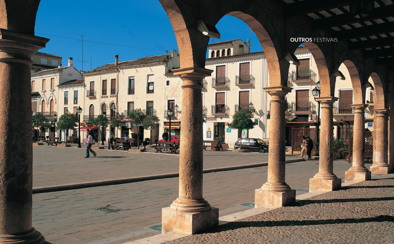
▲ PLAZA MAYOR VILLARROBLEDO, ALBACETE