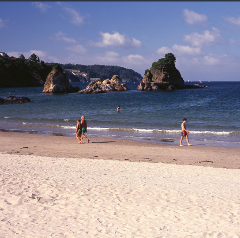
▲ PRAIA DE COVAS - OS CASTELOS VIVEIRO, LUGO

Quatro dias, quatro palcos e 100 bandas que se encontram entre o hard rock , o hardcore , o punk, o heavy metal e todas as suas variantes. Assim se resume a contundente proposta do Resurrection Fest, que se celebra a meados de julho no maravilhoso entorno natural da aldeia piscatória de Viveiro (Lugo).