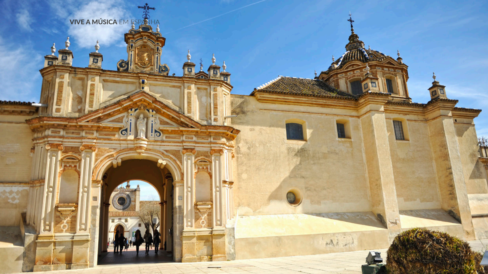
▲ CENTRO ANDALUZ DE ARTE CONTEMPORÂNEA (CAAC) SEVILHA