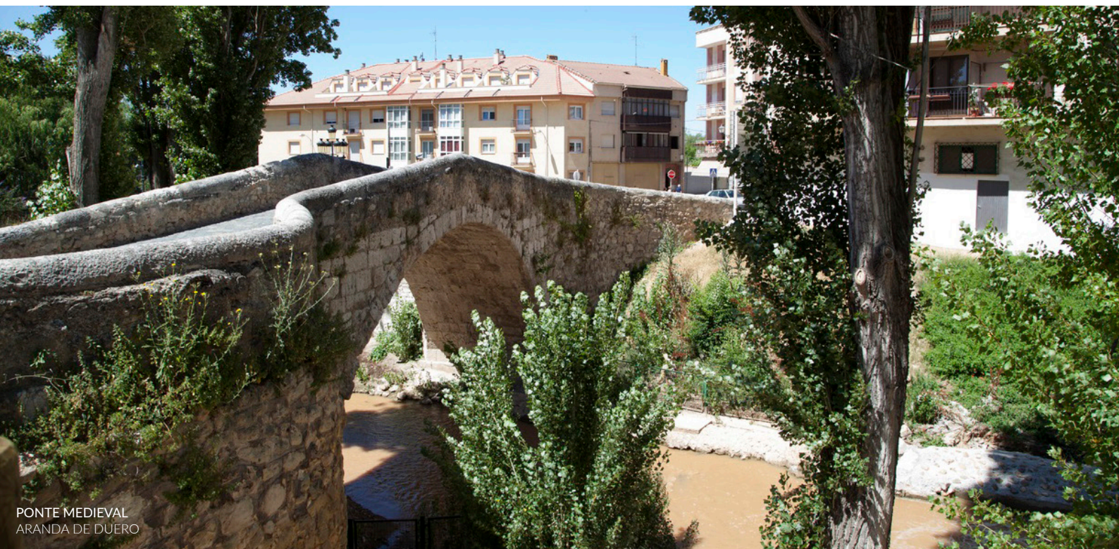
PONTE MEDIEVAL ARANDA DE DUERO

Nas últimas edições acrescentou novas propostas dedicadas à música ibero-americana, no parque da Ilha , e à temática e sons dos anos 60, na praça Arco Pajarito .