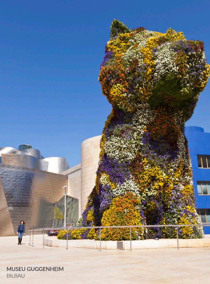
MUSEU GUGGENHEIM BILBAU

Para além do cartaz impecável que apresenta todos os anos, um dos seus pontos fortes é o recinto de Kobetamendi . Encontra-se numa paisagem idílica, num dos montes que rodeiam a cidade e num pequeno bosque que desde há alguns anos acolhe Basoa (bosque em euscará), a zona de DJs do evento. A ela unem-se três grandes palcos e uma tenda, lugares para desfrutar do melhor pop, rock e música eletrónica do planeta.