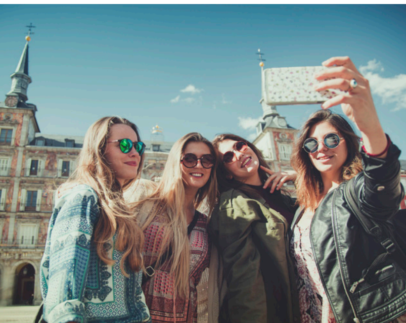
▲ PLAZA MAYOR MADRID