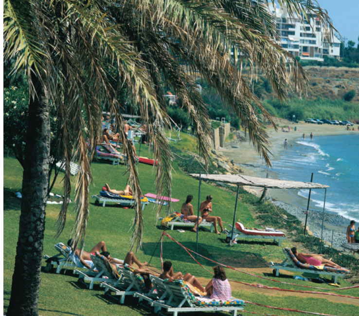
▲ PRAIA DE ESTEPONA MÁLAGA

O recinto conta com foodtrucks , zona de bares e áreas de descanso. A água pulverizada e a instalação de fontes de