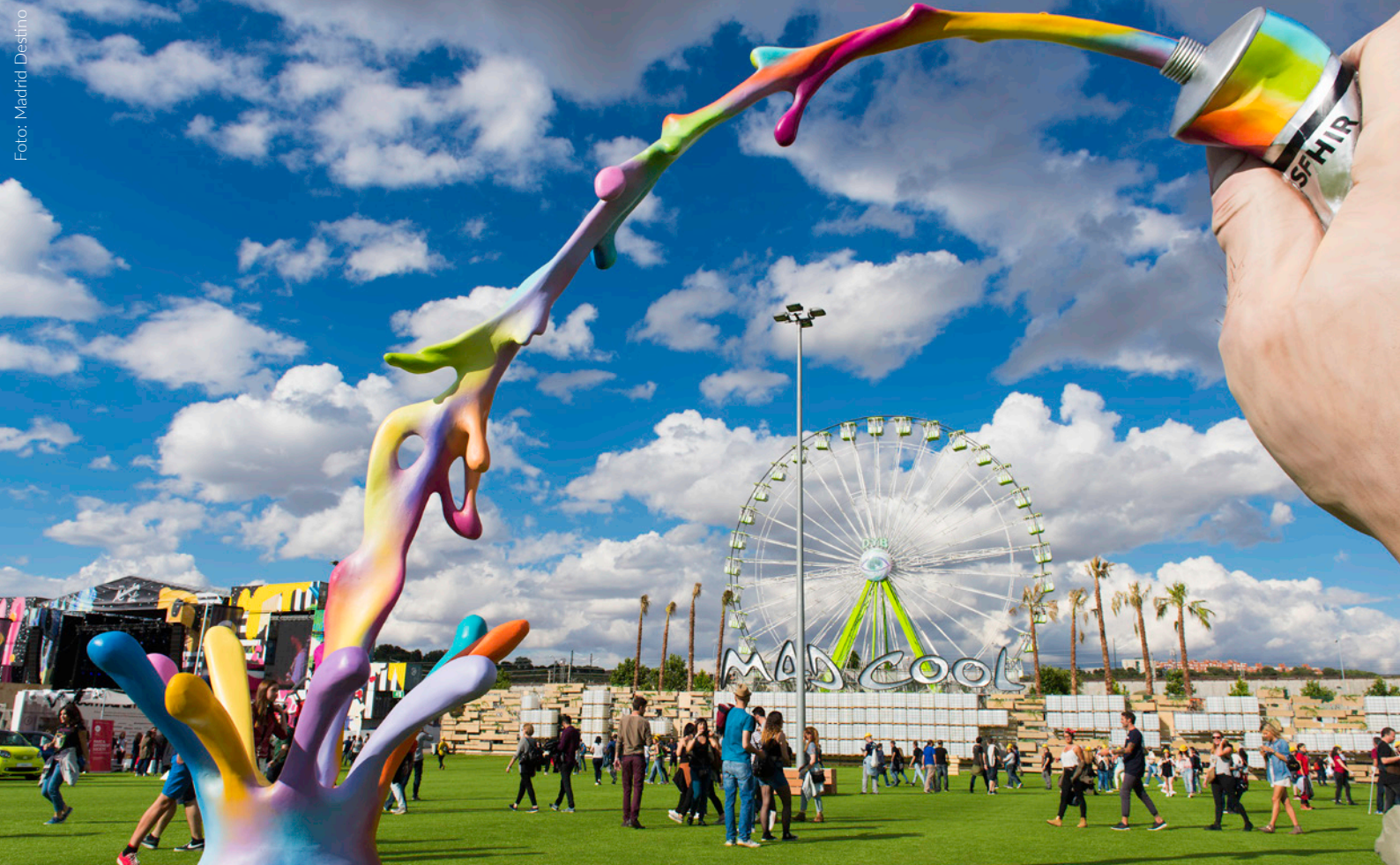
▲ MAD COOL FESTIVAL MADRID