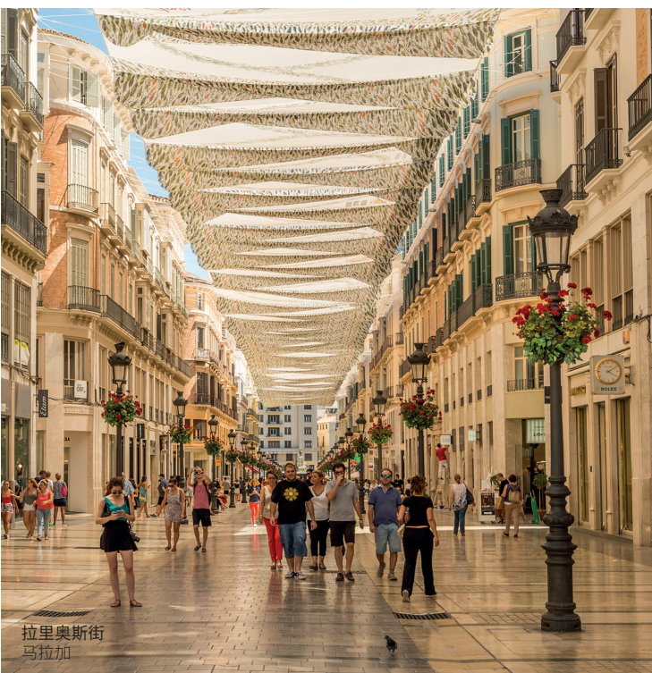
拉里奥斯街 马拉加

时装、家居用品、眼镜、书，有机产品.....探索Indautxu区的各种商店，尤其是Ercilla街及其周边地区。你在寻找礼物或古董吗？探索毕尔巴鄂古根海姆博物馆周围的商业空间及其画廊和展览厅、艺术书店、酒吧和美食空间。