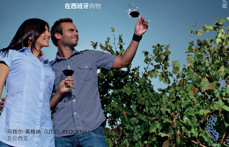
乌铁尔-莱格纳 (UTIEL-REQUENA) 葡萄酒 瓦伦西亚