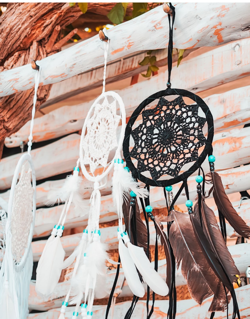
▲ LAS DALIAS 伊比萨

在马拉加（安达卢西亚）每月的第一个星期五，你可以在傍晚时分开放的 La Térmica 夜间文化步道中找到最想要的物品。服装和配饰、插图、雕刻、标志、古董、玩具、文化衍生品、音乐……这里是复古爱好者和收藏家的完美去处。此外还包括娱乐和文化：音乐会、话剧、影片放映和美食选项。这个文化空间位于Casa de la Misericordia的老建筑内。