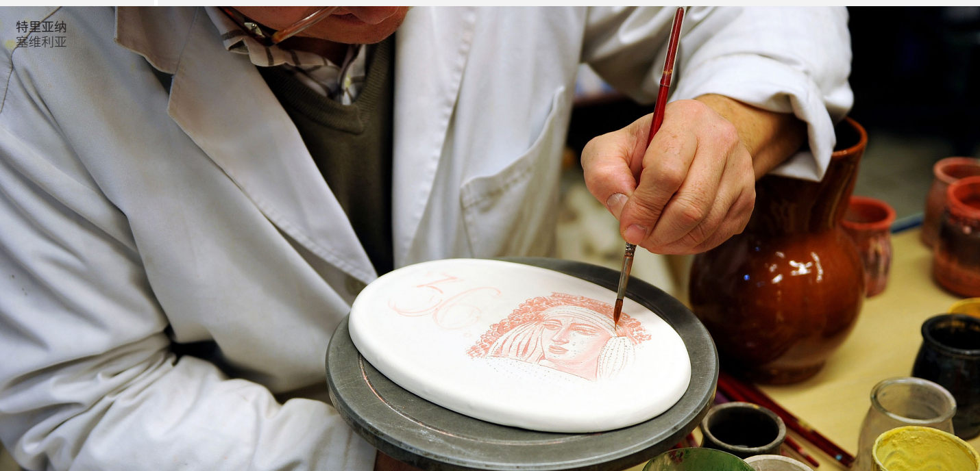
特里亚纳 塞维利亚