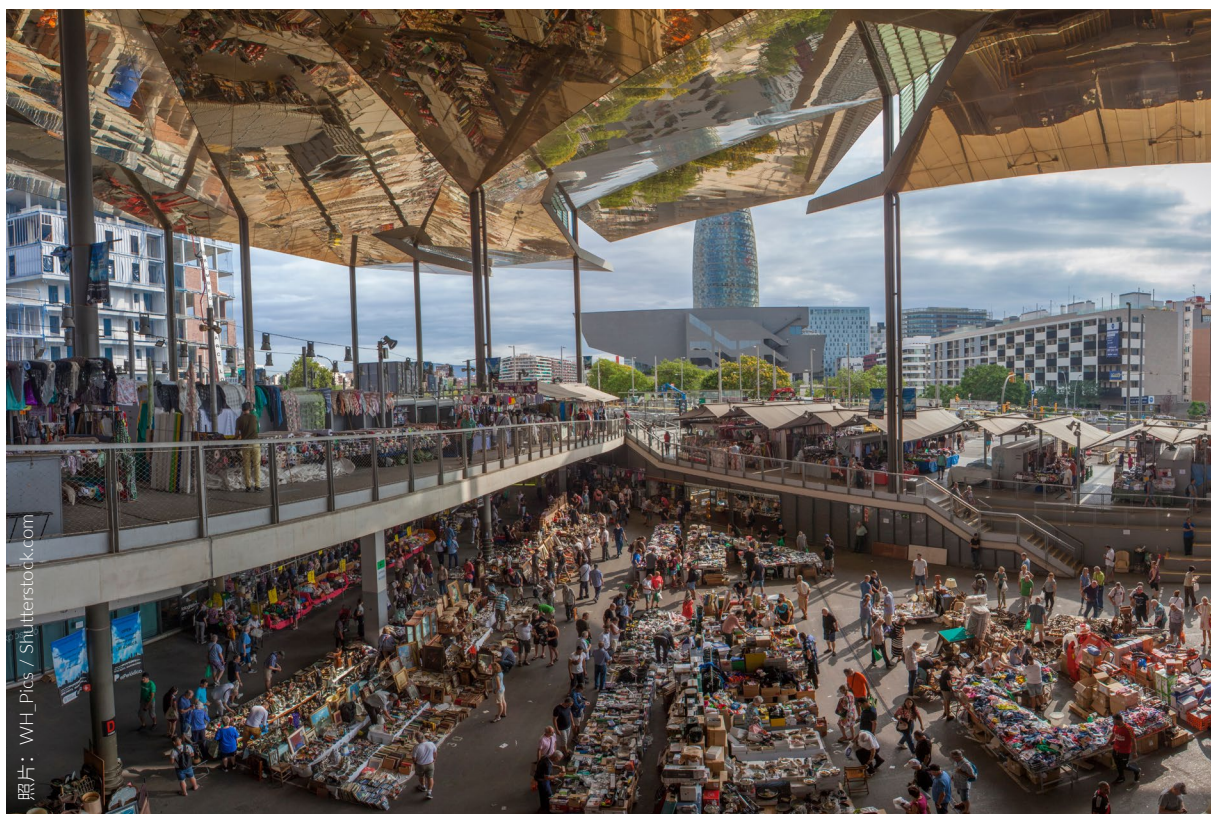
▼ MERCAT DELS ENCANTS市场 巴塞罗那

如果你苦苦寻觅一件东西却难以找到，也许会在巴塞罗那的Mercat dels Encants找到它，无论是新的还是二手的：有衣服、工艺品、家具、机械、家用电器、书籍、唱片等各种物品。每周四次进行公开拍卖，这与其他欧洲市场不同。这些摊位位于一个镶满镜子、高24米的屋顶下，令人印象深刻。这里也有几处修缮工厂。