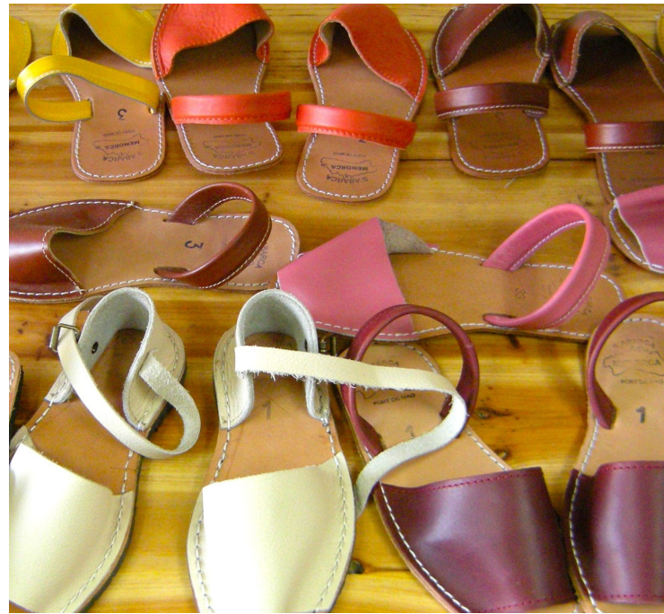
▲ MENORQUINAS鞋 梅诺尔卡

位于加迪斯山脉的 Ubrique 是手工制作的皮具和皮革制品的天堂。它有近40个作坊。此外，这里的街上商店云集，你可以买到高质量的鞋子、包和钱夹。这就是为什么许多大型国际品牌在这里生产的原因。