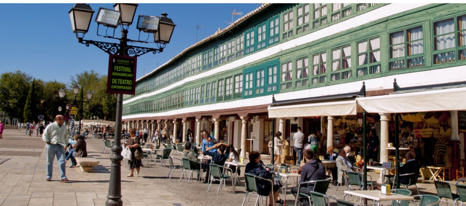
▲ 阿尔马格洛 雷亚尔城

在马略卡岛，仍有三家工厂采用玻璃吹制技术：去那里参观，看看制作彩色杯子、灯具、盘子或烛台的炉子。除了购买独特的作品外，你还可以吹制自己的玻璃泡。