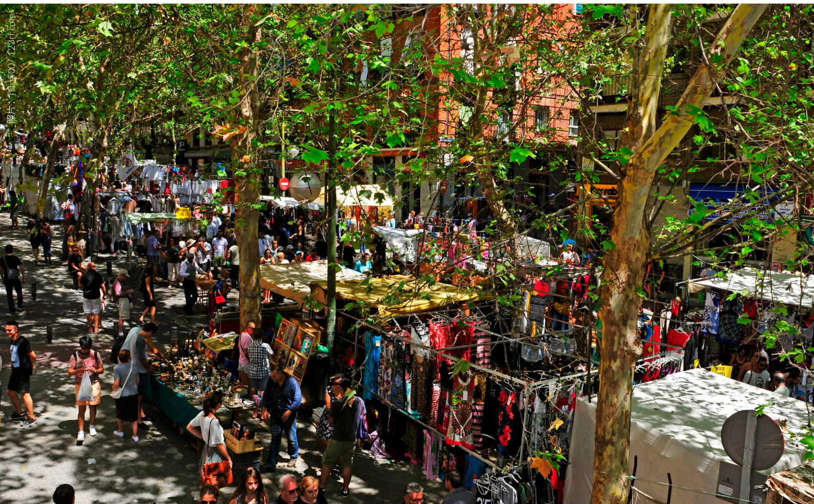
▲ 拉斯特罗旧货市场 马德里

在马德里，漫步于历史悠久的露天街头市场El Rastro，周日和节假日开放至下午3点，在Plaza de Cascorro广场和Ronda de Toledo之间举行。这里有各种各样的商品，古旧而值得把玩的物件、书籍、新的及二手的衣服、复古家具和古玩。在热闹的氛围中，和马德里当地人一起在附近的小酒馆和酒吧品尝开胃酒。一周剩下的时间