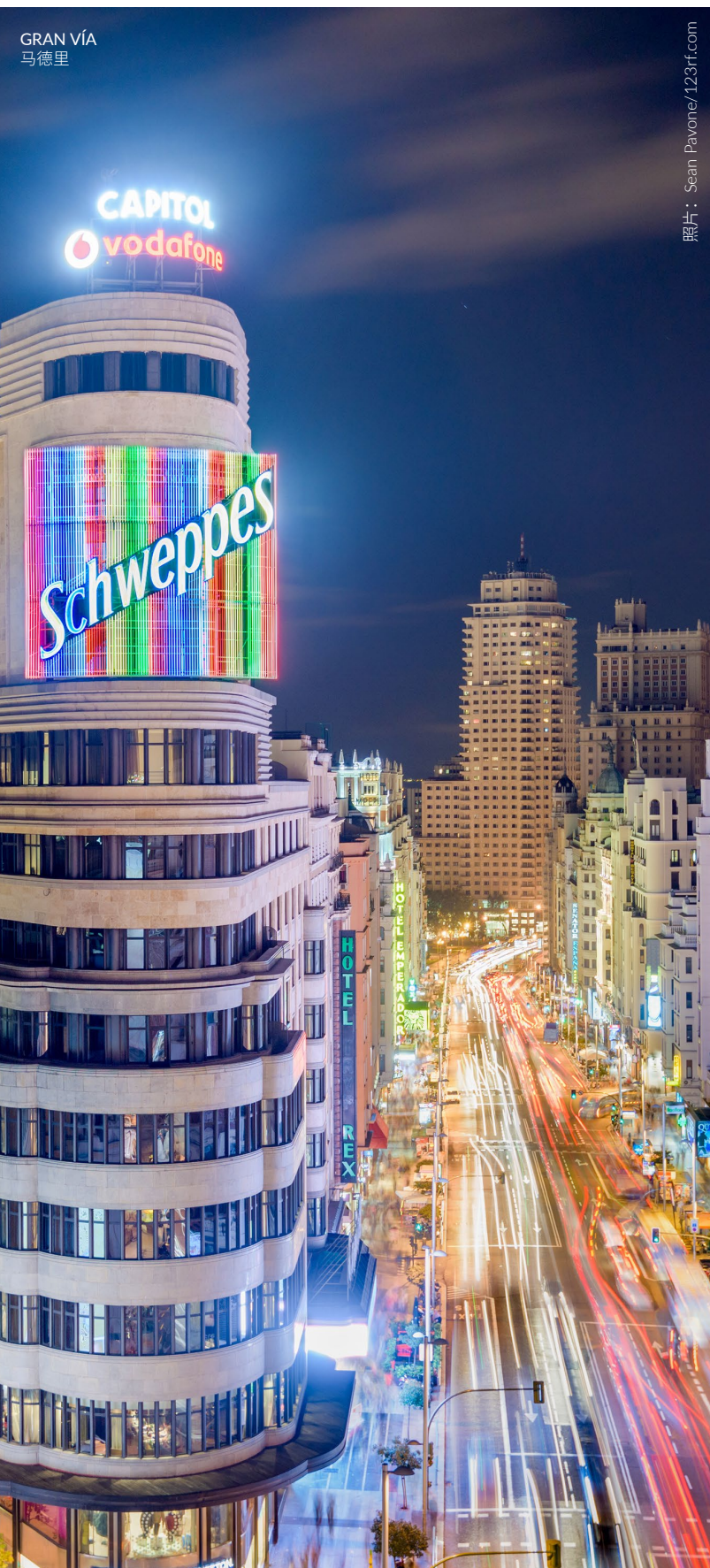
GRAN VÍA 马德里