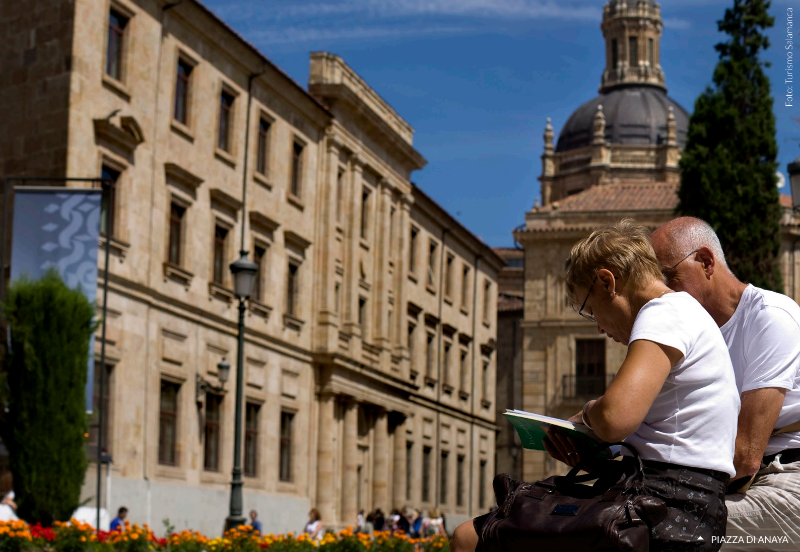
▲ PIAZZA DI ANAYA

Ministero dell'Industria, del Commercio e del Turismo Pubblicato da: © Turespaña Elaborato da: Lionbridge NIPO: 086-17-057-3