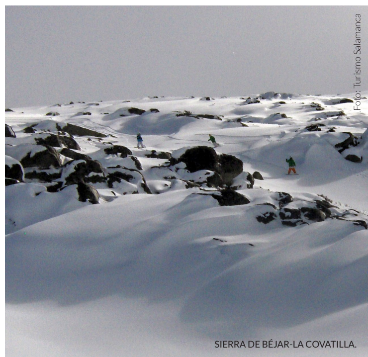
SIERRA DE BÉJAR-LA COVATILLA.

gne. Se ami gli sport invernali, potrai usufruire degli impianti del vicino comprensorio sciistico della Sierra de Béjar-La Covatilla.