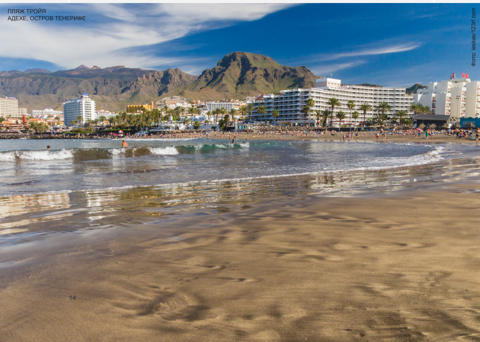
ПЛЯЖ ТРОЙЯ АДЕХЕ, ОСТРОВ ТЕНЕРИФЕ

① Дополнительная информация: www.webtenerife.com