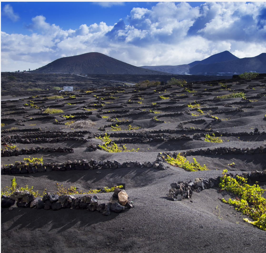
▲ ЛА-ГЕРИЯ ЛАНСАРОТЕ

На «блаженных островах» вы полакомитесь исключительно вкусной рыбой и морепродуктами, такими как рыба-попугай (вьеха), групер и бурый окунь. Канарские острова — это еще и фруктовый рай, где банан стоит на первом месте. Продегустируйте 10 вин с наименованием по происхождению, которые имеются на архипелаге и попробуйте сыр, уделяя особое внимание сорту махореро, — это кулинарная жемчужина Фуэртевентуры, изготовленная из