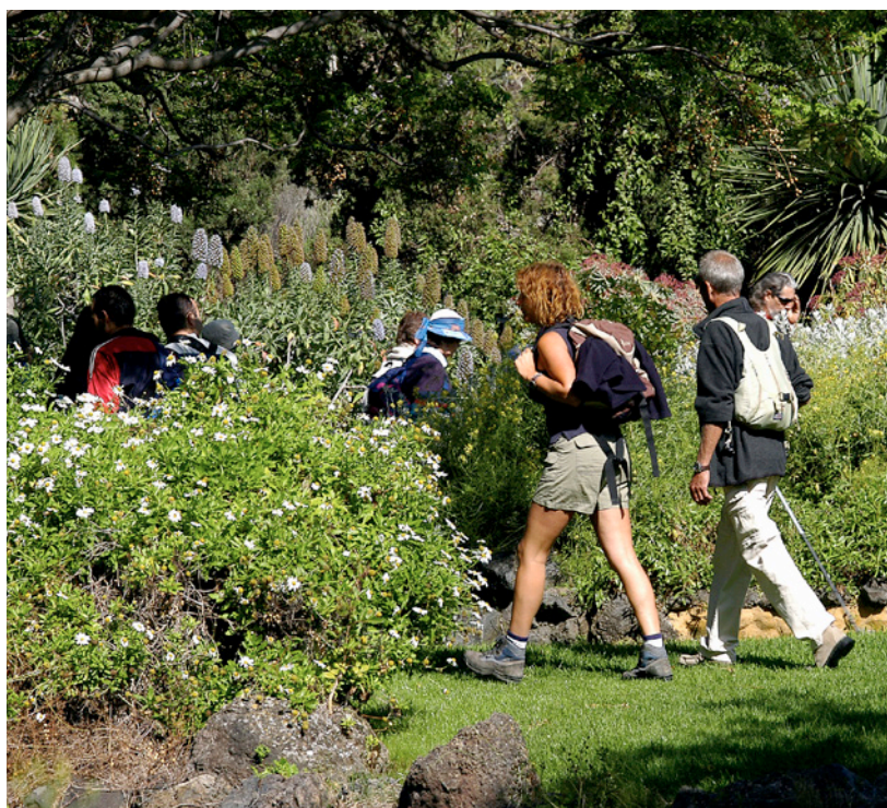
▼ КАНАРСКИЙ БОТАНИЧЕСКИЙ САД ВЬЕРА-И-КЛАВИХО ЛАС-ПАЛЬМАС-ДЕ-ГРАН-КАНАРИЯ