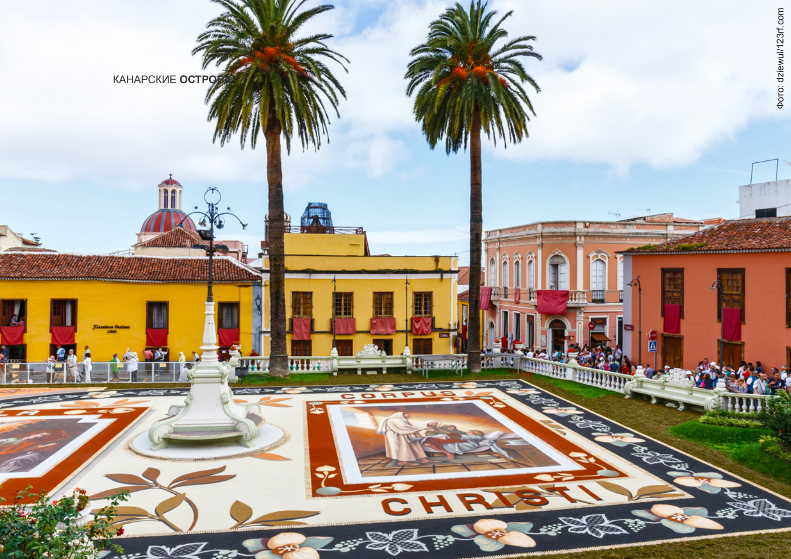
▲ ЦВЕТОЧНЫЕ КОВРЫ НА ПРАЗДНИК ТЕЛА И КРОВИ ХРИСТОВЫХ ЛА-ОРОТАВА, ОСТРОВ ТЕНЕРИФЕ

Увлекательная экскурсия приведет вас в городок Канделария, где царит приморская оживленная атмосфера. Самым знаковым строением здесь является базилика. В июле и августе городок отмечает праздники в честь местной покровительницы святой девы Канделарии с красивыми народными паломничествами и подношениями цветов.