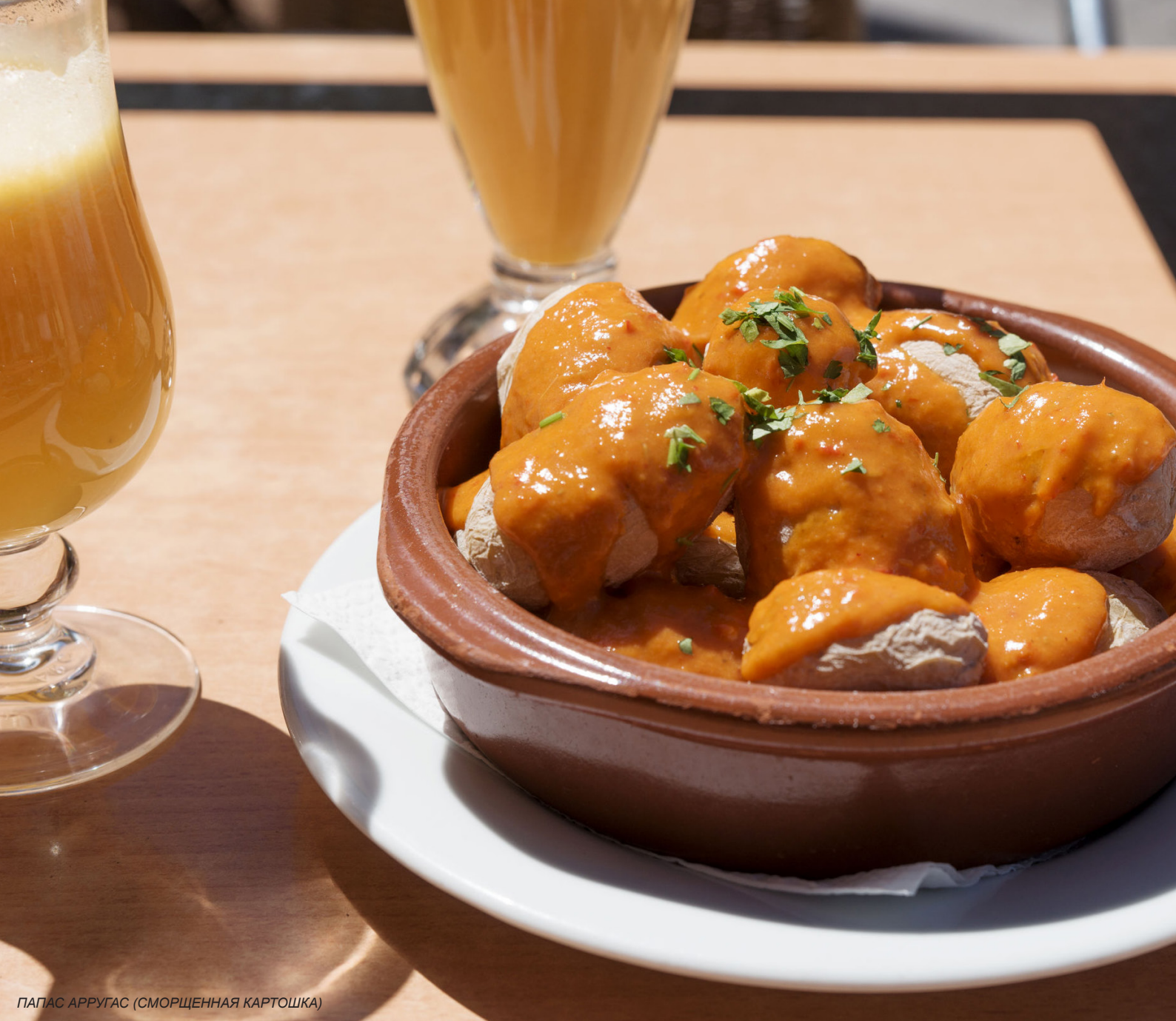
ПАПАС АРРУГАС (СМОРЩЕННАЯ КАРТОШКА)