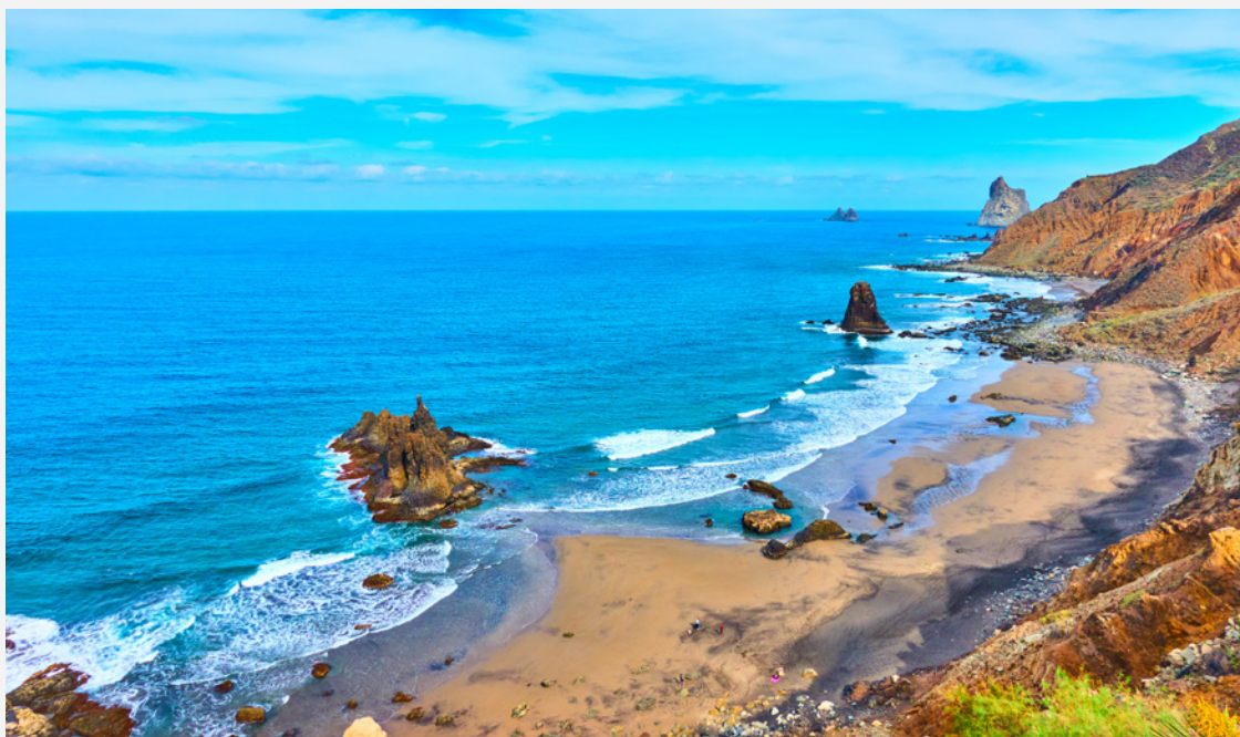
▲ ПЛЯЖ БЕНИХО ТЕНЕРИФЕ

спокойными пляжами с белым песком; местами, идеально подходящими для занятий водными видами спорта и разнообразными вариантами проведения досуга с заведениями прямо у пляжа, открытыми для посетителей днем и ночью.