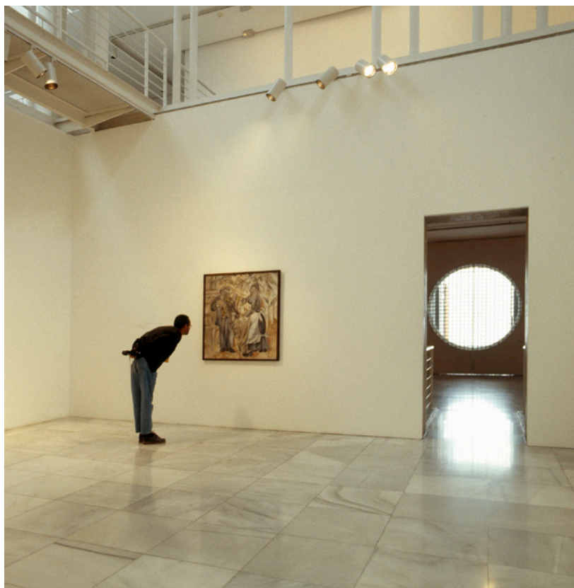
▲ АТЛАНТИЧЕСКИЙ ЦЕНТР СОВРЕМЕННОГО ИСКУССТВА (СААМ) ЛАС-ПАЛЬМАС-ДЕ-ГРАН-КАНАРИЯ

Самые яркие впечатления от путешествия по Гран-Канарии оставит у вас наблюдение за китообразными в Пуэрто-Рико. Не нужно слишком отдаляться от берега для того, чтобы встретиться с дельфинами, финвалами, гриндами, кашалотами и другими представителями этих широт. Лучше всего положиться на экспертов, которые прекрасно знакомы с водами, в которых обитают эти животные, а также с особенностями их поведения.