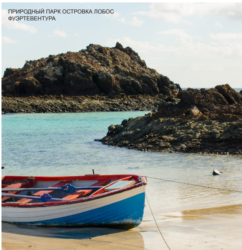
ПРИРОДНЫЙ ПАРК ОСТРОВКА ЛОБОС ФУЭРТЕВЕНТУРА

Ветер и волны открытого моря у берегов Фуэртевентуры идеальны для тех, кто хочет испытать свою ловкость с доской виндсерфинга . Любителей дайвинга любого уровня ждут пляжи полуострова Хандия и муниципалитета Калета-де-Фусте. Парусный спорт, серфинг, водные лыжи и рыбалка (если вас привлекают острые ощущения, наберитесь храбрости и поучаствуйте в ловле рыбы-парусника) — виды спорта, которыми вы сможете заняться здесь.