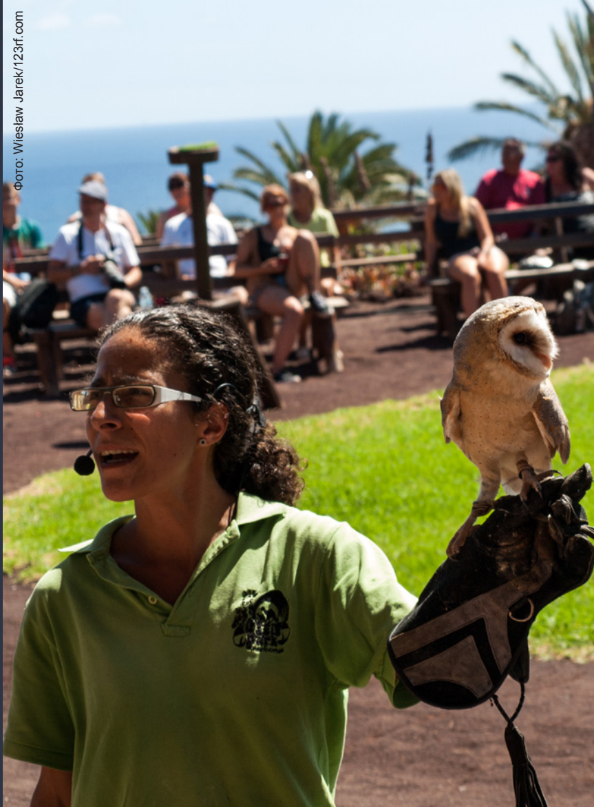
▲ ОАСИС ПАРК ФУЭРТЕВЕНТУРА