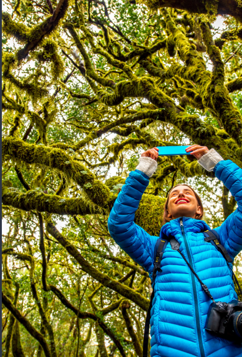
▲ НАЦИОНАЛЬНЫЙ ПАРК ГАРАХОНАЙ ЛА-ГОМЕРА

Искупайтесь на пляжах, обрамленных утесами, и поддайтесь очарованию Лос-Органос на севере острова, где вы услышите музыку, которую создает ветер между скал. В долине Валье-дель-Рей вас ждет мозаика из пальм и кварталов с белыми домами. Вы можете также побывать в очаровательном городке Агуло. Образ сказочных домиков с цветными фасадами станет для вас одним из самых ярких воспоминаний.