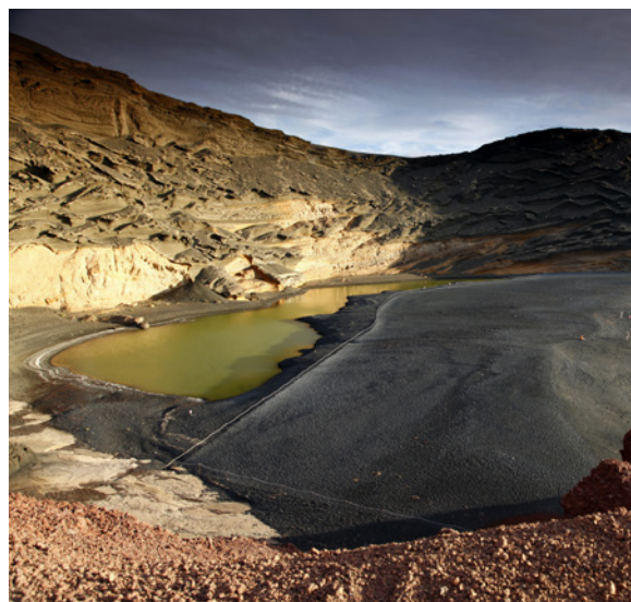
▲ ЧАРКО-ДЕ-ЛОС-КЛИКОС ЛАНСАРОТЕ

Исследуйте лагуну Ханубио и поднимитесь на смотровую площадку, с которой открывается вид на солончаки. В биосферном заповеднике Чарко-де-лос-Кликос вы откроете для себя потрясающее зеленое озеро, расположенное над кратером вулкана.