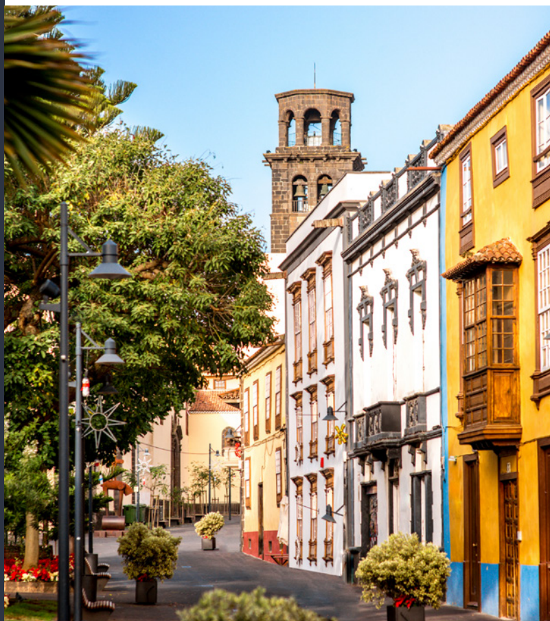
▲ САН-КРИСТОБАЛЬ-ДЕ-ЛА-ЛАГУНА ТЕНЕРИФЕ

На побережье и во внутренних районах острова вы встретите очаровательные городки и усадьбы в окружении гор, где все еще живут местные традиции и все дышит покоем. Юг особенно знаменит своими большими курортами, тематическими парками и кипящей ночной жизнью. Еще одна из местных достопримечательностей — это знаменитый карнавал, настоящий взрыв пурпура, цвета и ритмов.