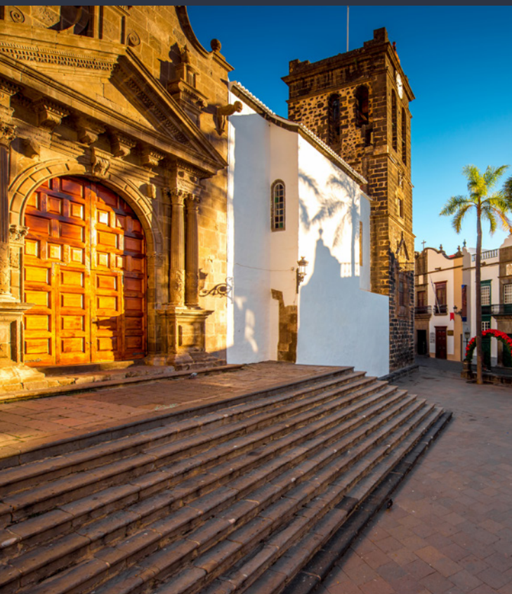
▲ ЦЕРКОВЬ ХРИСТА СПАСИТЕЛЯ САНТА-КРУС-ДЕ-ЛА-ПАЛЬМА

Ла исла бонита («красивый остров») — это самый зеленый остров всего архипелага. Здесь стоит побывать лишь ради того, чтобы увидеть доисторические лавровые леса (лаурисильва) и звездное небо, видимость которого является одной из лучших в мире благодаря уникальным астрономическим условиям. Имеется множество способов для путешествия по острову, но один из самых увлекательных — сделать это пешком. Имеющиеся здесь тропы подходят для самых разных любителей приключений и приведут вас в самые невероятные места.