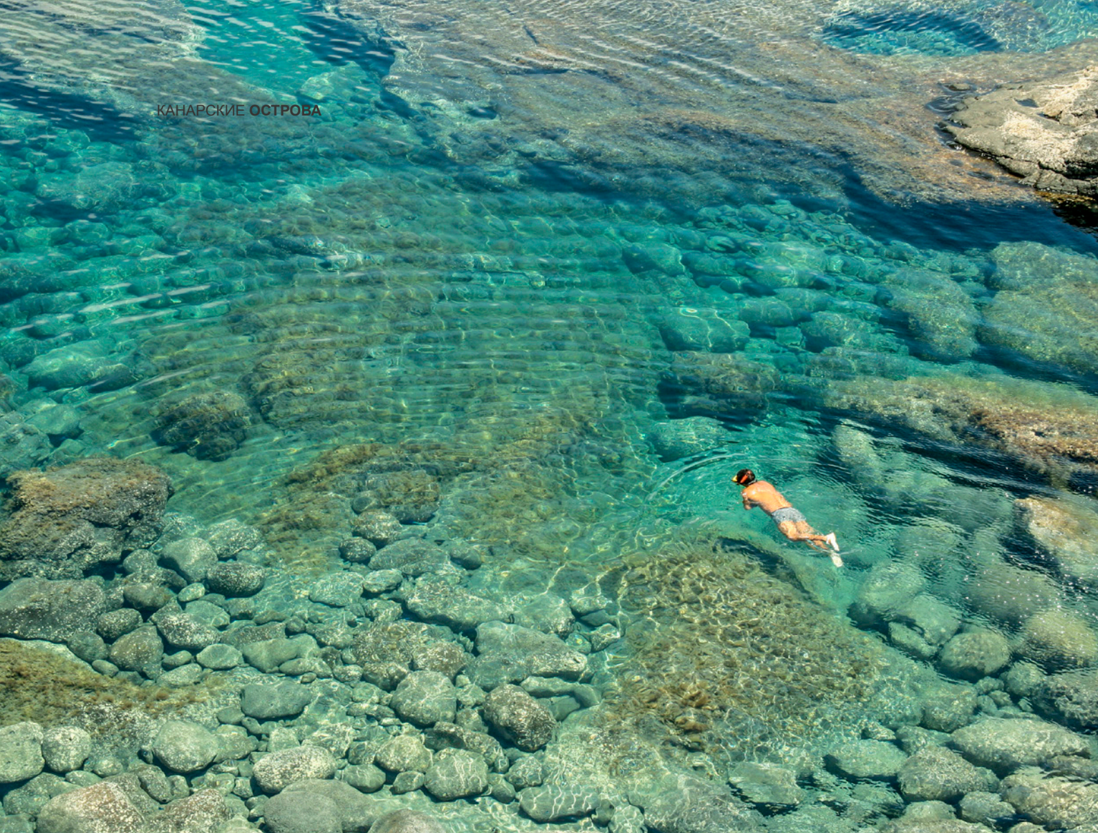
▲ НАТУРАЛЬНЫЕ ВОДОЕМЫ ЛОС-ЧАРКОНЕС ЛАНСАРОТЕ