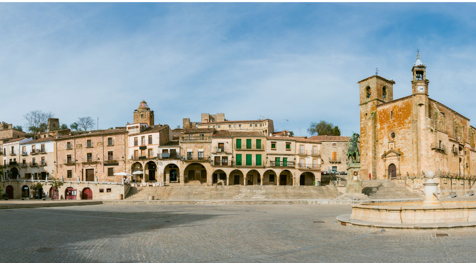
▼ ПЛОЩАДЬ ПЛАСА-МАЙОР В ТРУХИЛЬО КАСЕРЕС

Оказавшись летом в Уэске (Арагон), можно посетить два гастрономических события: День колбасок лонганиса в Граусе (в июле) и Праздник ягнатины в Серлере (в августе).