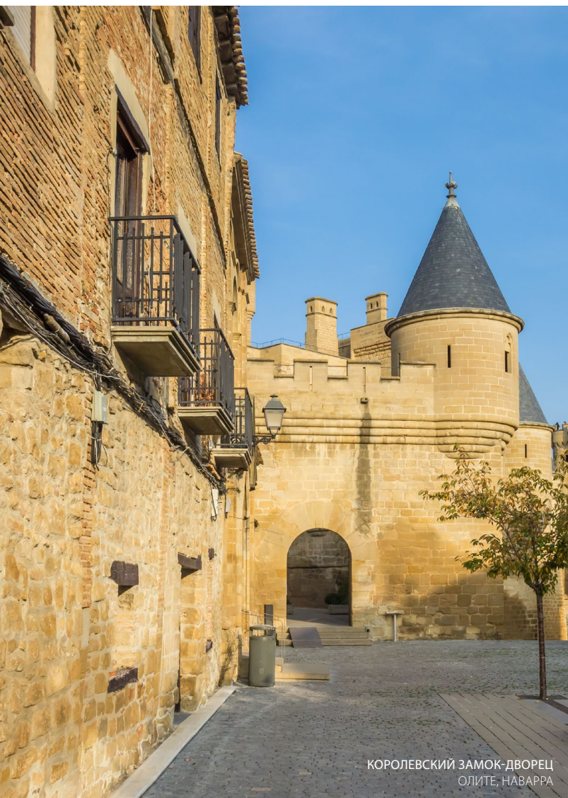
КОРОЛЕВСКИЙ ЗАМОК-ДВОРЕЦ ОЛИТЕ, НАВАРРА