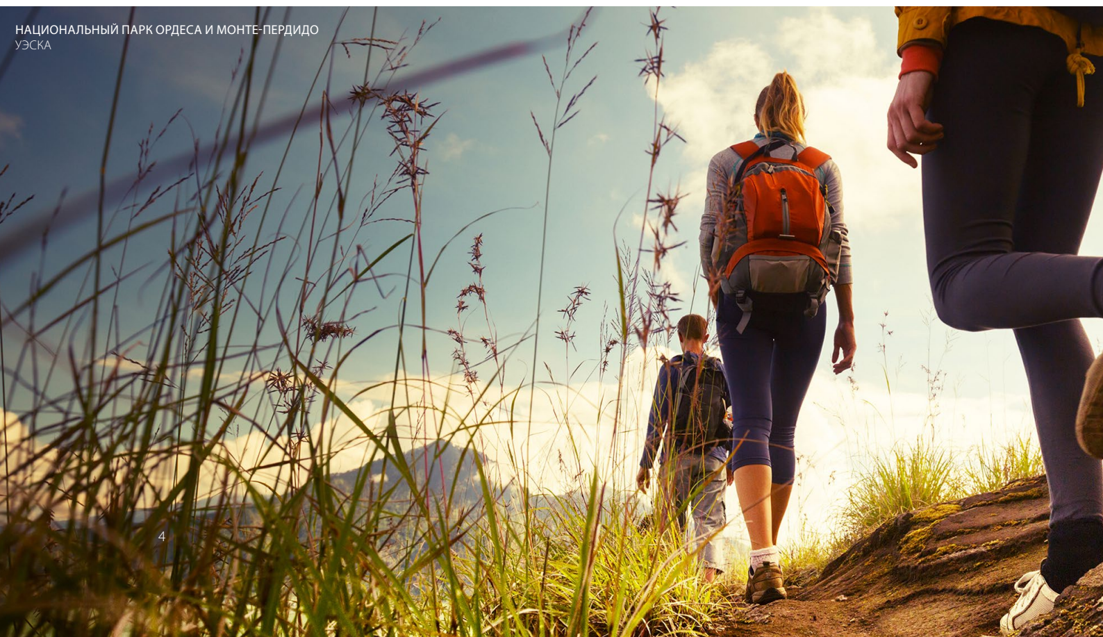
НАЦИОНАЛЬНЫЙ ПАРК ОРДЕСА И МОНТЕ-ПЕРДИДО УЭСКА

Кроме того, в Арагоне можно посетить город Теруэль , обладающий богатым мудехарским наследием, включенным в список объектов Всемирного наследия ЮНЕСКО. Побалуйте себя, попробовав местный изысканный хамон.