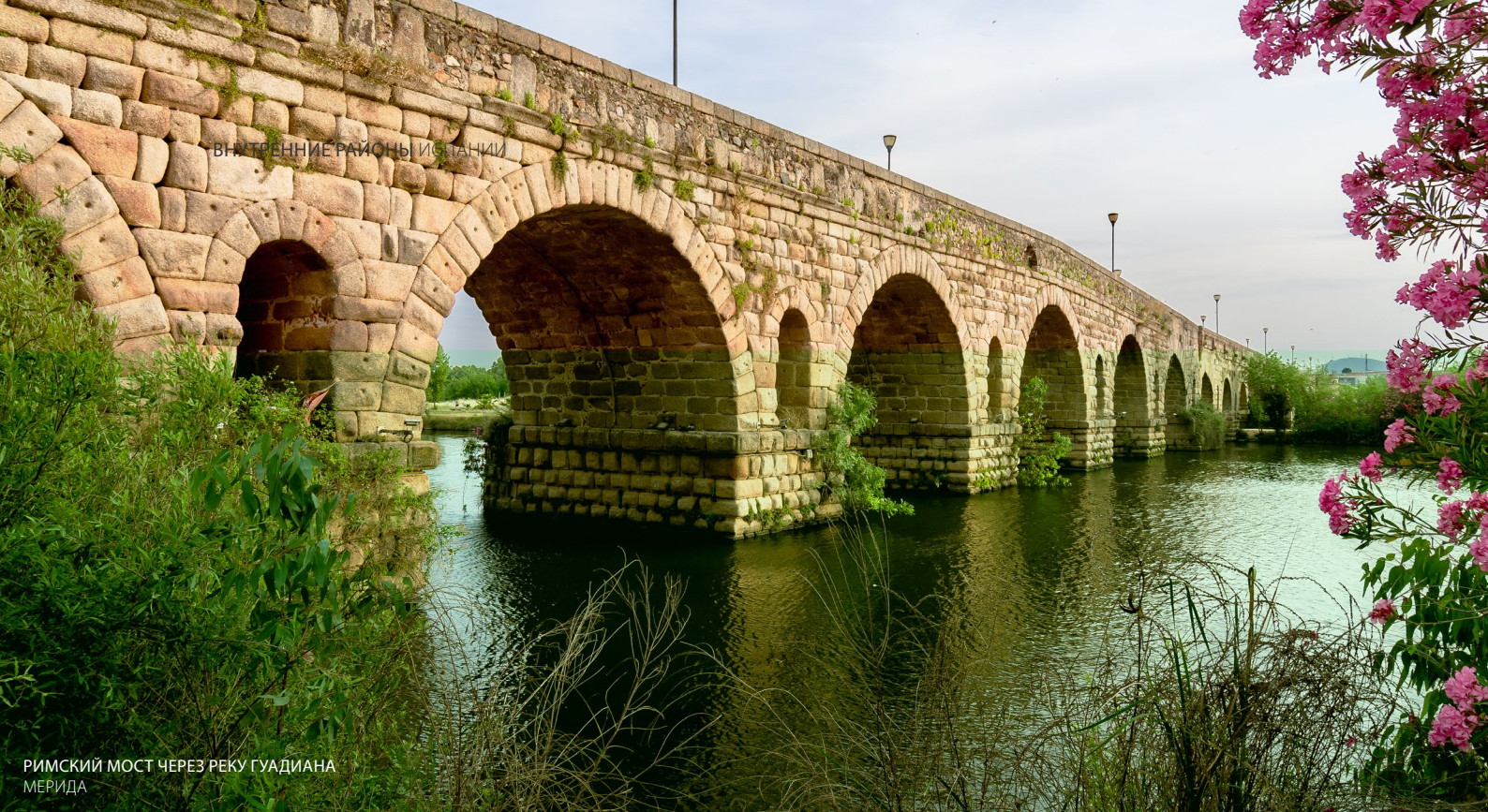
РИМСКИЙ МОСТ ЧЕРЕЗ РЕКУ ГУАДИАНА МЕРИДА

В Эстремадуре посетите старый город Касереса со средневековыми домами-крепостями, а в Мериде (Бадахос) откройте для себя бесценное прошлое римской эпохи.