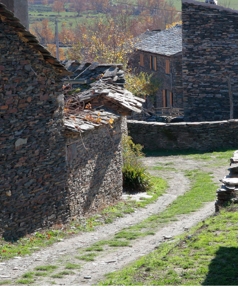
▲ КАМПИЛЬО-ДЕ-РАНАС ГВАДАЛАХАРА

воды, ветра и льда. Кроме того, вы сможете познакомиться с уникальными экосистемами национальных парков Таблас-де-Даймиэль и Кабаньерос. Гвадалахара приглашает вас познакомиться с местной природой, посетив знаменитые «черные деревни» (при их строительстве в качестве основного материала используется сланец). Город Гвадалахара сохраняет интересные образцы светской архитектуры, такие как Дворец герцогов Инфантадо, и религиозного зодчества, такие как иезуитская барочная церковь Святого Николая эль-Реаль.