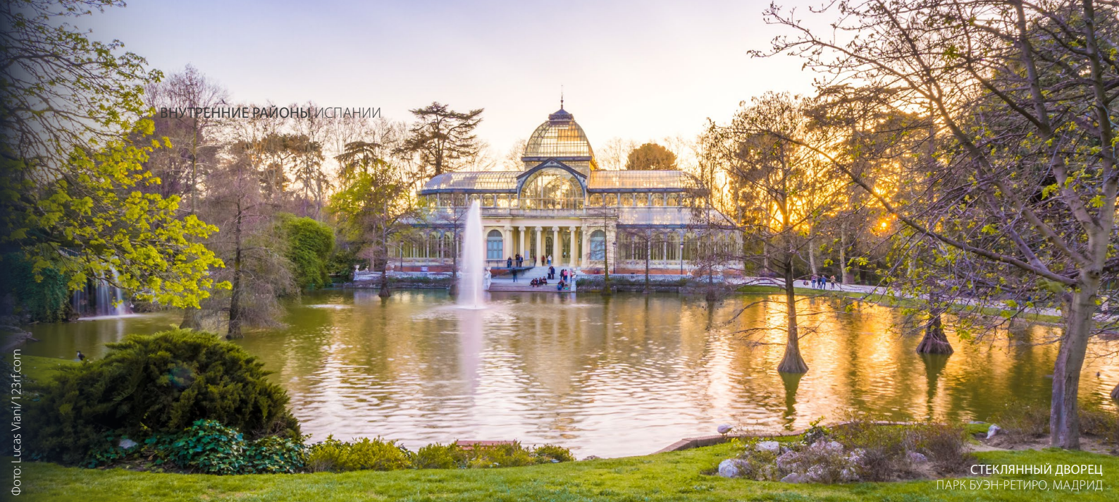
СТЕКЛЯННЫЙ ДВОРЕЦ ПАРК БУЭН-РЕТИРО, МАДРИД