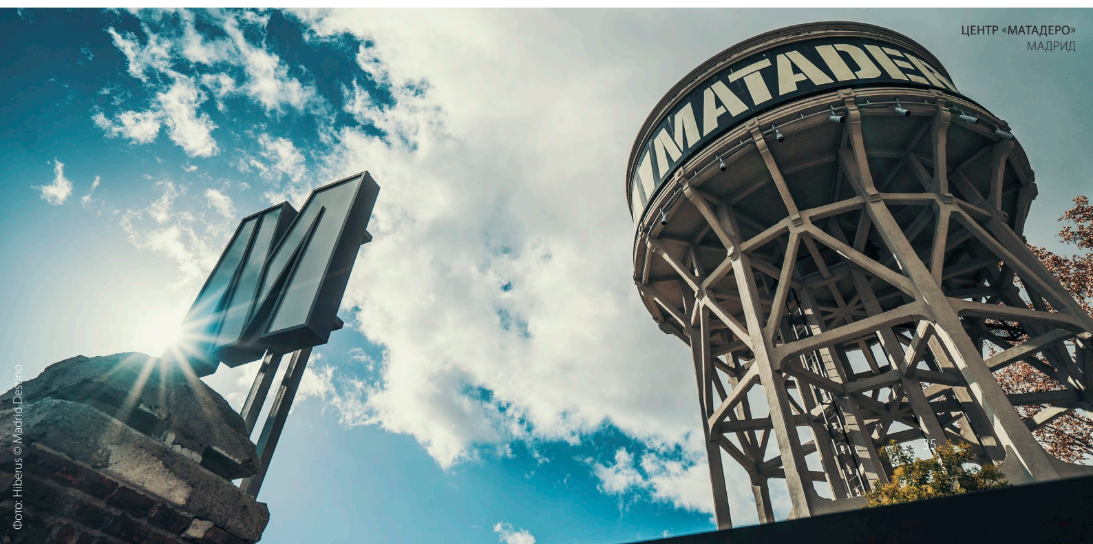
ЦЕНТР «МАТАДЕРО» МАДРИД

Музыка, театр, кино... Внутренние районы Испании предлагают разнообразную культурную программу, которая будет вам интересна. Вот некоторые идеи. В начале января в Логроньо (Риоха) проходит первый большой фестиваль в культурном календаре Испании. Он называется «Актуальный ландшафт современных культур» и предлагает большое количество концертов, театральных постановок, кинопремьер и выставок. В марте Памплона (Наварра) превращается в мировой центр документального кино благодаря Международному фестивалю документального кино «Точка зрения» . Показы проходят в различных местах города и предназначены для самой разной аудитории.