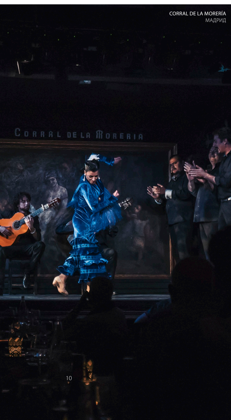
CORRAL DE LA MORERÍA МАДРИД