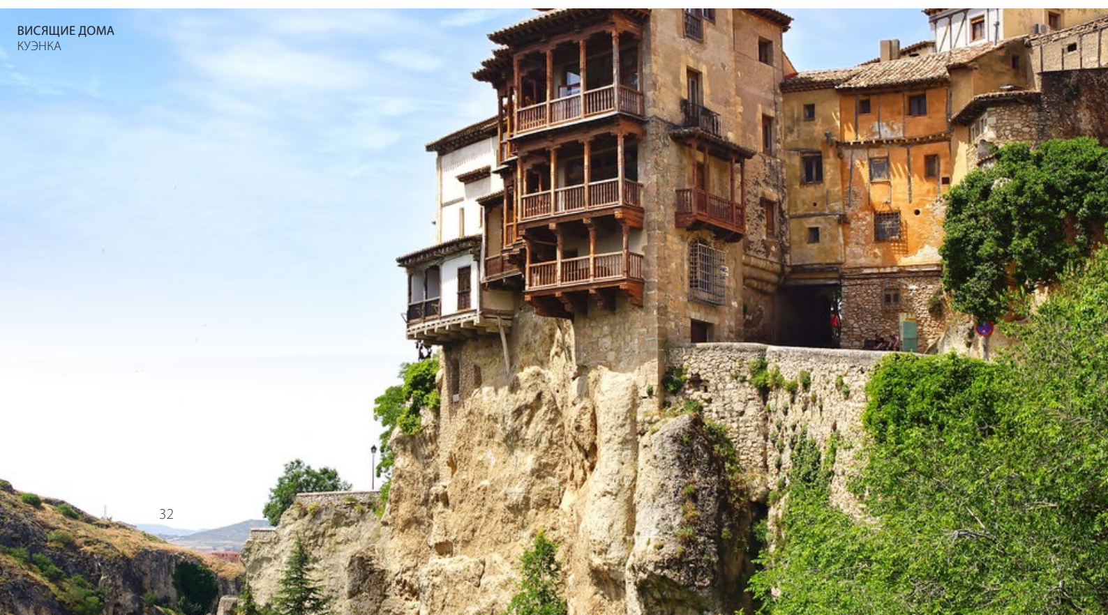
ВИСЯЩИЕ ДОМА КУЭНКА

нависают над обрывом над рекой Уэскар. Кроме того, незабываемые впечатления ждут вас в Толедо , известном как «город трех культур» благодаря уникальному архитектурному наследию, которое оставили жившие здесь христиане, арабы и евреи.