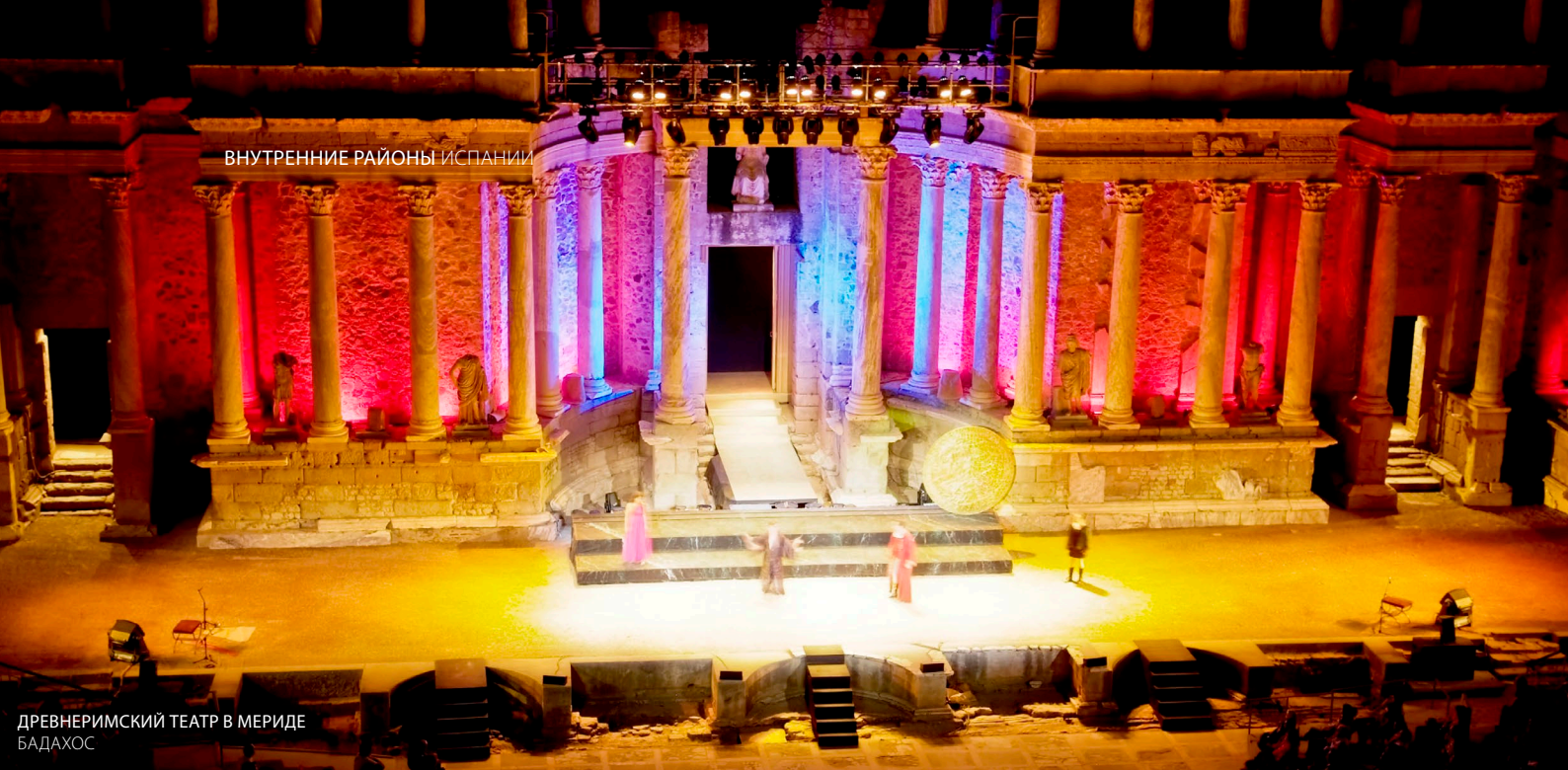
ДРЕВНЕРИМСКИЙ ТЕАТР В МЕРИДЕ БАДАХОС

Если вам нравится инди-музыка, закажите билеты на независимый мадридский фестиваль Tomavistas , который проходит в мае. Также в Мадриде не пропустите фестиваль Mad Cool , где каждое лето выступают самые актуальные международные группы. В какое бы время вы ни приехали, культурная программа Мадрида не оставит вас равнодушным. Вас ждет много интересного — от больших театров, где вы сможете увидеть самые известные мюзиклы, до самых современных культурных центров, таких как « Матадеро ».