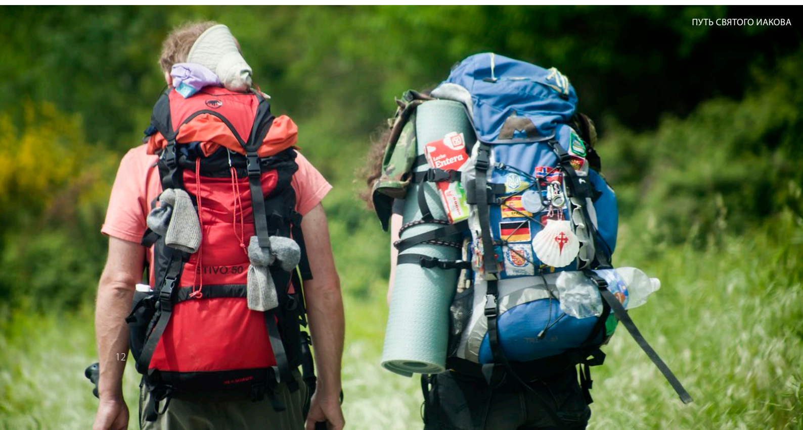
ПУТЬ СВЯТОГО ИАКОВА

Осень — это идеальное время для знакомства с центром этого сообщества, ведь именно тогда такие городки, как Олите , отмечают праздник сбора урожая и проводят мероприятия, связанные с вином, состязания с быками и парады повозок, и при этом повсюду звучит музыка.