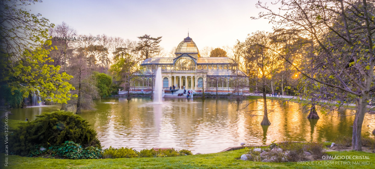
O PALÁCIO DE CRISTAL PARQUE DO BOM RETIRO, MADRID