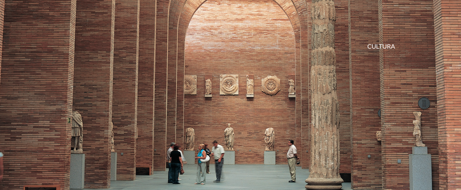
▲ MUSEU-NACIONAL DE ARTE ROMANA MÉRIDA

Em León desfruta de uma experiência artística diferente no Museu de Arte Contemporânea de Castela e Leão (MUSAC) , cuja sede foi premiada internacionalmente pela sua arquitetura original. Sem sair de Castela e Leão, aprende tudo sobre as nossas origens no Museu da Evolução Humana , em Burgos. Este espetacular e moderno centro didático mostra os descobrimentos das famosas jazidas arqueológicas de Atapuerca .