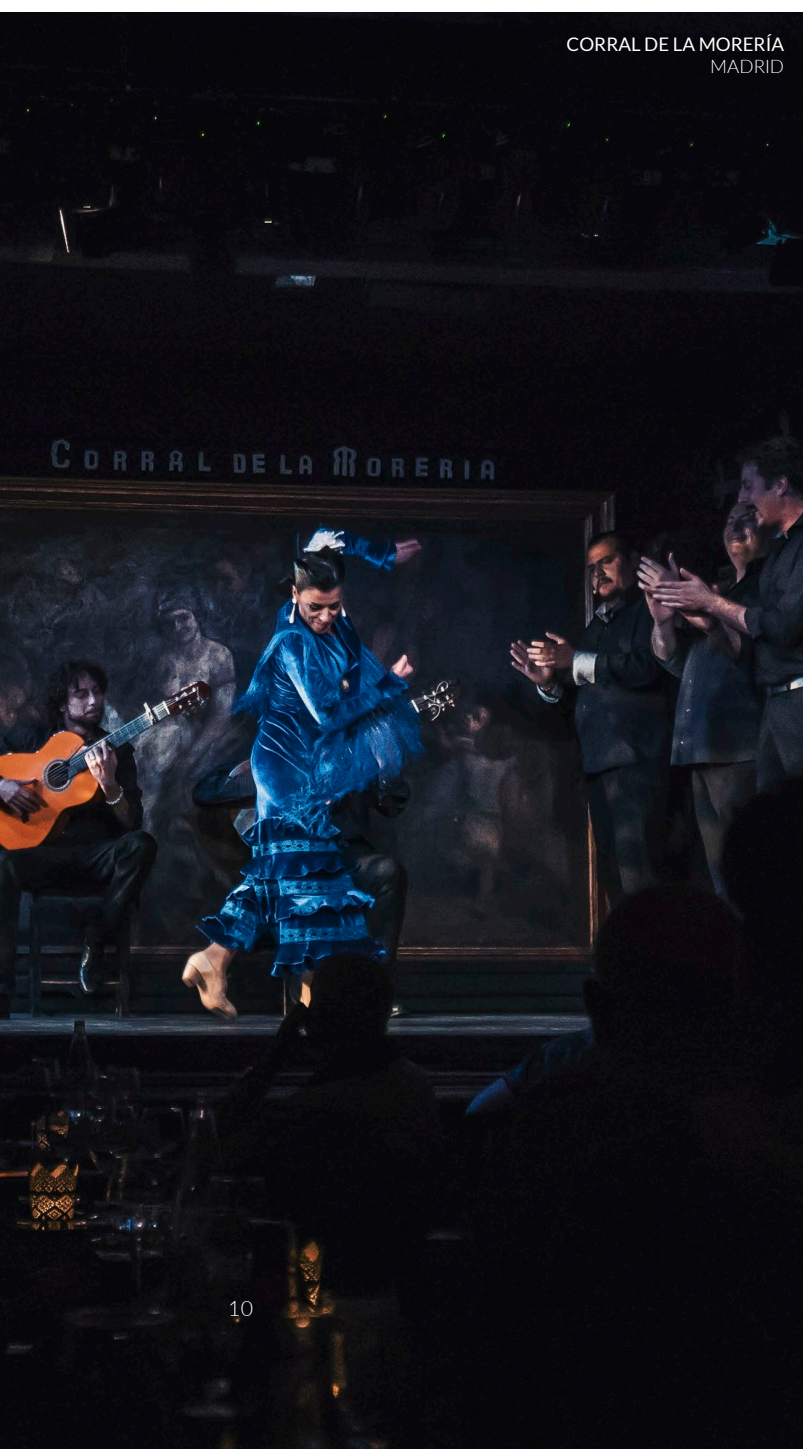
CORRAL DE LA MORERÍA MADRID