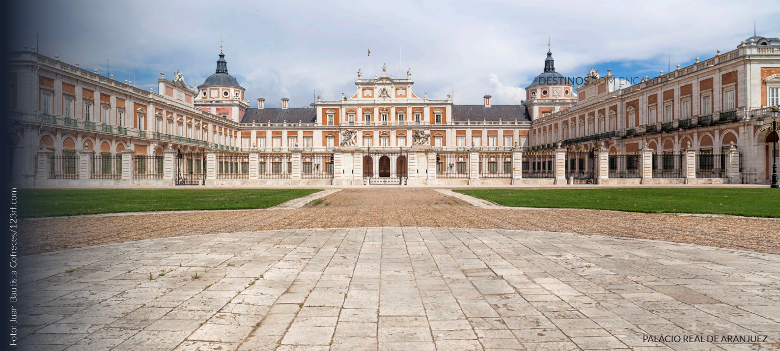
PALÁCIO REAL DE ARANJUEZ