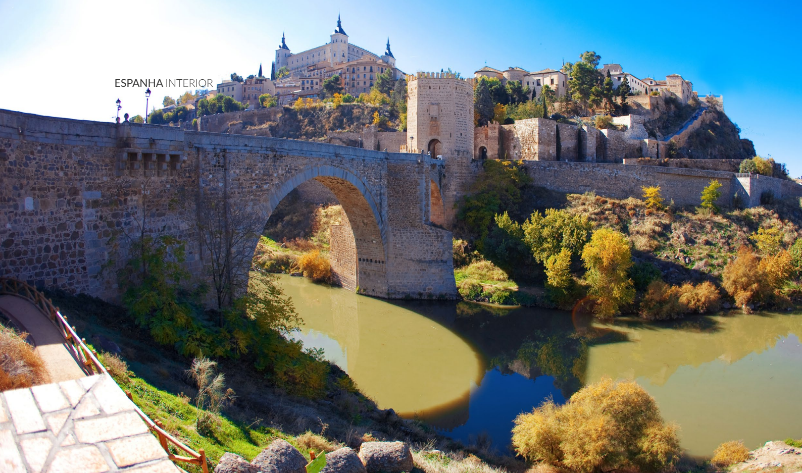
▲ PONTE DE ALCÁNTARA TOLEDO