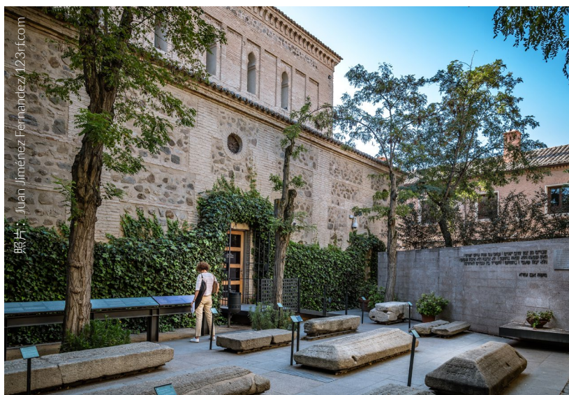
▲ 圣母升天犹太教堂 托莱多

你千万不能错过犹太人之家。据说这里曾属于伊萨克，他曾借钱给伊莎贝拉女王资助哥伦布，最终发现美洲大陆。它的内部有两处值得参观：中庭和曾用于净化灵魂的净身池（miqva）。