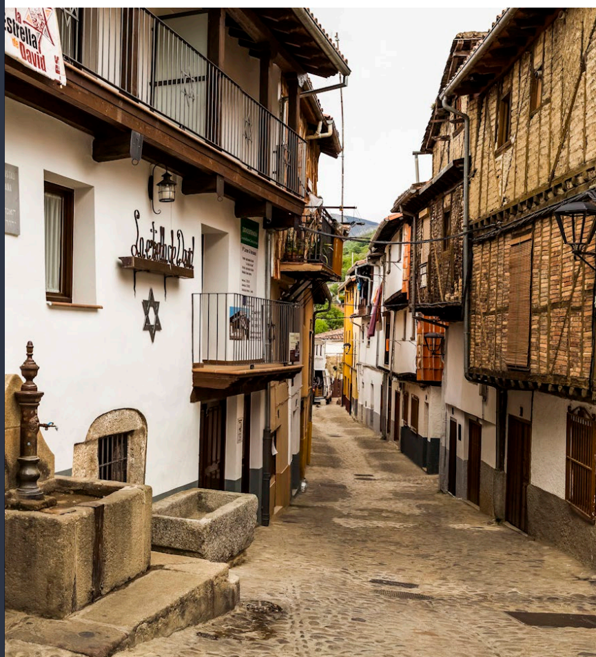
▲ 埃尔瓦斯 卡塞雷斯