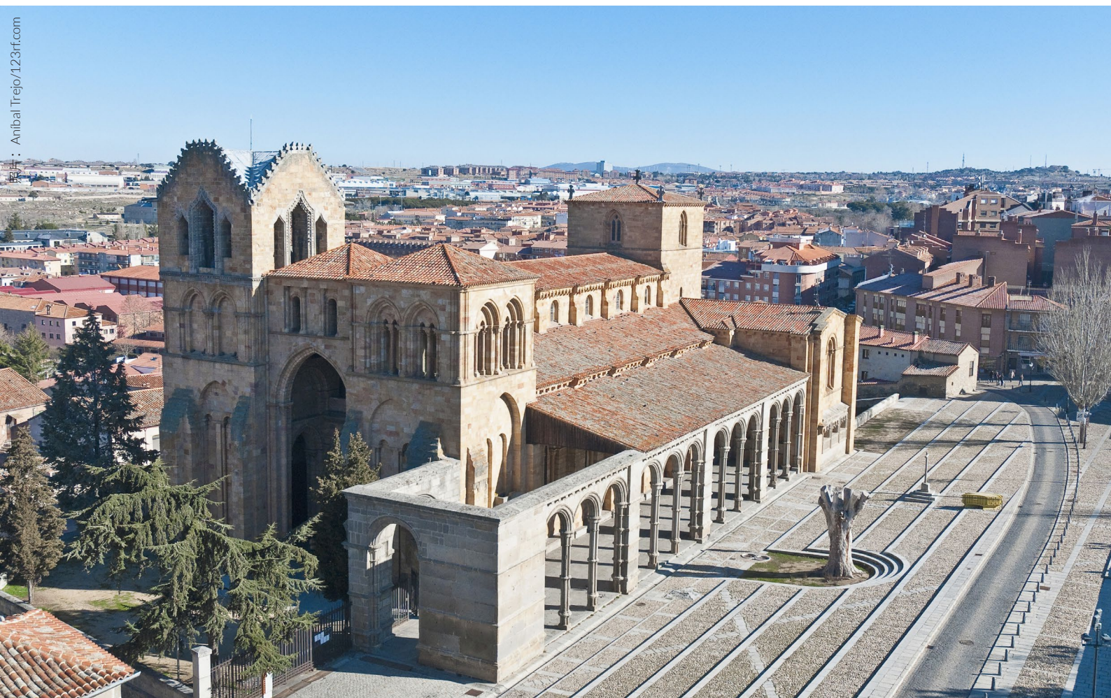
▲ 圣文森特教堂 阿维拉

旅游信息中心拉穆拉雅（La Muralla）位于圣安德列门。从这里出发，你可以游览犹太墓园及其周边，发现至今尚存的考古遗迹。