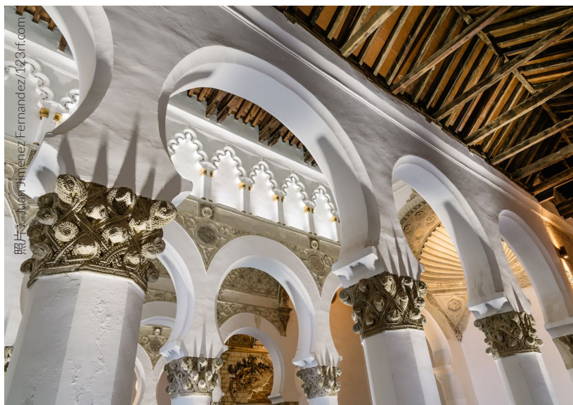
▲ 白色圣母犹太教堂 托莱多

在塞法迪博物馆的北庭院中有一个永久建筑——声音花园——这里重现托莱多犹太聚居区老巷生活的声音。你可以听到拉迪诺语（西班牙的犹太人被逐出半岛之前使用的语言），还有被塞法迪旋律环绕的街巷杂声，置身于此，仿佛穿越到了中世纪时期的托莱多犹太聚居区。