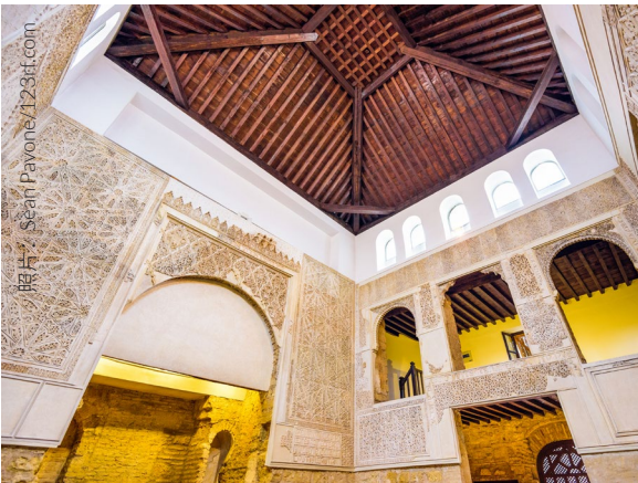
▲ 犹太会堂 科尔多瓦

科尔多瓦犹太会堂是在安达卢西亚的唯一一座犹太会堂，再是西班牙全国保存最好的。建于十四世纪初期，直至1492年都用做教堂使用。如今我们有幸看到它的大部分原貌，要感谢修复和重建工作。