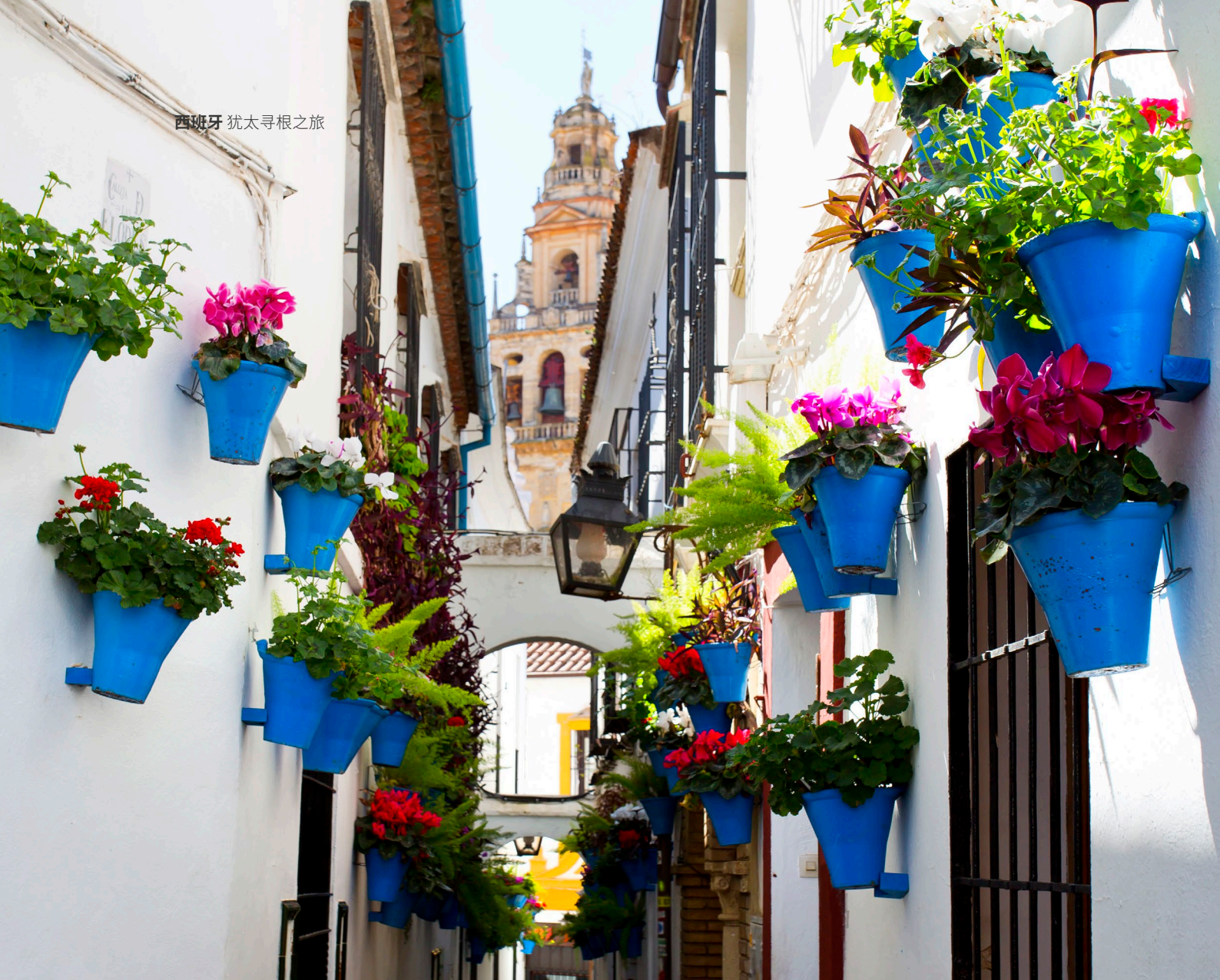
▲ 鲜花装扮的巷子 科尔多瓦