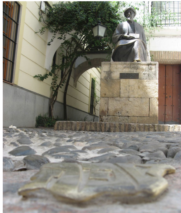
▲ 塞法拉德之家 科尔多瓦

心制作的银器、瓷器和皮具。五月是著名的科尔多瓦庭院开放日（Festival de los Patios Cordobeses），这个节日被列为人类非物质文化遗产。在拱廊庭院中，人们进行具有弗拉门戈特色的深歌的表演。