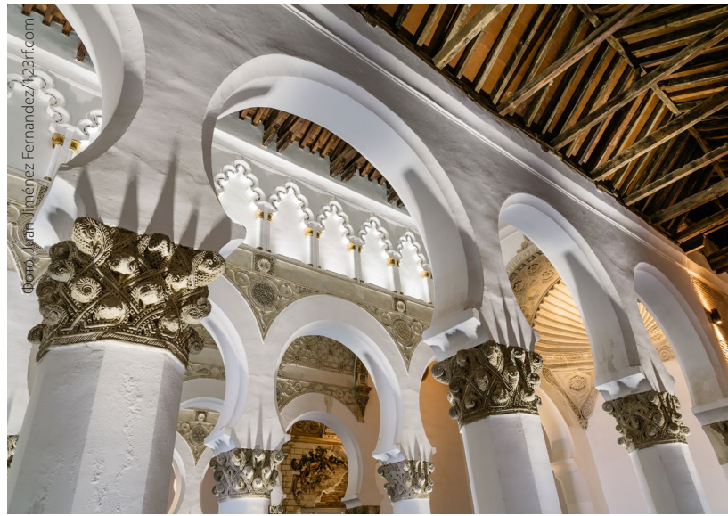
▲ СИНАГОГА САНТА-МАРИЯ ЛА БЛАНКА ТОЛЕДО

В северном внутреннем дворе Музея сефардов находится постоянная инсталляция Сад звуков , которая воспроизводит звуки улочек старинного еврейского квартала Толедо. Голоса на ладино (языке, на котором говорили испанские евреи до того, как были изгнаны с полуострова) и звуки улиц в сопровождении сефардской мелодии заставят вас почувствовать, будто вы прогуливаетесь по средневековому еврейскому кварталу Толедо.