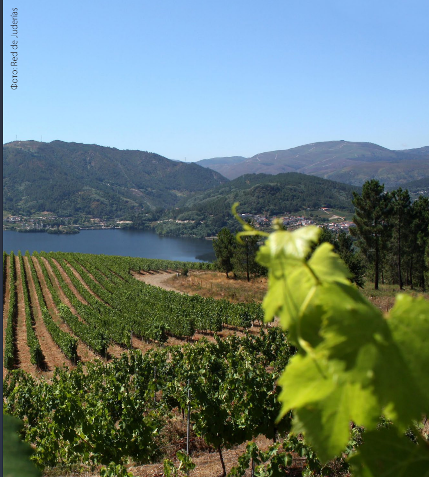
▲ ВИНОГРАДНИК В РИБАДАВИИ ОРЕНСЕ

Организация «Сеть еврейских кварталов» продвигает различные проекты, которые знакомят вас с сутью традиций сефардов на полуострове.