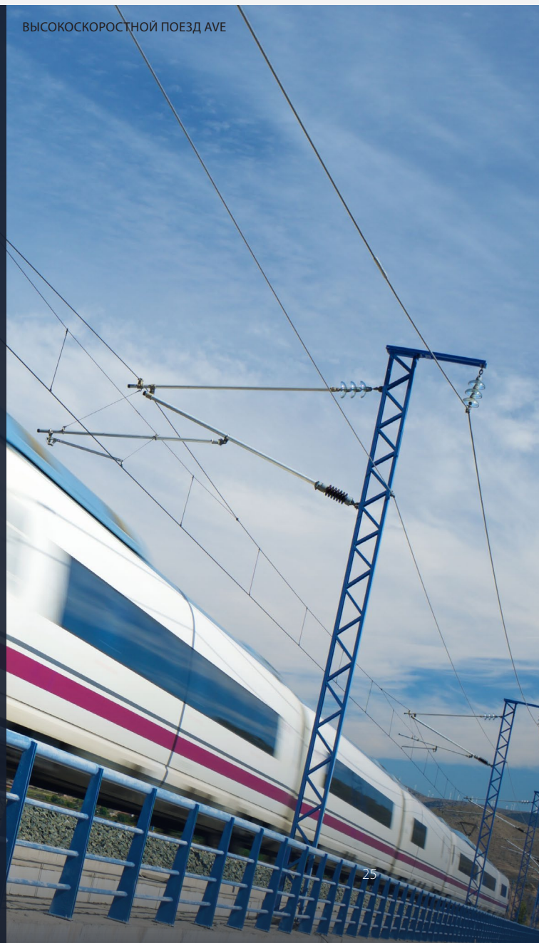
ВЫСОКОСКОРОСТНОЙ ПОЕЗД AVE

❶ Приобрести абонемент и получить дополнительную информацию можно на сайтах www.interrail.eu и www.eurail.com