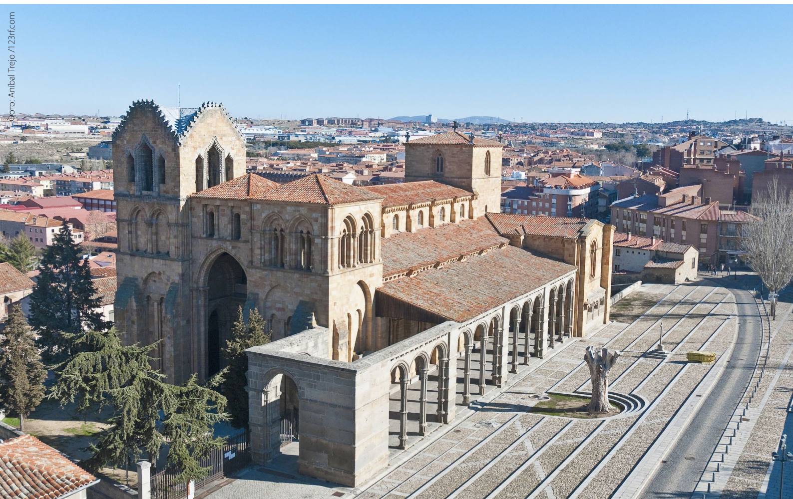
▲ БАЗИЛИКА СВЯТОГО ВИКЕНТИЯ АВИЛА

Уворот Пуэрта-де-Сан-Андрес находится пункт туристической информации Ла-Муралья. Здесь можно насладиться идеальным видом на окрестности и еврейское кладбище, где сохранились остатки захоронений невероятной археологической ценности.