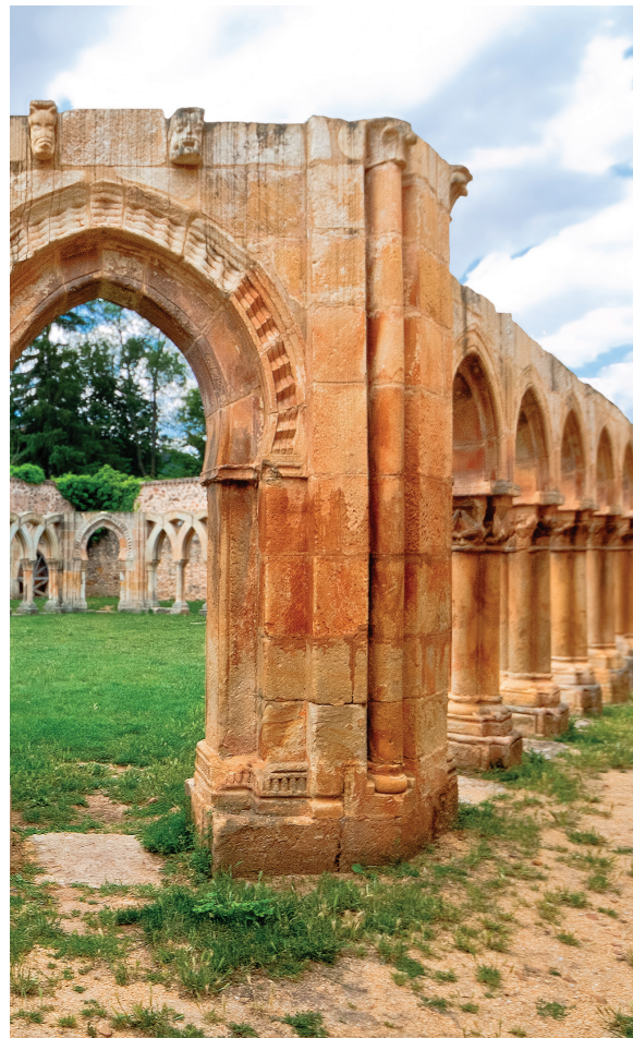
▲ サン・フアン・デル・ドゥエロ修道院の回廊 ソリア

中世カトリック建築を代表する建築物です。回廊を飾るアーチには、ロマネスク様式やゴシック様式、イスラム様式といった当時の建築様式の縮図を見取することができます。