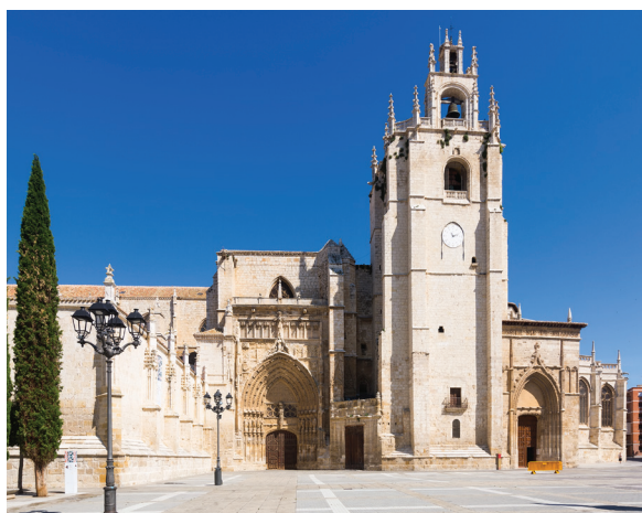
▲ パレンシアの大聖堂

スペインは秘宝に満ちています。素晴らしい文化的価値を秘める10のスポットを訪ねましょう。