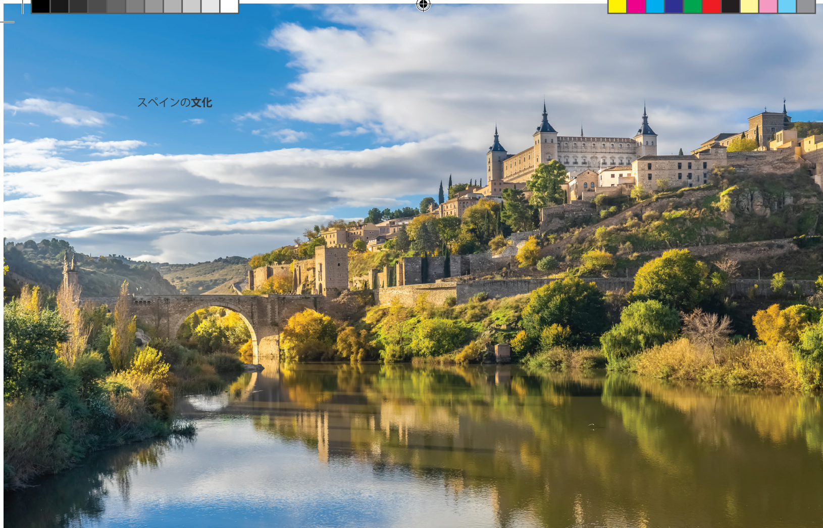
▲ エル・アルカサル トレド