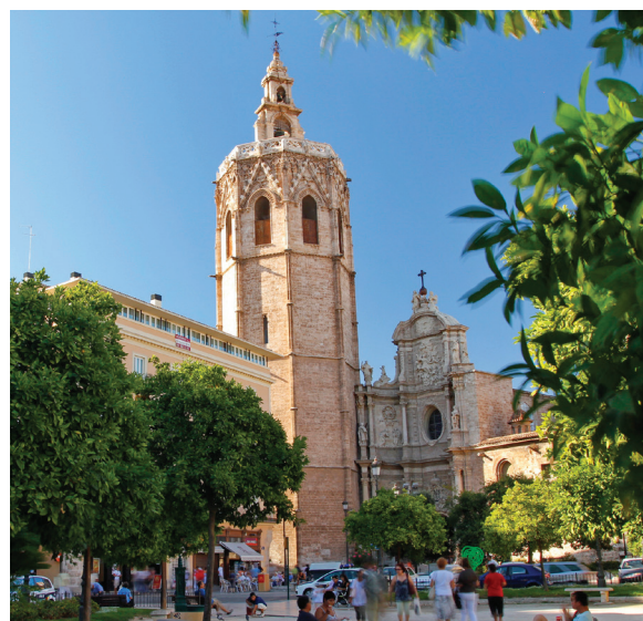
▲ ミゲレテの塔 バレンシア

科学と文化の普及を目的としてつくられたヨーロッパ最大規模の複合施設、芸術科学都市は是非訪れたいスポットです。目の形をしたシアターであるレミスフェリックや、ヨーロッパ最大の水族館オセアノグラフィックなど、迫力ある前衛建築に目を奪われることでしょう。