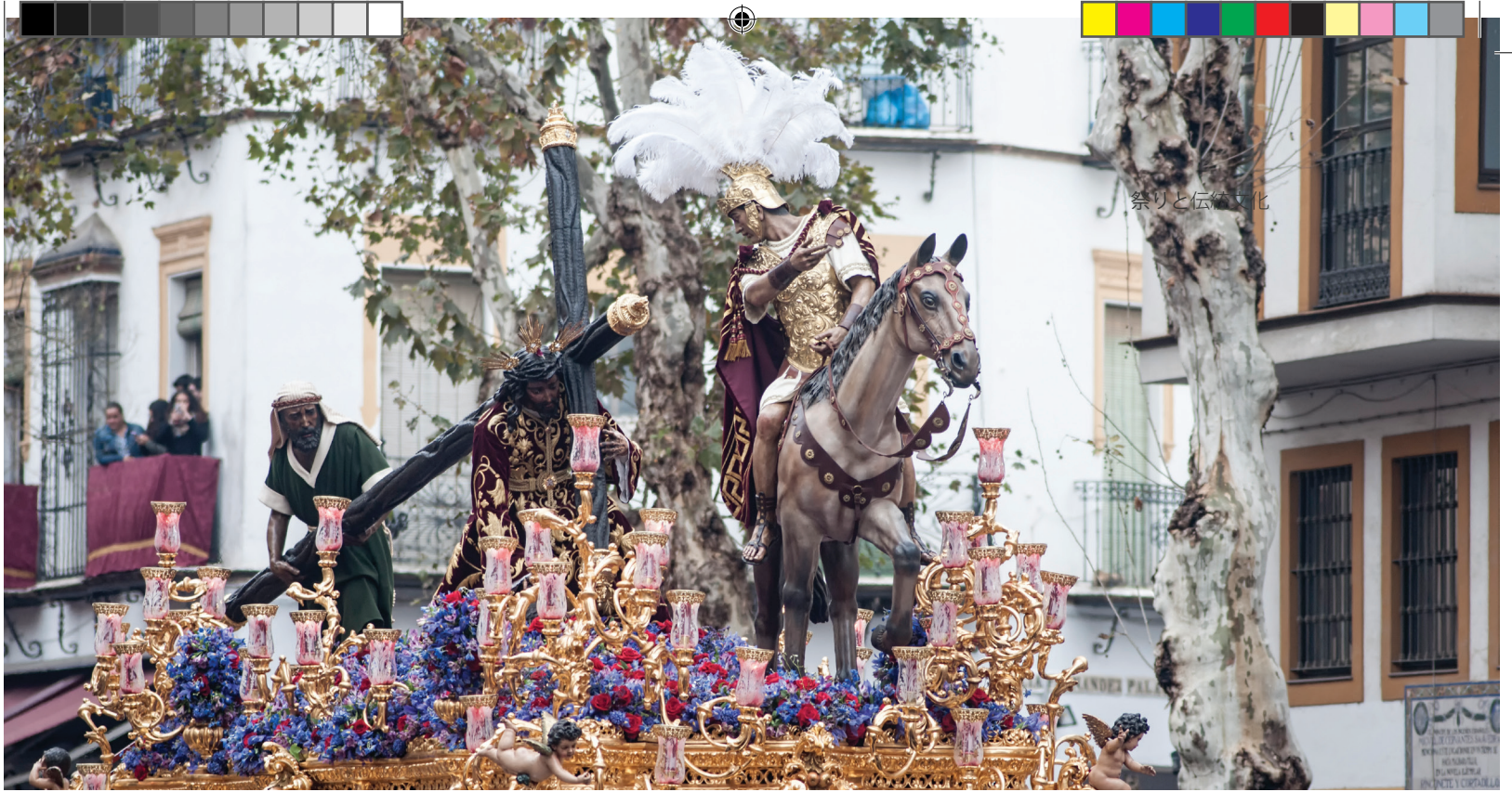
▲ セビージャのセマナ・サンタ(聖週間)