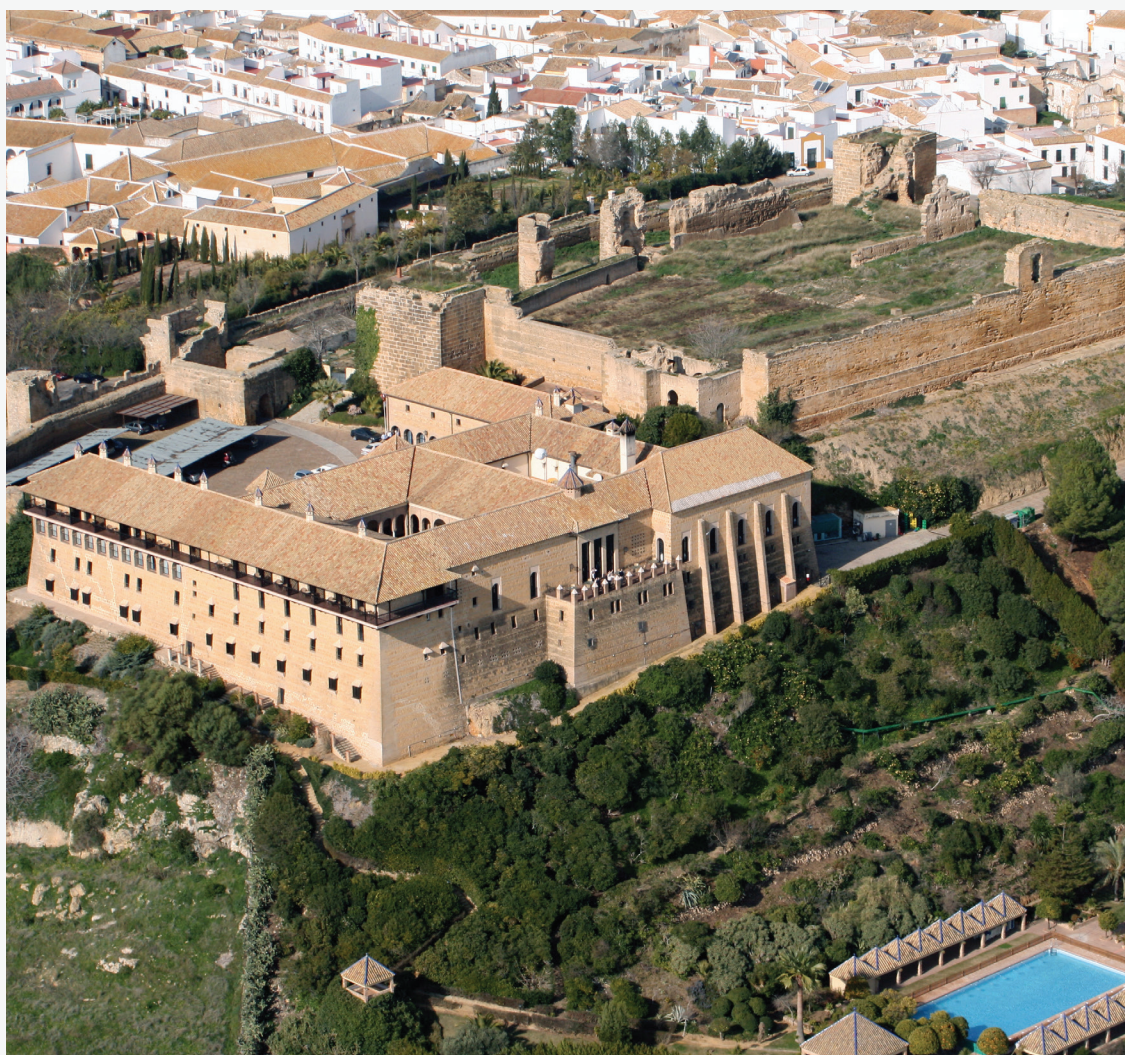
▲ カルモナのパラドール セビージャ県