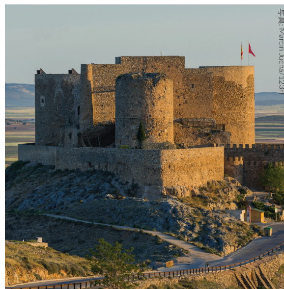
▲ コンスエグラ城 トレド

トレド近郊にもタラベラ・デ・ラ・レイナやオカーニャ、オロペサといった数々の歴史的建造物を抱える町があります。