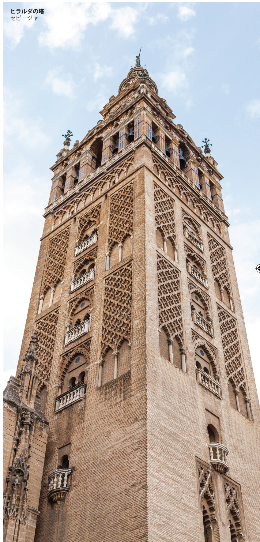
ヒラルダの塔 セビージャ

セビージャ近郊を巡るなら、カルモナや、オスナ、コンスタンティーナ、エシハへ足を延ばしてみるのもよいかもしれません。また、コルドバは必見の観光スポットです。絵画のような風景が広がる歴史地区を歩いたり、イスラム芸術の傑作であるこの街の至宝メスキータ大聖堂を見学しましょう。カディスでは、カーニバルを楽しんだり、迷路のように細く入り組んだ路地や、小さな広場が美しい旧市街を散策することができます。