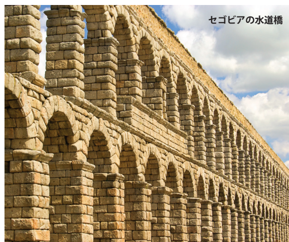
セゴビアの水道橋