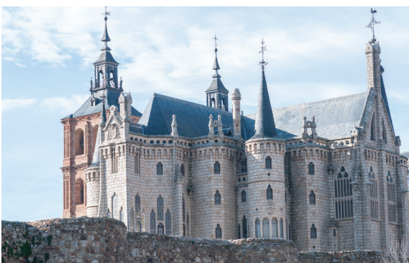
▲ 司教館 アストルガ

のこぎり壁や展望台、建物を取り囲む堀を前にすると、まるでおとぎ話に出てくる城に入城するかような気分になるでしょう。新ゴシック様式を取り入れたモデルニスモ建築は天才建築家ガウディの作品で、現在はサンティアゴ巡礼路博物館の本部が置かれています。