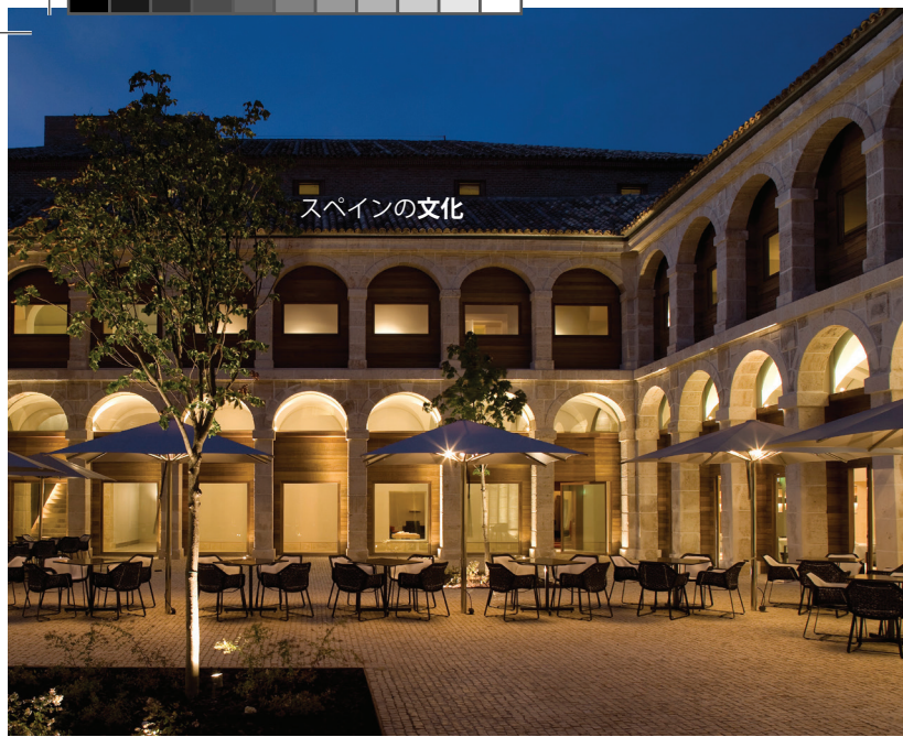
▲ アルカラ・デ・エナーレスのパラドール マドリッド州