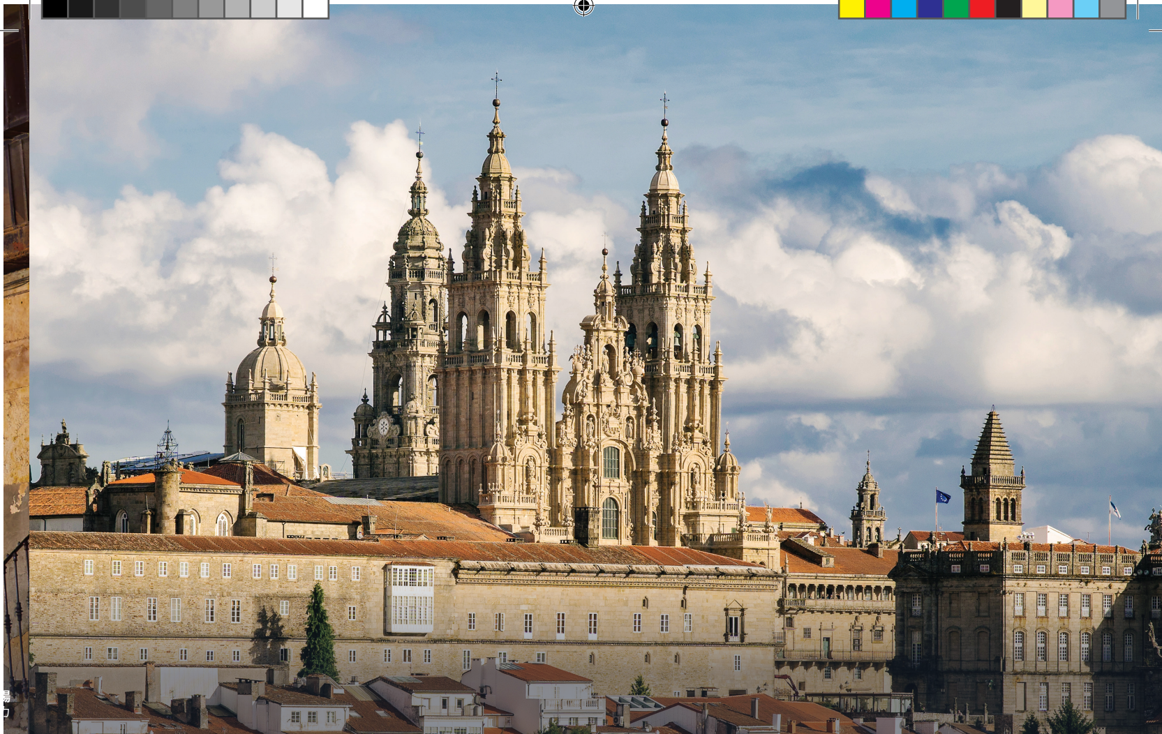
▶ サンティアゴの大聖堂 サンティアゴ・デ・コンポステーラ