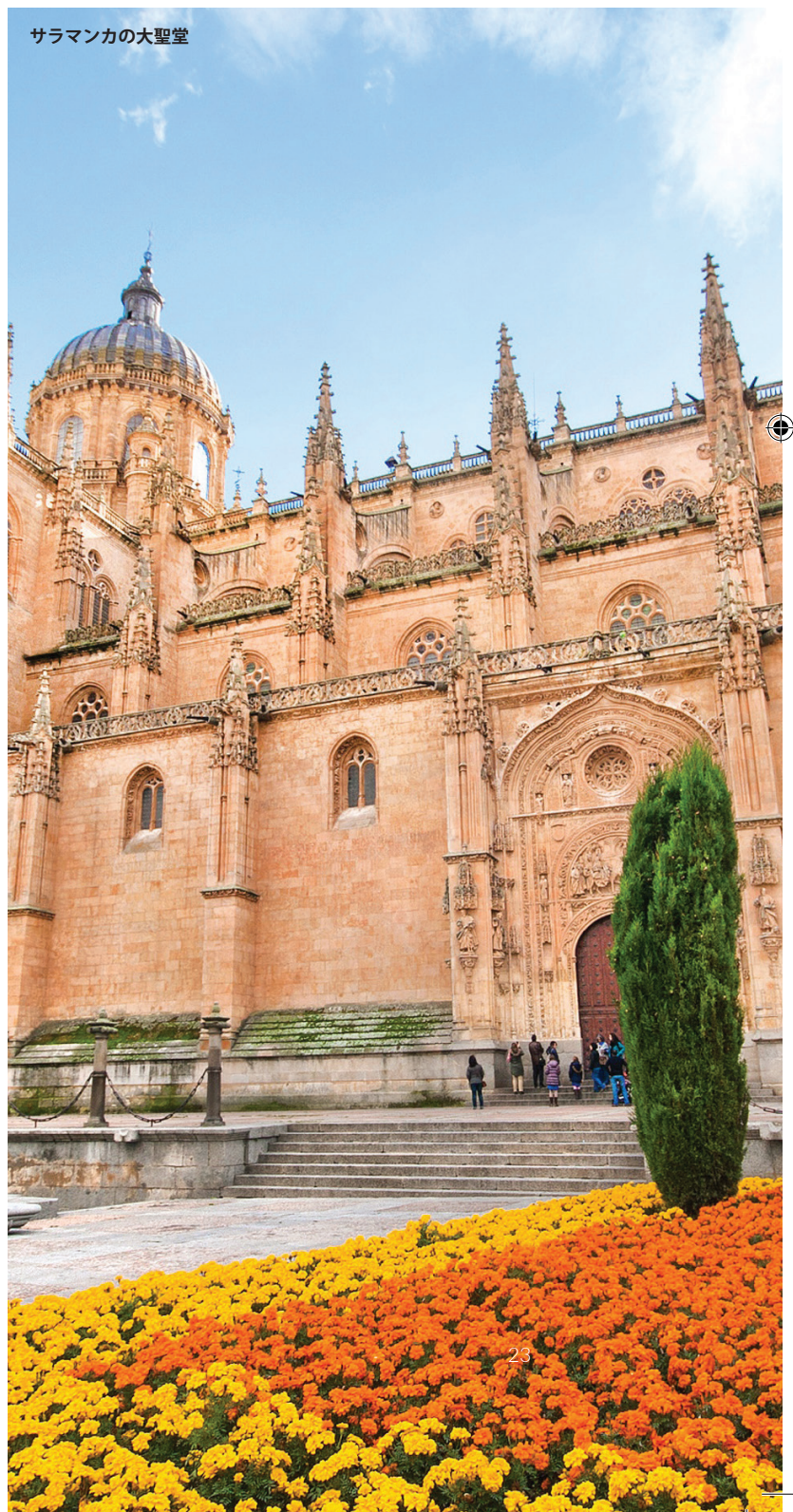
サラマンカの大聖堂

カナリア諸島のテネリフェ島に位置する色彩豊かな街では、ひと昔前へタイムスリップしたかのような感覚を味わうことができます。壮観な大聖堂や、17世紀から18世紀にかけて建てられた数々の邸宅が、典型的なコロニアル風の街並みに溶け込んでいます。