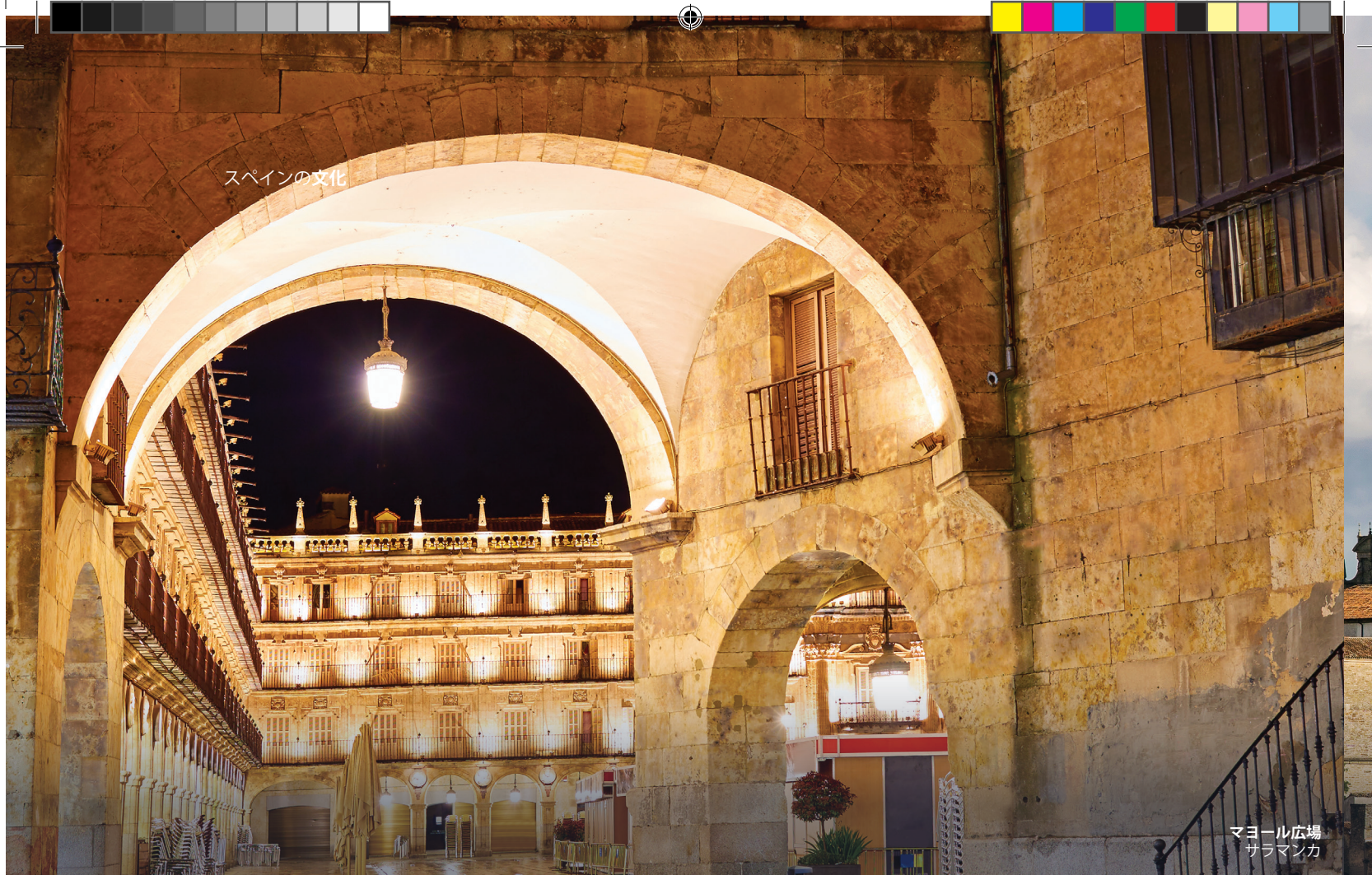
マヨール広場 サラマンカ