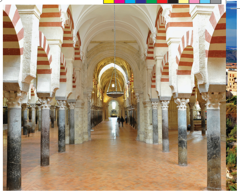
▲ コルドバのメスキータ内部