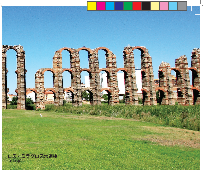
ロス・ミラグロス水道橋 メリダ