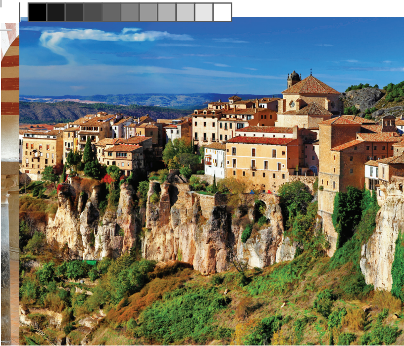
▲ 宙つりの家 クエンカ