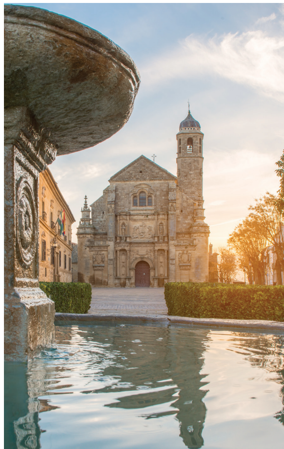
▲ サルバドル教会 ウベダ (ハエン県)

バレアレス諸島のイビサ島の市街地はユネスコの世界遺産に登録されており、ダルト・ヴィラの愛称で親しまれています。旧市街を取り囲むルネッサンス様式の城壁は、16世紀オスマン帝国からの攻撃に備えて街を守るために建設されました。