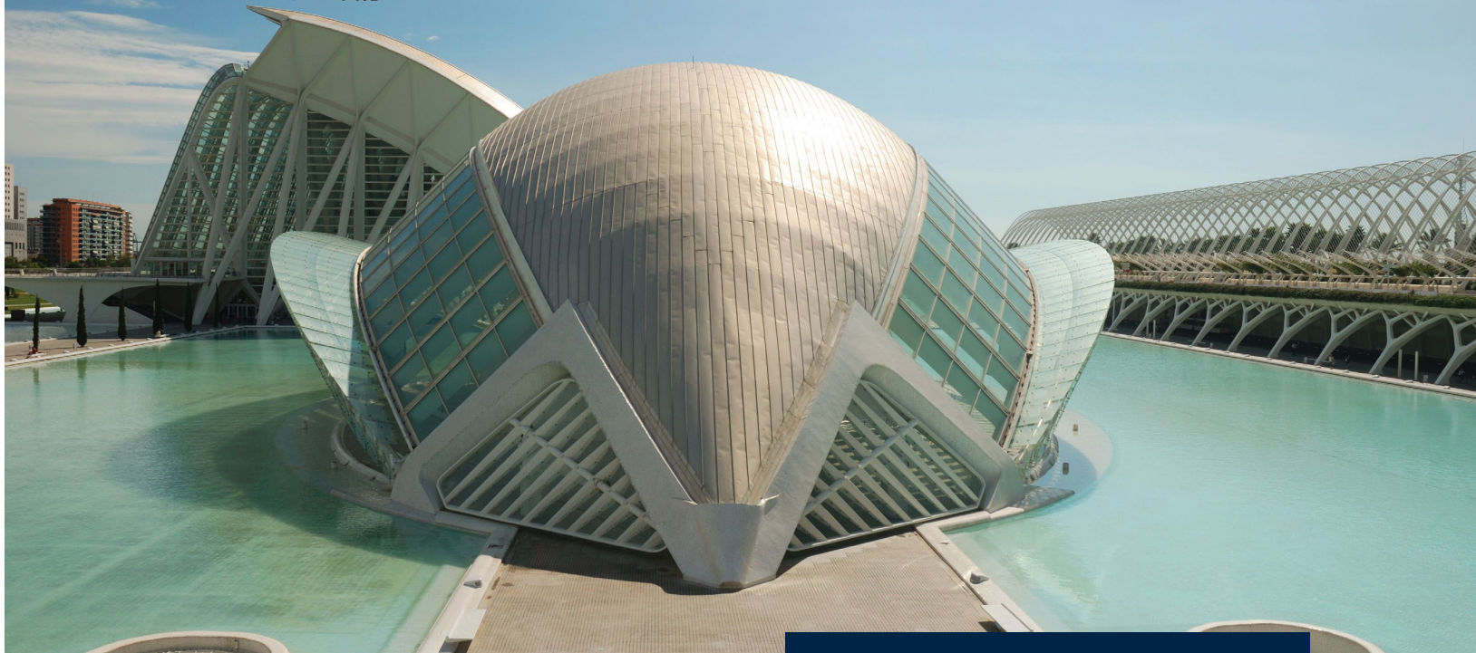
▲ 芸術科学都市 バレンシア