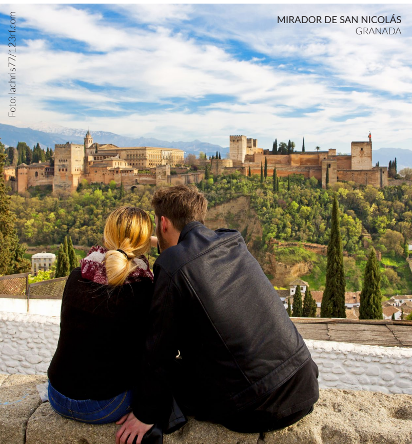
MIRADOR DE SAN NICOLÁS GRANADA

Para apreciar los valores arquitectónicos y paisajísticos de este monumento Patrimonio Mundial por la UNESCO, acércate al mirador de San Nicolás en el barrio del Albaicín o al Sacromonte . Desde ellos percibirás la espectacular relación de la Alhambra con el territorio y la ciudad de Granada.