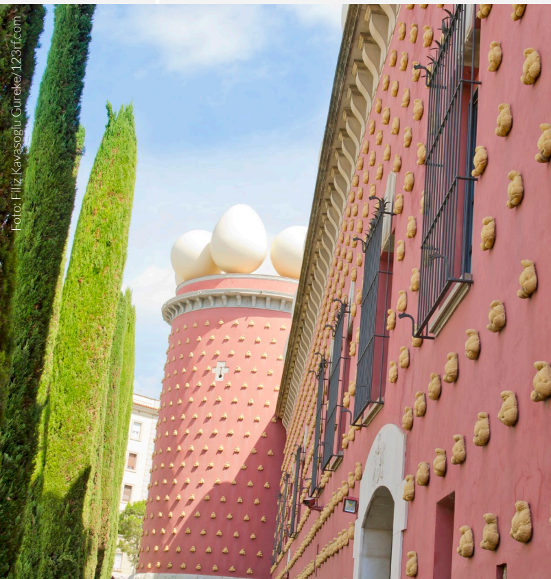
▲ TEATRO-MUSEO DALÍ FIGUERES

En el precioso entorno de Cadaqués se encuentra la pequeña villa marinera de Portlligat, donde puedes visitar la Casa-Museo Dalí , una casita de pescadores en la que el artista vivió durante largos periodos de su vida. Podrás admirar sus herramientas de trabajo en el taller y una zona exterior con abundantes referencias surrealistas.