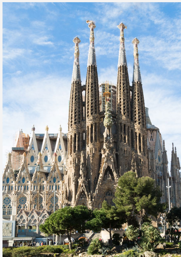
▼ LA SAGRADA FAMILIA BARCELONA

En el corazón de Barcelona se halla la basílica de la Sagrada Familia , icono de la ciudad y máximo exponente del modernismo. Obra del genial arquitecto Antoni Gaudí , lo que más te llamará la atención serán sus torres puntiagudas. Podrás acceder a la parte superior de algunas de ellas para contemplar una bella panorámica de Barcelona desde las alturas.