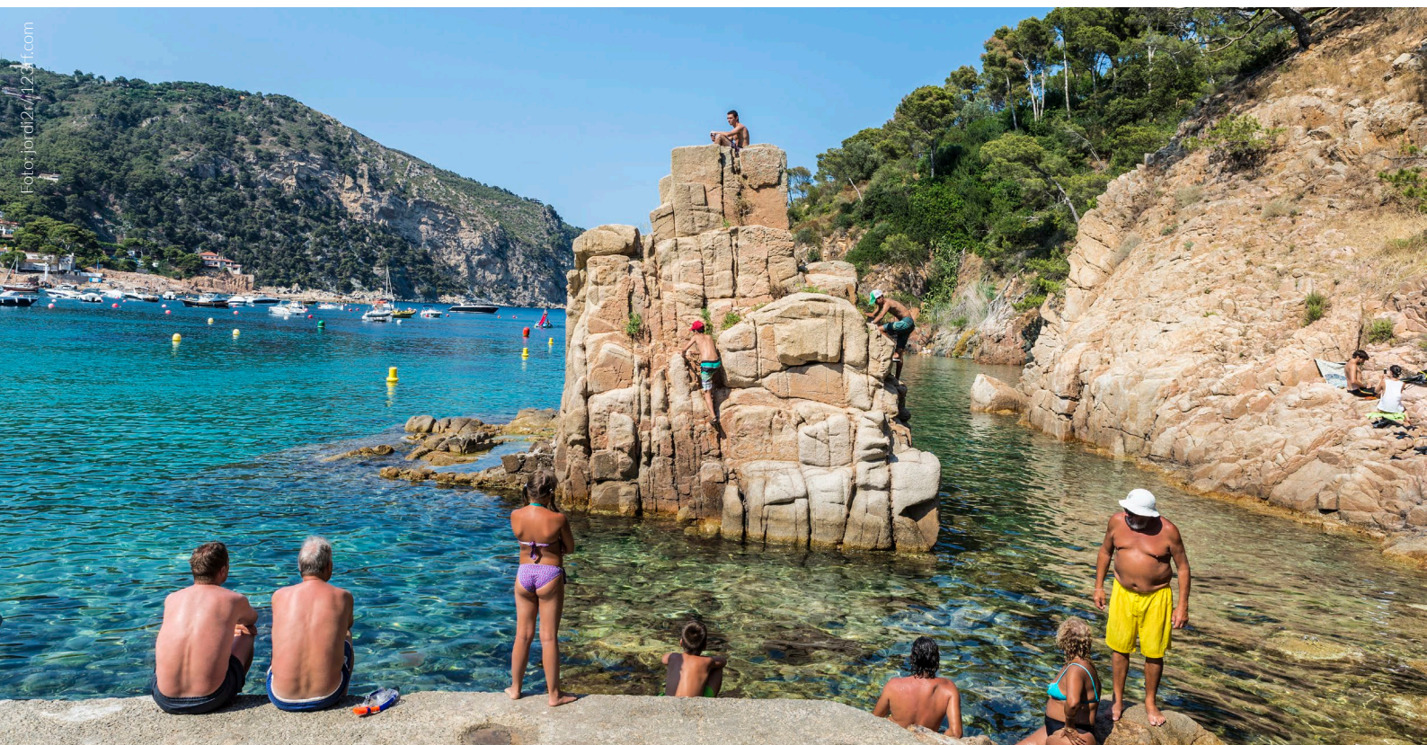
▲ PLAYA DE AIGUABLAVA BEGUR, GIRONA

las escaleras de madera que nos transportan a un mirador fantástico de la bahía de Roses y el casco urbano de L'Escala. Muy cerca de la playa se hallan también las ruinas greco-romanas de Empúries , uno de los yacimientos arqueológicos más importantes de España.