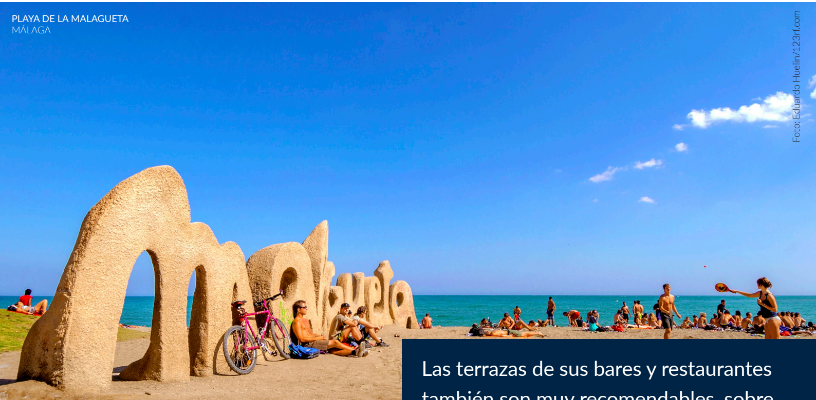
PLAYA DE LA MALAGUETA MÁLAGA

Las terrazas de sus bares y restaurantes también son muy recomendables, sobre todo al atardecer, cuando podrás gozar de una puesta de sol inolvidable.