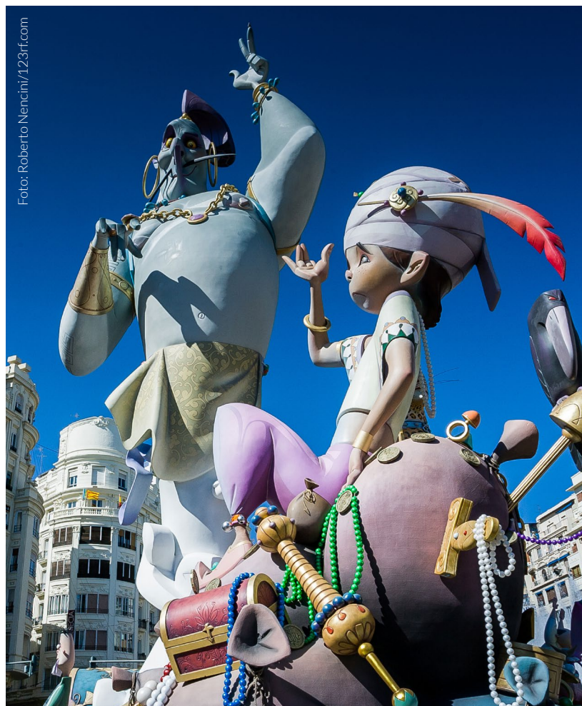
▲ LAS FALLAS VALENCIA

A pocos pasos de allí visita El Miguelete , como se conoce al campanario de la catedral de Valencia. Desde sus 50 metros de altura se divisa una impresionante panorámica de la ciudad.