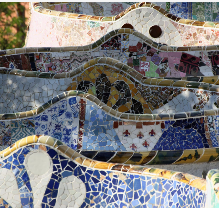
▲ PARK GÜELL BARCELONA

Recorre el pasado histórico de la ciudad en el Barrio Gótico . Sus calles estrechas y construcciones medievales te transportarán en el tiempo. Admira los palacios del Ayuntamiento y de la Generalitat , la catedral de Barcelona o la basílica gótica de Santa María del Pi .