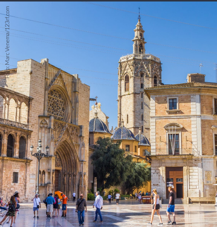
▲ CATEDRAL DE VALENCIA VALENCIA