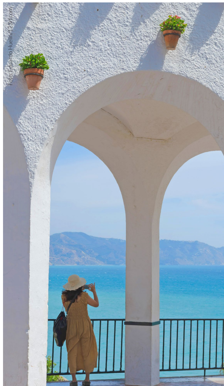
▲ BALCÓN DE EUROPA NERJA, MÁLAGA

Bajo el Balcón de Europa , una plaza circular sobre el mar que se ha convertido en el lugar más emblemático de