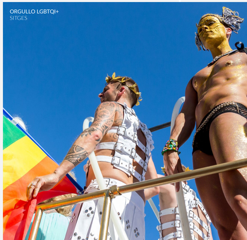
ORGULLO LGBTQI+ SITGES

El Sitges Pride (Barcelona) se ha convertido en toda una referencia dentro de las celebraciones del Orgullo en España. Asiste a multitud de actuaciones y fiestas temáticas en discotecas de la ciudad y a su gran desfile reivindicativo, y disfruta del color y el ambiente festivo que se vive en la ciudad en esos días de junio.