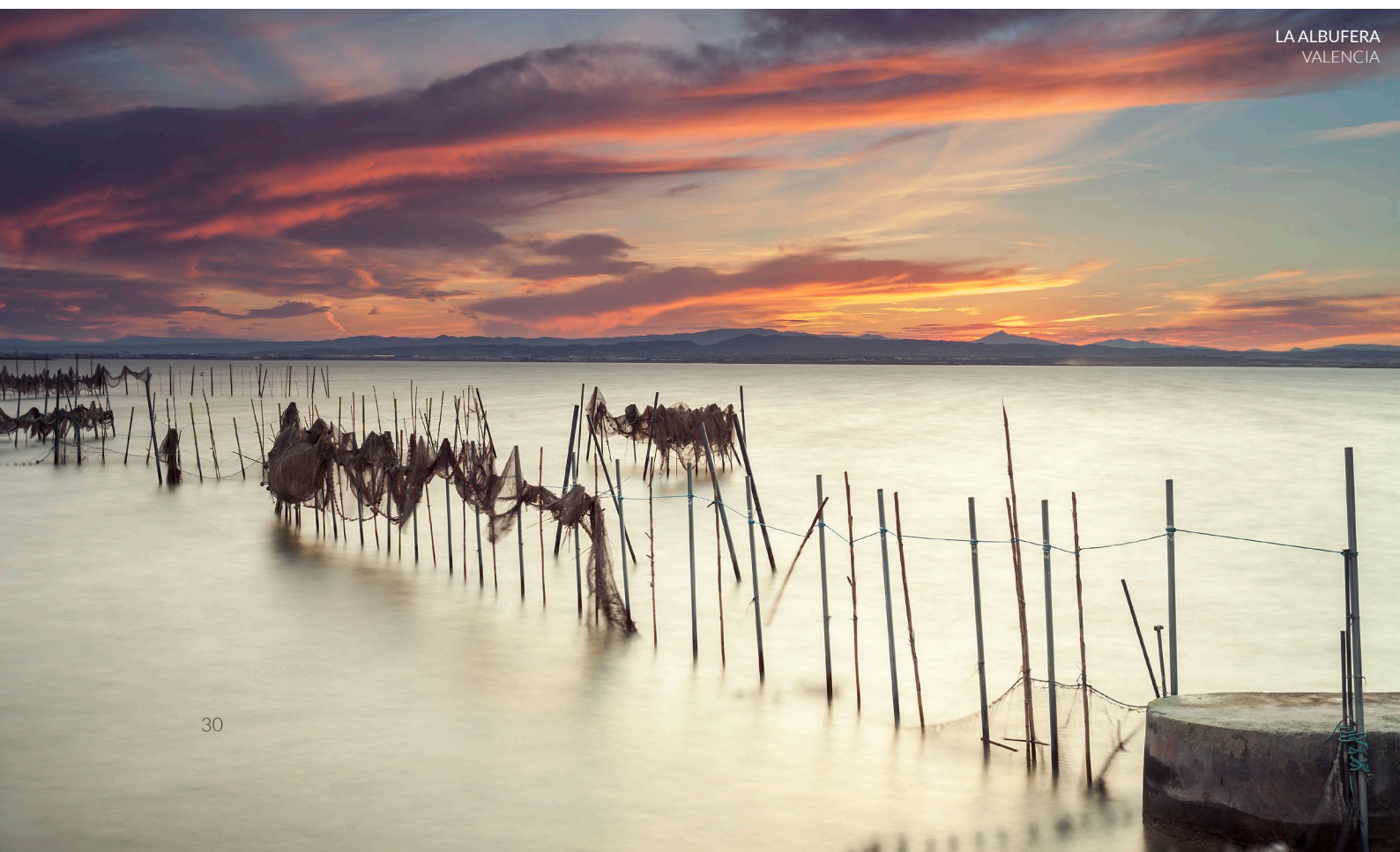
LA ALBUFERA VALENCIA

Si te gusta la observación de aves, el humedal más importante de la región de Murcia te está esperando. A finales de julio, miles de flamencos se concentran en la zona y tiñen de rosa este espectacular paisaje. Un breve recorrido al amanecer en las salinas, un paseo a pie por los senderos señalizados o un terapéutico baño de lodo son experiencias muy saludables en un entorno tranquilo y privilegiado.