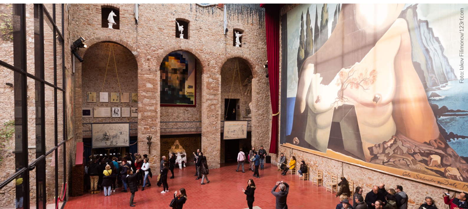
▲ TEATRO-MUSEO DALÍ FIGUERES

Además de playa y buen tiempo, en toda la costa mediterránea y las poblaciones cercanas disfrutarás de grandes paseos por la historia y la cultura de España. El casco histórico de las ciudades, las fiestas tradicionales y los museos y monumentos te acercarán a la verdadera esencia del Mediterráneo. Aquí te ofrecemos algunas ideas para disfrutar de tu estancia.