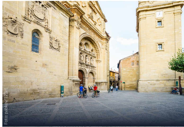
▲ SANTO DOMINGO DE LA CALZADA LA RIOJA

En la Comunidad de Aragón , recorrerás bosques y praderas de ensueño y admirarás lugares llenos de magia como la Estación de Canfranc y el fuerte del Coll de Ladrones , en Huesca. En esta misma provincia, en el pueblo de Villanúa , puedes hacer un alto para visitar la Cueva de las Güixas antes llegar a Jaca , una capital de comarca donde