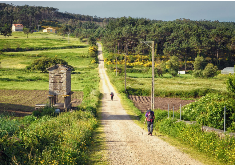
▲ FISTERRA GALICIA

En la Comunidad de Aragón , recorrerás bosques y praderas de ensueño y admirarás lugares llenos de magia como la Estación de Canfranc y el fuerte del Coll de Ladrones , en Huesca. En esta misma provincia, en el pueblo de Villanúa , puedes hacer un alto para visitar la Cueva de las Güixas antes llegar a Jaca , una capital de comarca donde