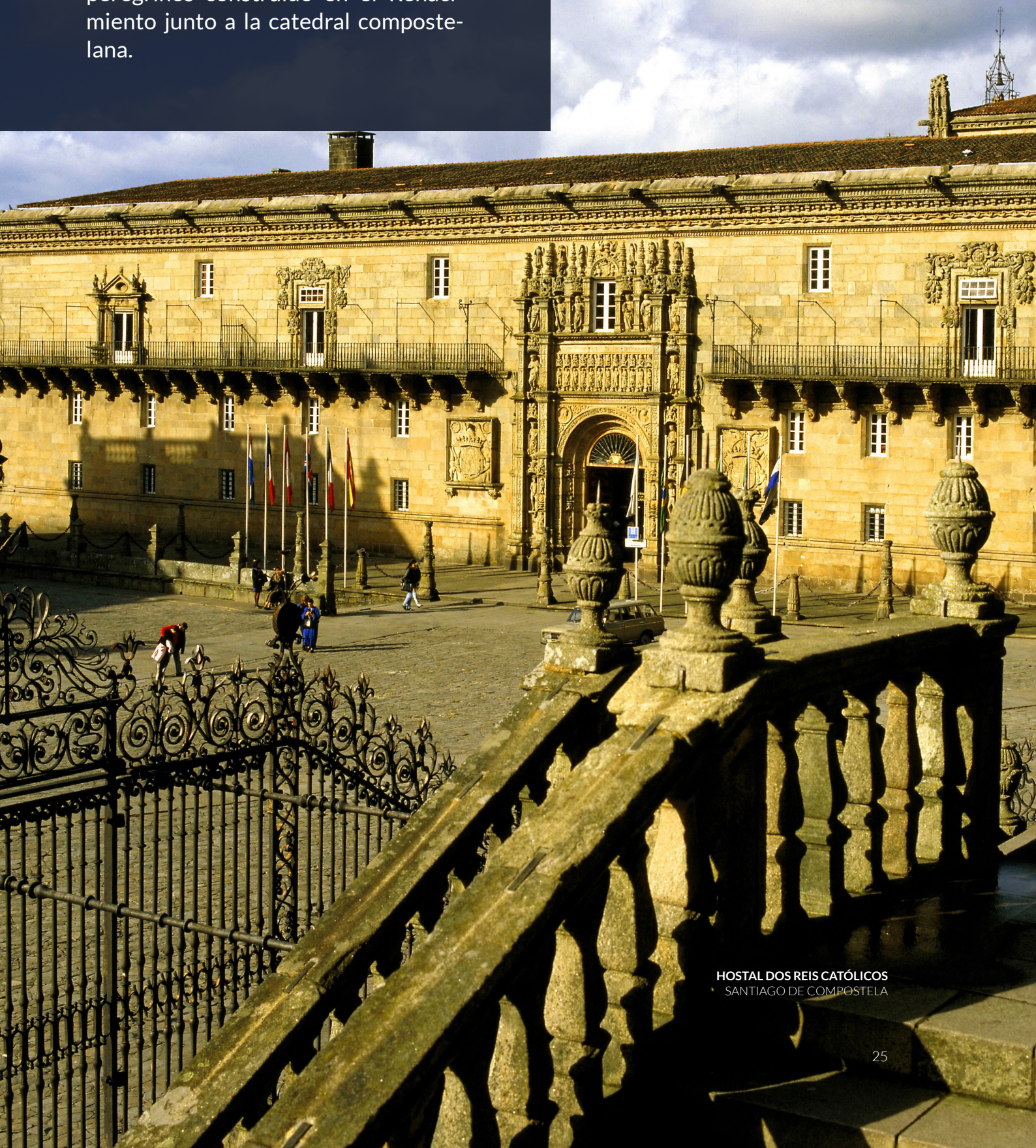
HOSTAL DOS REIS CATÓLICOS SANTIAGO DE COMPOSTELA

En la Vía de la Plata podrás alojarte en un palacio renacentista en Cáceres , en pleno casco histórico declarado Patrimonio Mundial por la UNESCO. Cuando llegues a Santiago de Compostela , culmina tu camino en el Hostal dos Reis Católicos , un bello hospital para peregrinos construido en el Renacimiento junto a la catedral compostelana.