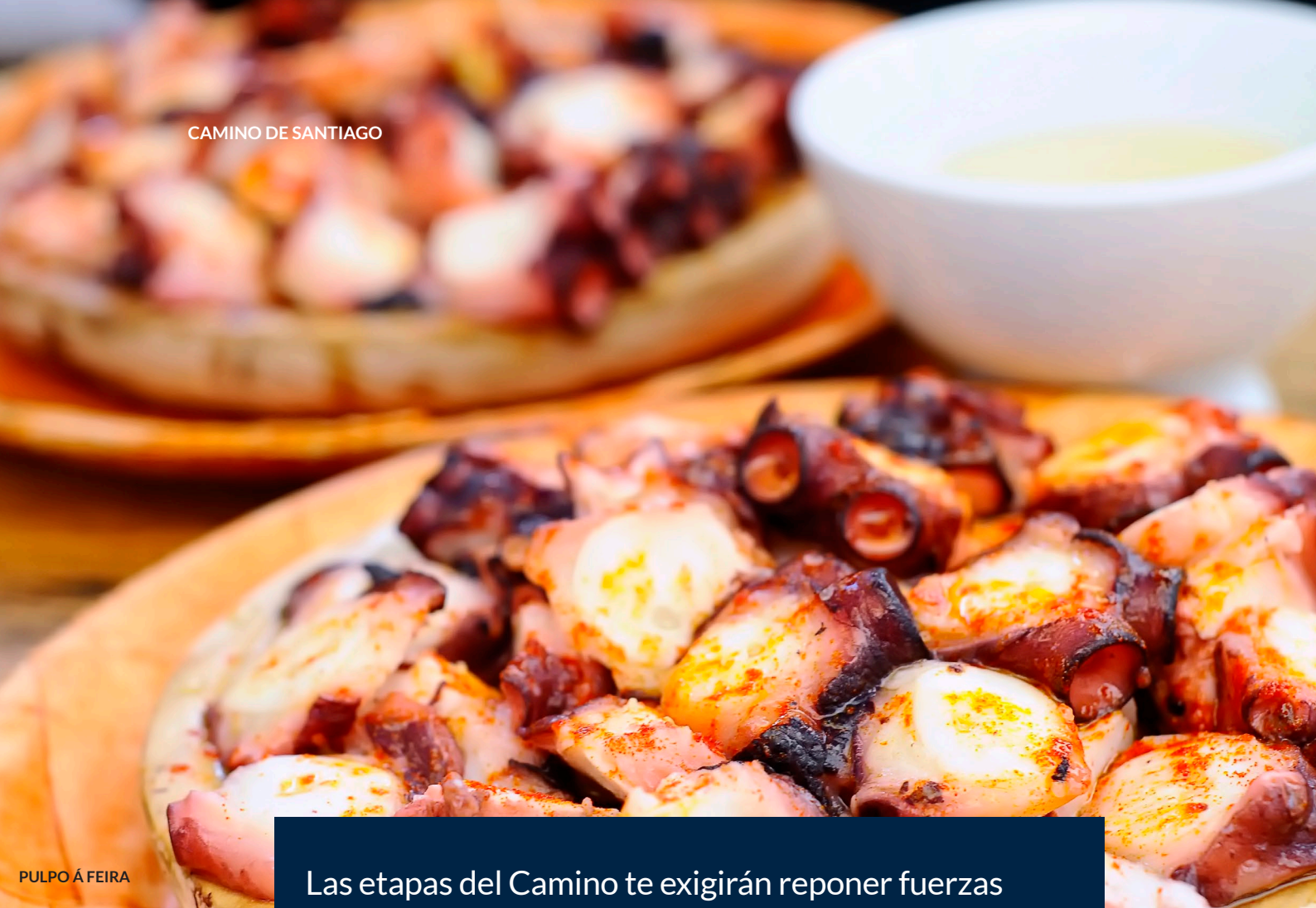
PULPO Á FEIRA

Las etapas del Camino te exigirán reponer fuerzas a diario. Una oportunidad perfecta para disfrutar de la riqueza de las cocinas que te encontrarás a tu paso.