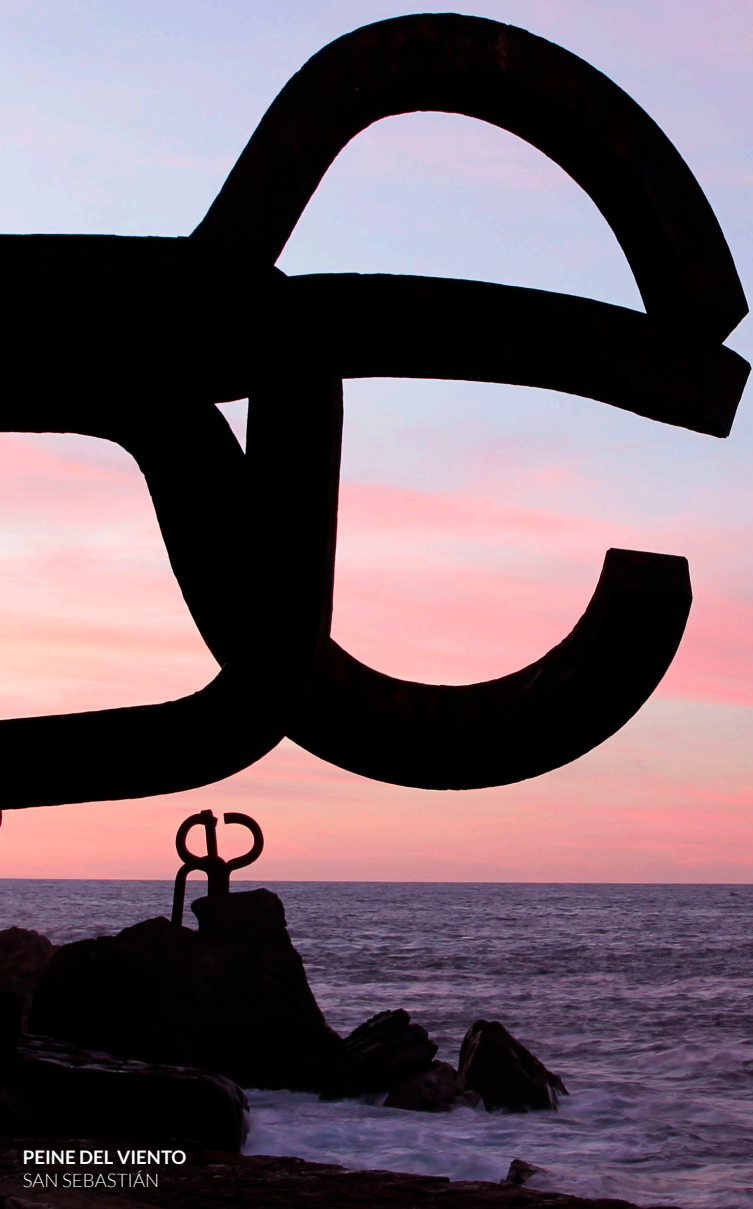
PEINE DEL VIENTO SAN SEBASTIÁN

Si quieres hacerlo entero, la primera etapa de tu viaje será Irún (Euskadi/País Vasco), en la frontera con Francia. Recorrerás la provincia de Guipúzcoa hasta su capital, Donostia/San Sebastián : una bellísima ciudad que se extiende por una bahía de arena blanca entre los montes Urgull e Igeldo . Los caseríos, las mansiones señoriales y sus modernos barrios convierten a esta ciudad en una de las más atractivas del litoral cantábrico. Aquí, visita el Museo de San Telmo , el Peine del Viento y el Kursaal para ver cómo la ciudad aúna en su trazado tradición y modernidad. Y disfruta de su gastronomía: San Sebastián es una de