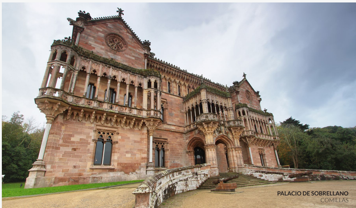
PALACIO DE SOBRELLANO COMILLAS