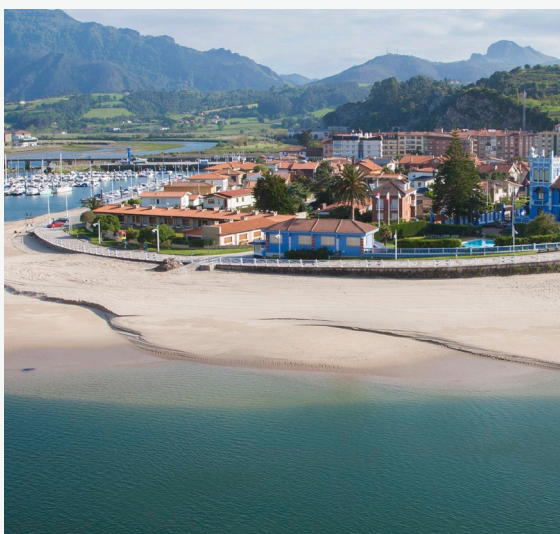
▲ RIBADESELLA ASTURIAS

Siguiendo la cornisa cantábrica, llegarás a Comillas . En sus calles adoquinadas y plazuelas, verás preciosas casonas solariegas. Te encantarán sus torres y edificios de aires modernistas. Visita El Capricho , una construcción de Antoni Gaudí ; el Palacio de Sobre-