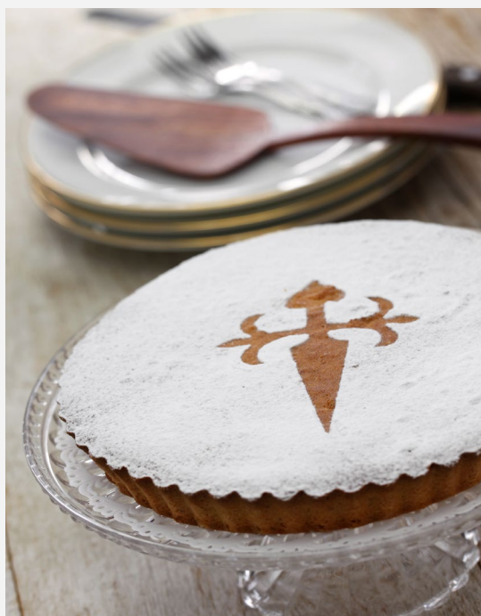
▲ TARTA DE SANTIAGO

En Aragón prueba el pollo al chilindrón, delicioso como las verduras aragonesas con las que se prepara su sofrito. Tanto aquí como en Castilla y León son reconocidos sus asados de lechazo y ternasco que te harán chuparte los dedos. En la zona de León , aparte de la cecina, encontrarás otro embutido único, el botillo. En Cantabria prueba sus guisos reconstituyentes, como son el cocido lebaniego