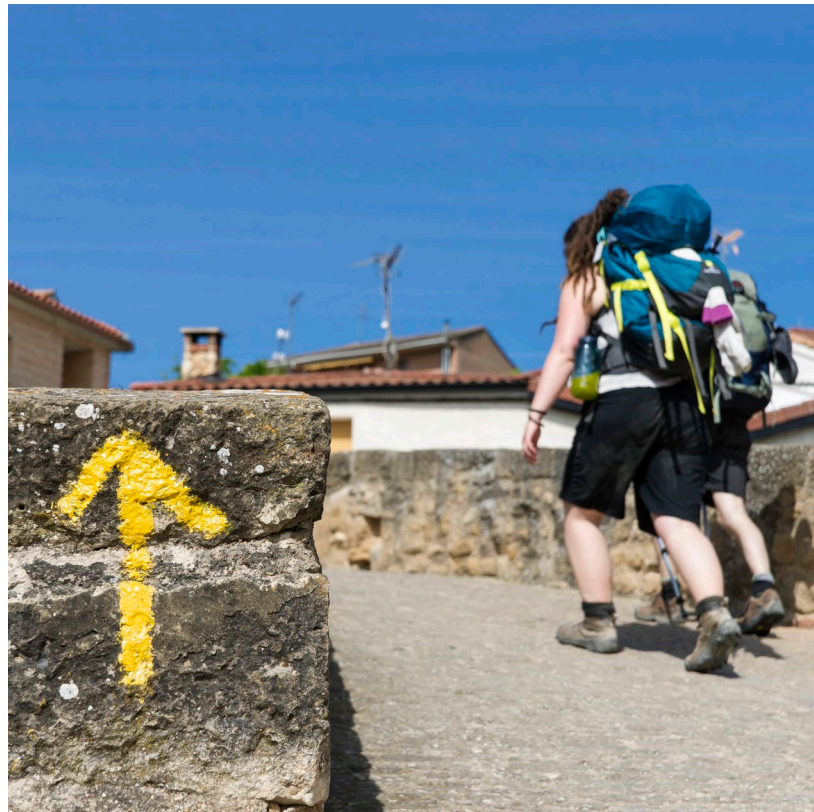
▲ PUENTE DE VILLATUERTA NAVARRA

Si te decides por esta ruta, y quieres hacerla completa, comenzarás tu aventura en los Pirineos y seguirás la cara sur de la Cordillera Cantábrica hasta alcanzar Galicia . Elige como punto de partida Roncesvalles (Navarra) o Somport (Aragón). Los dos trazados confluyen al llegar a Puente la Reina (Navarra). Prepárate para ver bellos parajes y disfrutar de una gastronomía excepcional en tu ruta.