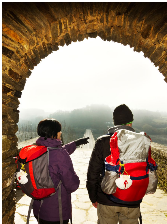
▲ PORTOMARÍN LUGO

Tu viaje entrará en su fase final por las colinas de la verde Galicia. Riachuelos, bosques y praderas forman el paisaje de esta tierra llena de magia y misterio. Aquí, descubrirás el legado de los antiguos pobladores celtas y disfrutarás de la afamada cocina gallega. Prueba su re-