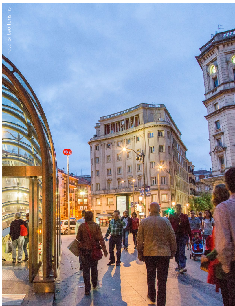
▼ PLAZA CIRCULAR