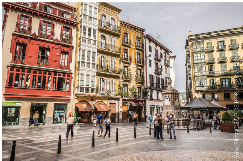
▲ CENTRO STORICO

Potrai passeggiare su ampie strade dal tracciato a scacchiera che confluiscono in punti come piazza Circular. Qui si trova il monumentale edificio della Sociedad Bilbaína , una costruzione di ispirazione eclettica con raffinate finiture interne in stile inglese, sede del club più selezionato ed esclusivo di Bilbao. Avanzando lungo via Buenos Aires, attraversa la ría per raggiungere il Palazzo Comunale , la cui facciata principale è decorata da imponenti sculture.