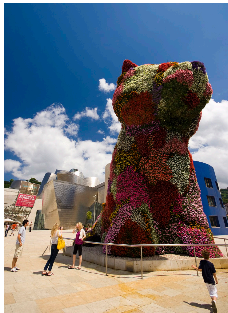
▼ MUSEO GUGGENHEIM DI BILBAO

L'11 ottobre, festa della Nuestra Señora de Begoña, si commemora con processioni, concerti, attività per bambini, danza e sport rurali baschi. Da piazza di Unamuno parte una scalinata storica detta Calzadas de Mallona , che porta