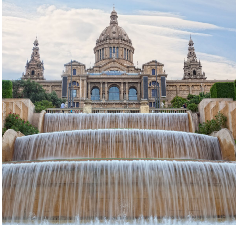
▲ НАЦИОНАЛЬНЫЙ ДВОРЕЦ НА ХОЛМЕ МОНЖУИК

У подножья горы Монжуик находится площадь Испании , на которую выходят некоторые из самых оживленных улиц, такие как проспект Параллель и проспект Гран-Виа . Недалеко отсюда находится парк