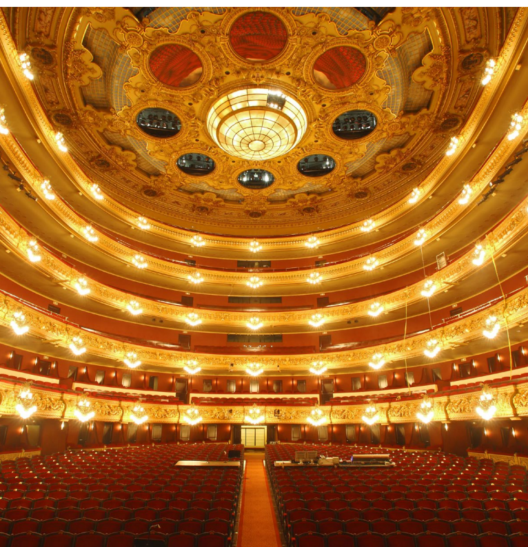
▼ БОЛЬШОЙ ТЕАТР ЛИСЕО