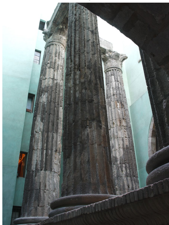
▲ ХРАМ АВГУСТА

Мария-дель-Мар и романский монастырь Сан-Педро-де-лас-Пуэльяс .