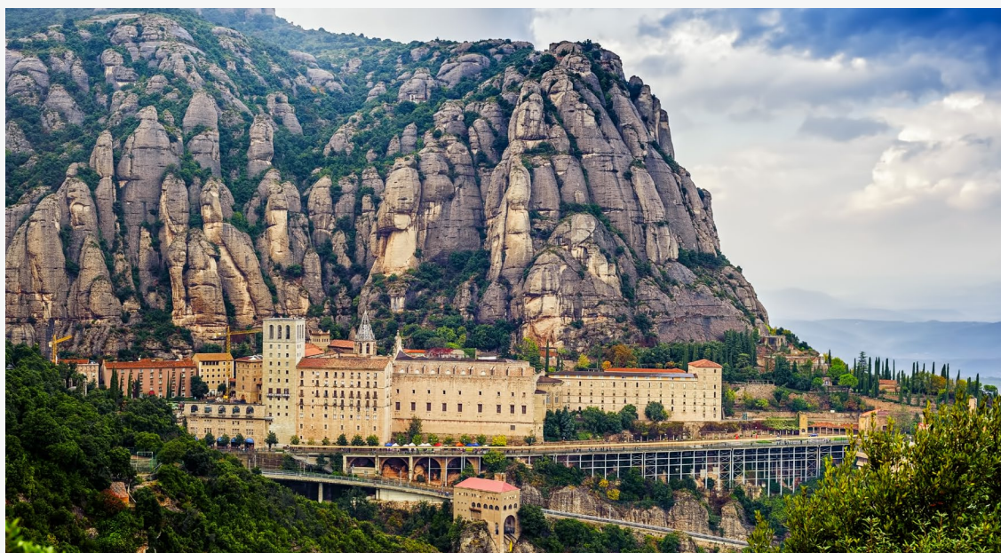
▲ МОНАСТЫРЬ МОНСЕРРАТ

Чуть более 20 минут езды отделяют вас от Сиджеса — живописного городка. Посетите его улицы и пляжи, которые послужили вдохновением для целого поколения каталонских деятелей искусства конца XIX века.