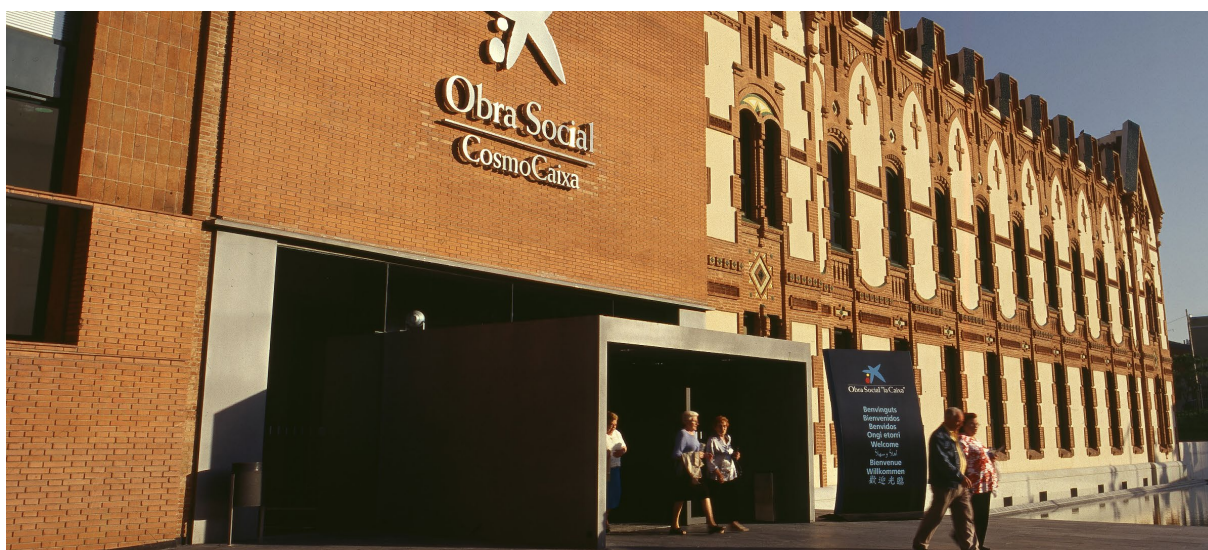
▲ КУЛЬТУРНЫЙ ЦЕНТР CAIXAFORUM

В Барселоне также немало других самых разнообразных тематических музеев, таких как Каталонский музей археологии, Морской музей и Музей истории Барселоны.