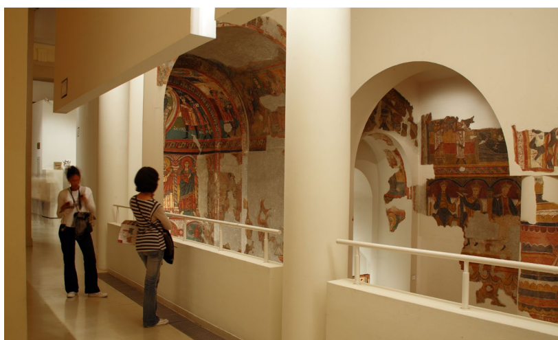
▲ ИНТЕРЬЕР НАЦИОНАЛЬНОГО МУЗЕЯ ИСКУССТВА КАТАЛОНИИ (МНАС)

Культурный центр CaixaForum: посетите один из самых престижных культурных центров Испании. Здесь вы сможете побывать на выставках, конференциях и развлекательных мероприятиях для всей семьи.