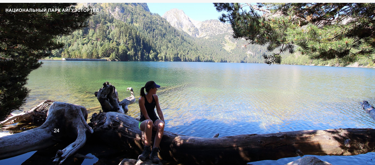
НАЦИОНАЛЬНЫЙ ПАРК АЙГУЭСТОРТЕС

Природный парк Кади-Мошери между провинциями Барселона, Жирона и Льейда идеален для того, чтобы исследовать его пешком, верхом или на велосипеде. Ещё одно место неповторимой красоты — природный парк вулканической зоны Ла-Гарроча в Жироне: познакомьтесь с ним, и вы будете потрясены одним из лучших примеров вулканических пейзажей в Испании.