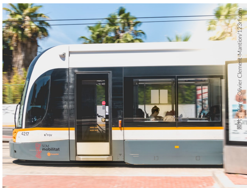
▲ 有轨电车 瓦伦西亚

① 欲了解更多信息，请访问 www.studyinspain.info 和 www.spain.info