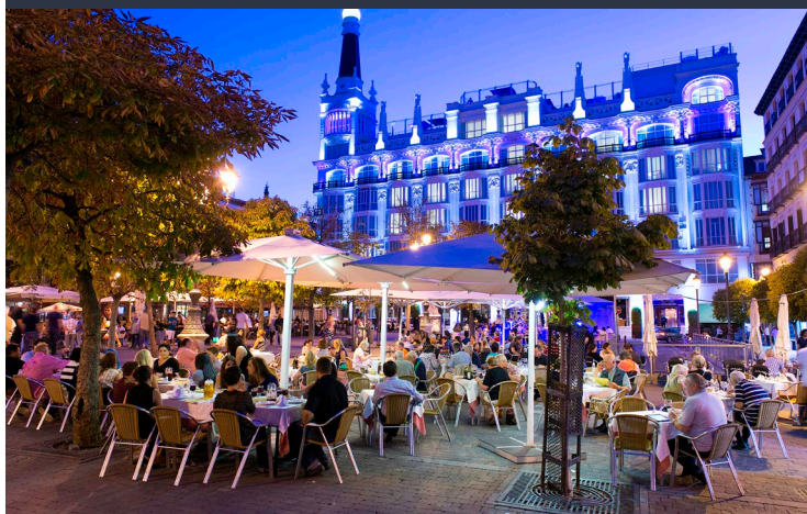
▲ 圣安娜广场 马德里