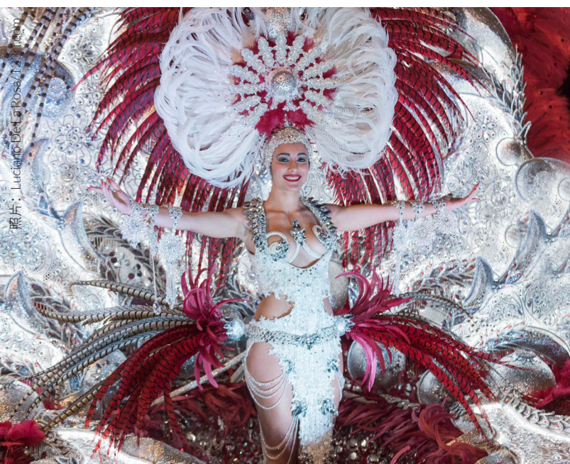
▲ 特内里费岛的狂欢节