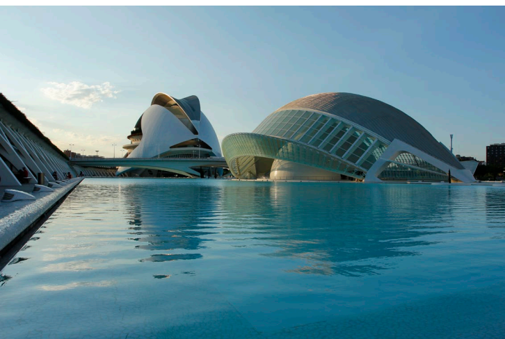
▲ 科学艺术城 瓦伦西亚