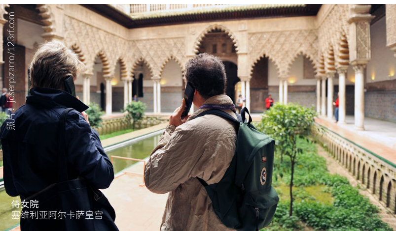
侍女院 塞维利亚阿尔卡萨皇宫

畅游间仿佛回到过去，品尝美食并了解当地的大众节庆。你可以选择骑马、骑车或步行来完成这场冒险之旅。