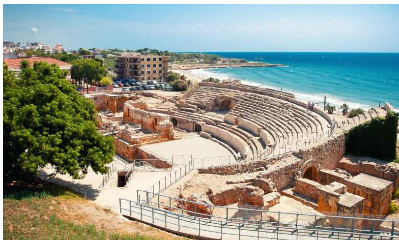
▲ 古罗马圆形竞技场 塔拉戈纳

瓦伦西亚是座对比鲜明的城市，是地中海岸毋庸置疑的核心。在这里，你既可以在其古老的古城区畅游，也可以让前卫的建筑给你带去惊喜。作为欧洲最大的科学与文化传播中心，科学艺术城绝对会让你赞不绝口。