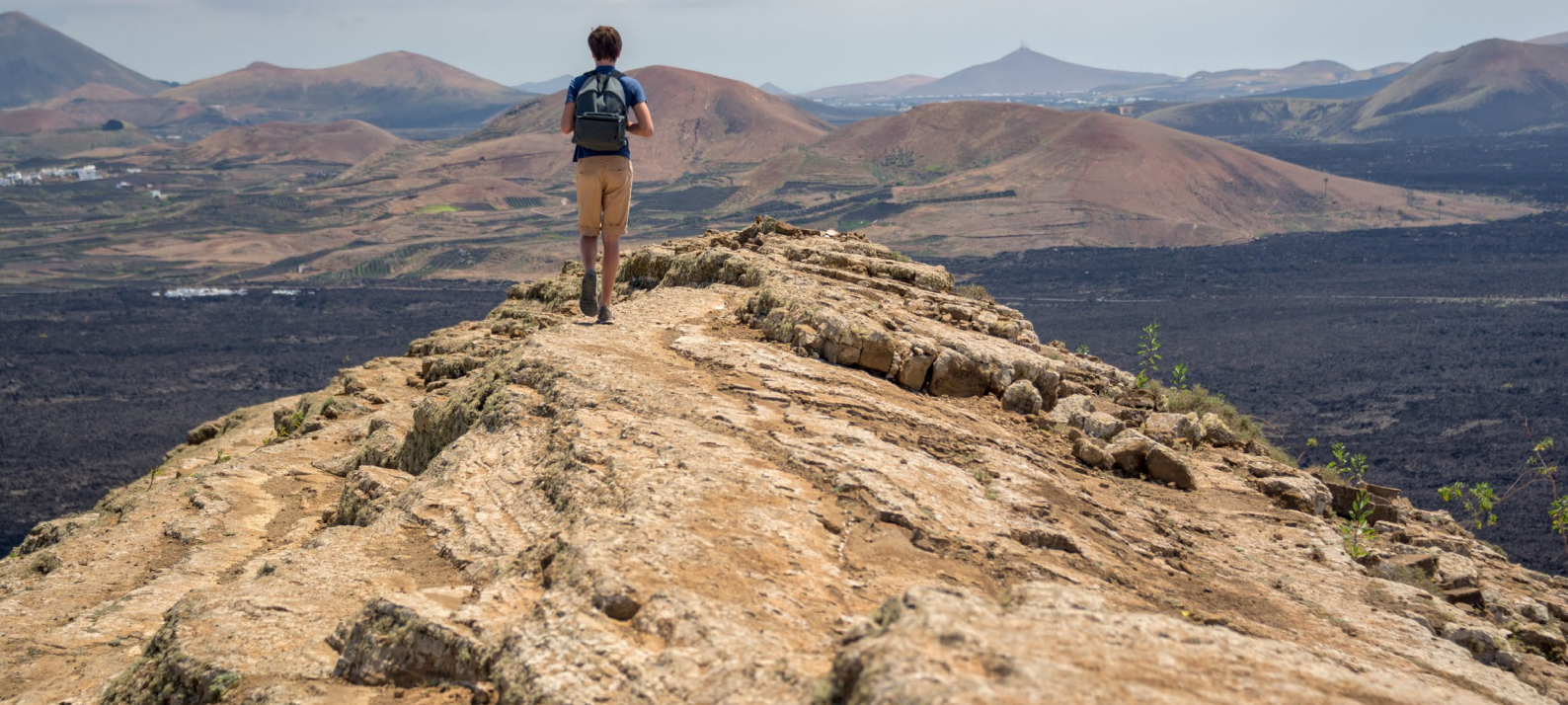
▲ 提曼法亚国家公园 兰萨罗特