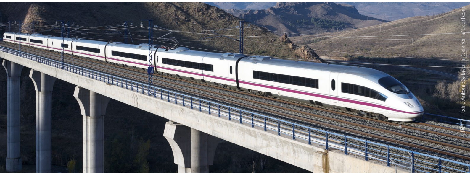
▲ 普洛伊的高速列车 萨拉戈萨