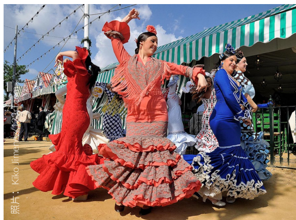
▲ 塞维利亚四月节 塞维利亚

节庆时的塞维利亚是无时不刻都在休闲娱乐的代名词。其节庆地点和节庆摊位都洋溢着音乐、笑容、美食以及美酒或者“雷布希朵（Rebujito）”（雪利酒兑上汽水制成的饮料）。离开之前如果没有品尝过“炸鱼”或者没有观赏让人惊叹的骑士和马车游行就太遗憾了。