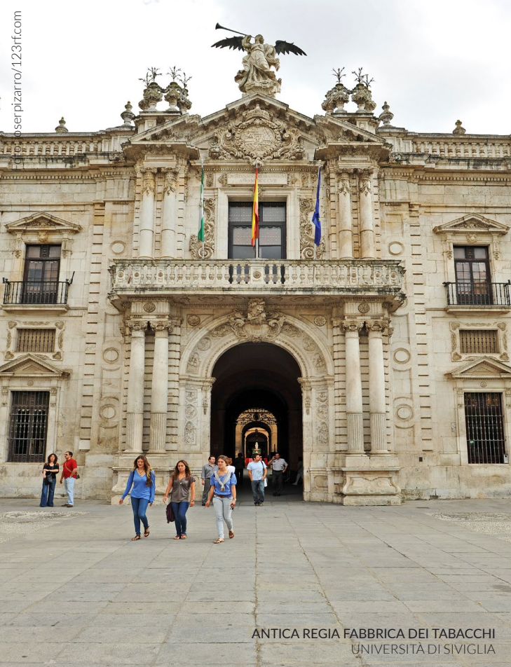
ANTICA REGIA FABBRICA DEI TABACCHI UNIVERSITÀ DI SIVIGLIA