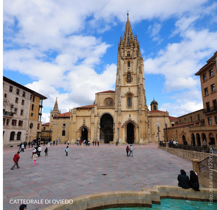
CATTEDRALE DI OVIEDO

Per ottenere la Compostela, il certificato che viene consegnato ai pellegrini che intraprendono il Cammino per motivi religiosi o spirituali, dovrai percorrere almeno 100 chilometri a piedi o a cavallo o 200 in bicicletta.