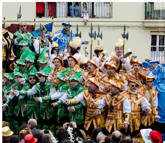
▲ CARNEVALE DI CADICE

Quando arrivano le fallas Valencia si trasforma consegnandosi letteralmente alla musica e alla sua festa più internazionale, iscritta nell'elenco del Patrimonio Culturale Immateriale dell'UNESCO. Per diversi giorni le sue strade si popolano di ninots (gigantesche sculture umoristiche di critica sociale), che finiranno bruciati in grandi falò.