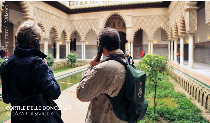
CORTILE DELLE DONCELLAS ALCAZAR DI SIVIGLIA

Viaggia nel passato attraverso paesaggi tranquilli, degusta delizie gastronomiche e scopri le feste popolari e le tradizioni dei luoghi che visiterai lungo il percorso. E se lo desideri, puoi anche percorrere qualche tratto a cavallo, in bicicletta o a piedi.