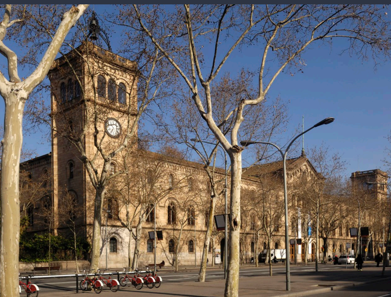
▲ UNIVERSITÀ DI BARCELONA

Città cosmopolita e aperta, la sua posizione geografica e l'offerta culturale e di svago ne fanno la destinazione ideale per trascorrere un soggiorno memorabile. A Barcellona hanno sede alcune delle università più importanti della Spagna, come la Pompeu Fabra, l'Università di Barcellona e l'Università Autonoma di Barcellona.