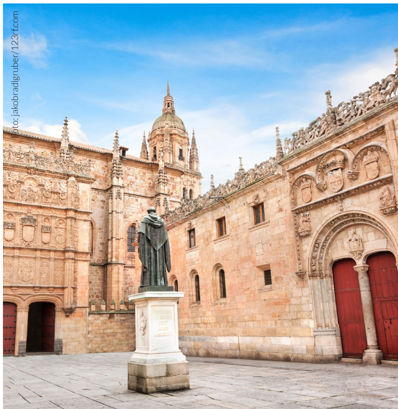
▲ UNIVERSITÀ DI SALAMANCA

L' Università di Salamanca , una delle più antiche della Spagna, è quella di maggiore tradizione e prestigio per l'insegnamento dello spagnolo.