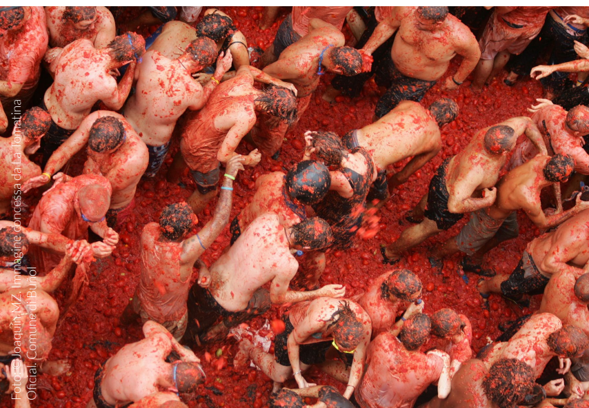
▼ LA TOMATINA BUÑOL

Questa festa divertente, durante la quale i partecipanti si lanciano pomodori, si svolge nella località di Buñol, a Valencia. Partecipa anche tu a questa battaglia campale.