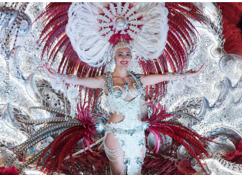
▲ CARNEVALE DI TENERIFE

In Spagna le feste popolari si susseguono durante tutto l'anno. Vivi, senti e goditi la Spagna attraverso le sue feste.