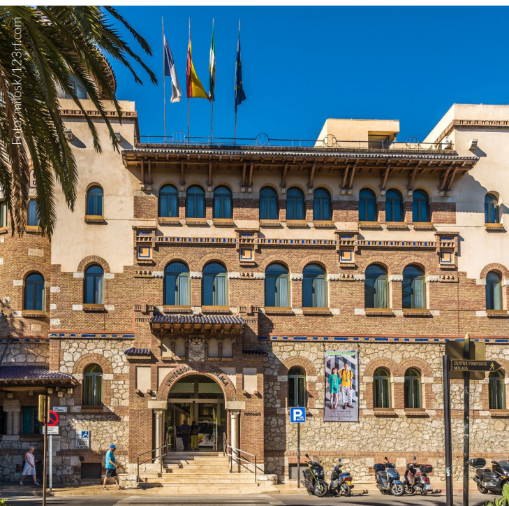
▲ UNIVERSITÀ DI MALAGA