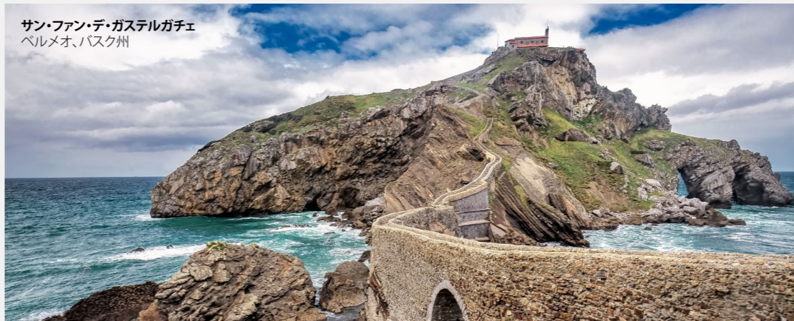
サン・ファン・デ・ガステルガチエ ベルメオ、バスク州

「ゲーム・オブ・スローンズ」の舞台となった場所、あるいは、ジェームス・ボンド、インディアナ・ジョーンズやアナキン・スカイウォーカーがロケをした場所を訪ねてみませんか？スペインはよく映画の舞台に選ばれる国なので、多くの街で映画に関連する観光スポットがあります。あなたの旅の舞台はどこでしょう。