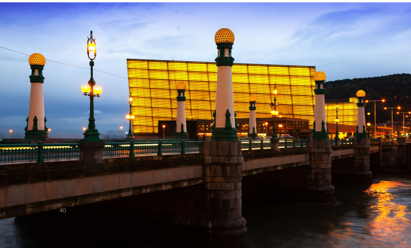
▼ クルサル国際会議場 サン・セバスティアン、ギブスコア県(バスク州)

これらの都市は、鳥たちの目線から眺めを楽しむことができる場所のほんの一部に過ぎません。