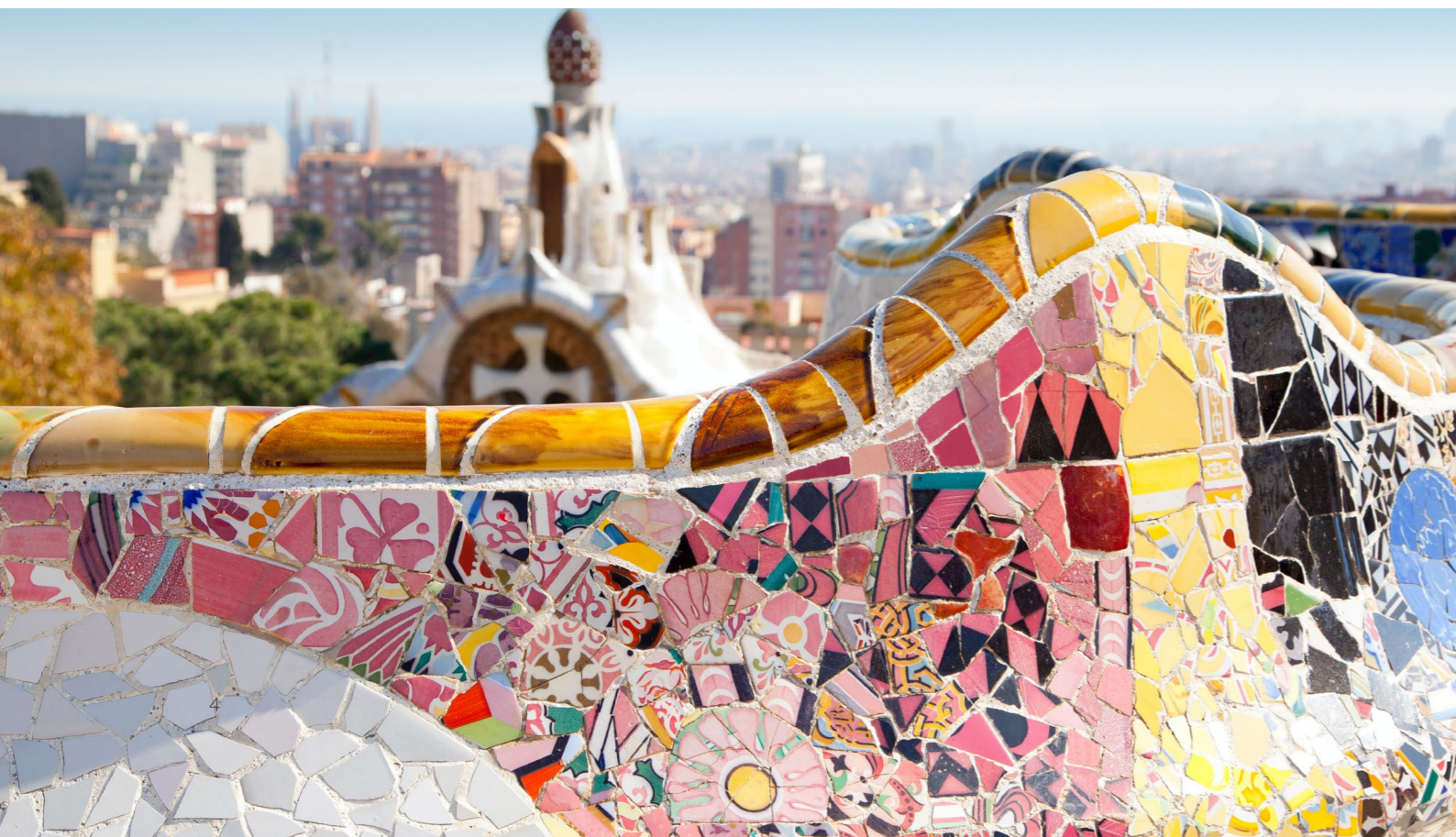
▼ グエル公園 バルセロナ

締めくくりにはバルセロナ現代美術館を訪れてはいかがでしょうか。美術館となっているのはシャンプラ地区にある古い倉庫だった建物ですが、これ自体もモデルニスモ建築の作品です。