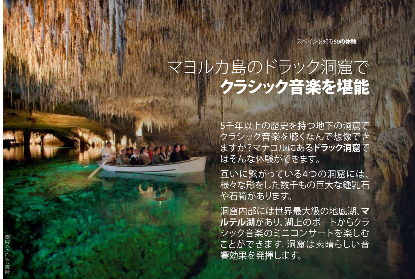
写真: ドラック洞窟

洞窟内部には世界最大級の地底湖、マルテル湖があり、湖上のボートからクラシック音楽のミニコンサートを楽しむことができます。洞窟は素晴らしい音響効果を発揮します。