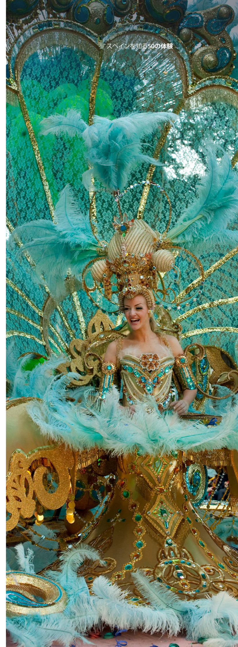
スペインを知る50の体験

1週間以上にわたって街にはお祭りの高揚感があふれ、カーニバルの火曜日になると、見る者すべてを魅了するパレード、デスフィレ・デル・コソで最高潮に達します。翌日、水曜日に行われる鯛の埋葬は祭りの終わりを告げるものですが、カーニバルを象徴する「鯛」が葬儀用の棺に入れられて街を練り歩き、最後に炎に包まれます。