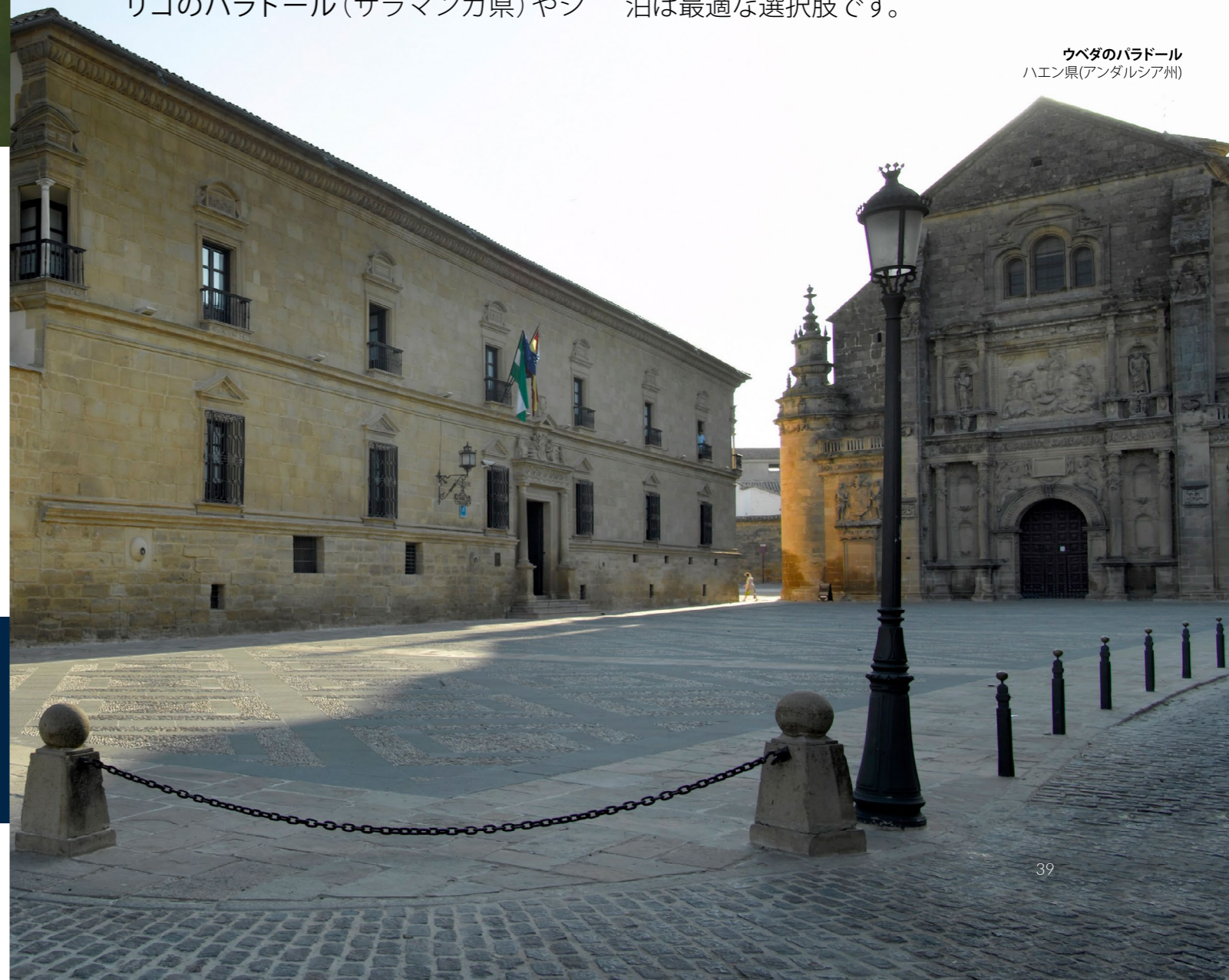
ウベダのパラドール ハエン県(アンダルシア州)

現在、スペインには90を超えるパラドールがあるので、選択肢はたくさんあります。大自然の中、素晴らしい展望ポイント、歴史地区の中心など、そのほとんどが非常に恵まれた場所に立地しています。パラドール自体が歴史モニュメントであるものも多数あります。歴史を間近に感じてみたいなら、パラドールでの宿泊は最適な選択肢です。