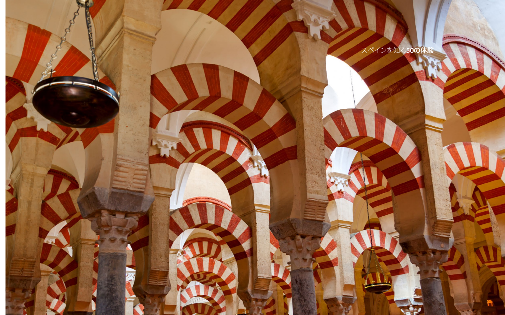
▲ コルドバのメスキータ